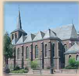
19.45 Uhr St. Nikolaus Kirche Issum Markt 3