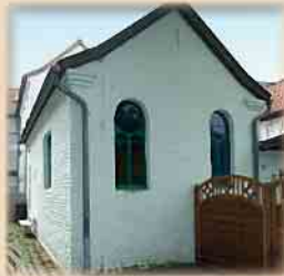
19.00 Uhr Ehemalige Synagoge Issum Kapellener Str. 30