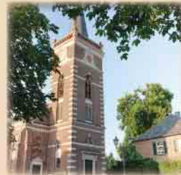
20.30 Uhr Evangelische Kirche Issum Gelderner Str. 24