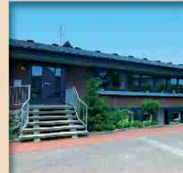
21.15 Uhr Christliche Gemeinde Issum Mühlenstr. 10b