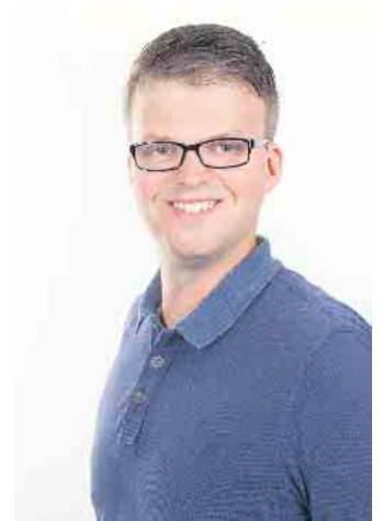
Grün ist: Gemeinsam gut leben

Wir setzen uns außerdem für die Unterstützung unserer Vereine ein. So beantragten wir gemeinsam mit der SPD, dass die Verwaltung künftig Vereine bei der Erstellung von Sicherheitskonzepten für Veranstaltungen wie Kirmes, Karneval oder Martinszüge unterstützt. Für diese immer wiederkehrenden Veranstaltungen sollte es möglich sein, ein in Grundzügen immer wieder abrufbares Kernkonzept zu entwickeln. Auch die Initiative der DLRG Issum-Sevelen e.V. zum Bau eines Schulungs- und Lagertrakts auf dem Gelände des Spaßbades Hexenland begrüßen wir ausdrücklich. Im Rahmen der Haushaltsberatungen haben wir beantragt, 25.000 Euro für die Planung bereitzustellen. Dieser Vorschlag