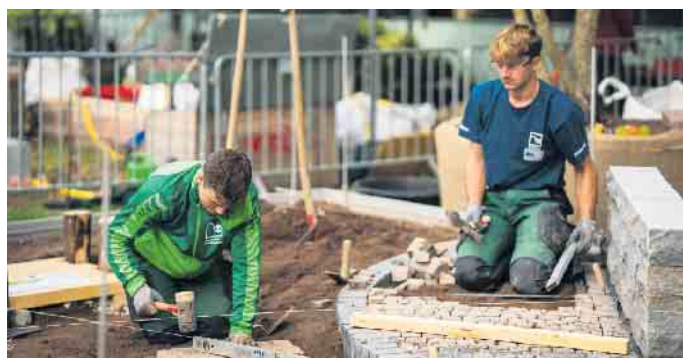
Bei der kunstvollen Verlegung von Pflastersteinen für Wege oder kleinere Plätze ist Teamarbeit und Handwerkskunst gefragt.