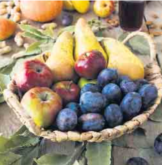
BioWochen NRW bis 14. September

Im September zeigt sich Nordrhein-Westfalen mit einem vielfältigen Angebot regionaler Lebensmittel. Saisonales Obst und Gemüse wie Äpfel, Birnen, Pflaumen, Zwetschgen, Kürbisse, Rote Bete, Pilze, Lauch, Sellerie und vieles mehr sind jetzt frisch verfügbar. Diese Vielfalt sorgt nicht nur für abwechslungsreiche Gerichte, sondern auch für geschmacklich hochwertige und