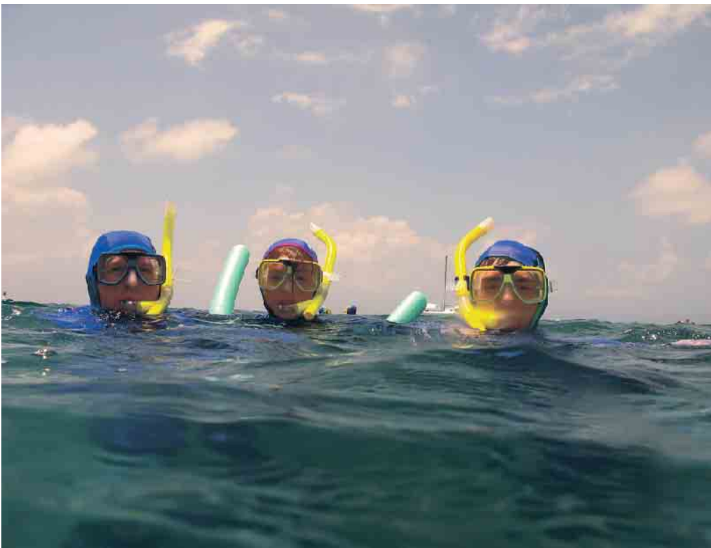
Mitmachen können beim Schnorchelabzeichen kleine und große Schwimmer.

Hintergrundwissen, zum Beispiel zu ABC-Ausrüstung (Tauchmaske, Schnorchel, Flossen), Sicherheit,