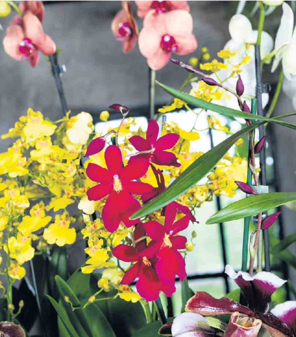
Am 4. September ist der Internationale Tag der Orchidee! Vielfalt und Langlebigkeit zeichnen diese Topfpflanzen aus.