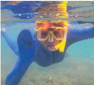
Mit den Schnorchelabzeichen lernt man Abtauchen, Bewegen und Orientieren unter Wasser.

Die Abzeichen stehen übergreifend allen Mitgliedsverbänden im BFS zur Verfügung. Abzeichen und Urkunden können seit 1. Januar auch direkt über den BDS e.V. (Bundesverband deutscher Schwimmmeister e.V.) angefordert werden. (akz-o)