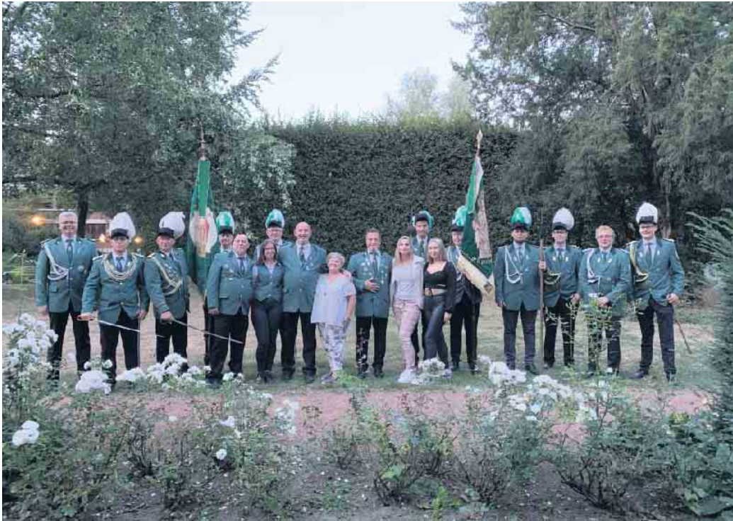
Der neue Thron