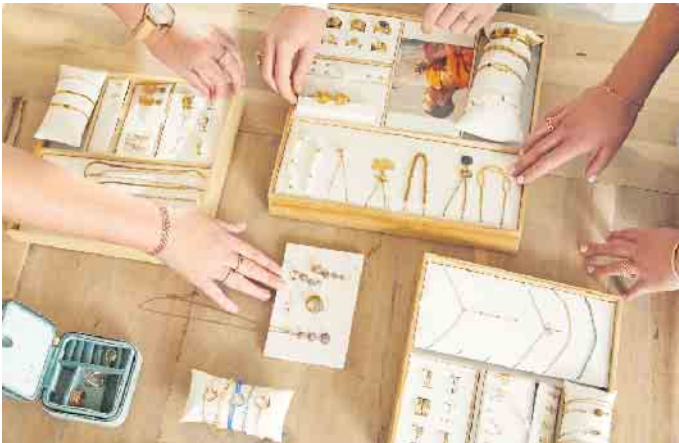
Die komplette Schmuckkollektion wird der Stylistin vom Auftraggeber kostenlos zur Verfügung gestellt.

Schmuckstylistinnen machen ihr Hobby zum Beruf