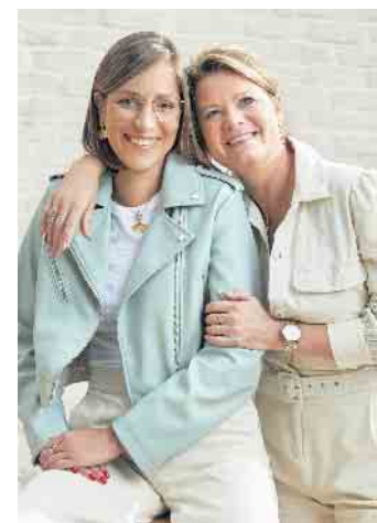
Als Schmuckstylistin sollte man gut mit Menschen umgehen können und Freude am Verkauf haben.

Als Freiberuflerin ist man nicht in einer Firma angestellt, sondern arbeitet selbstständig auf eigene Rechnung. Für jedes verkaufte Schmuckstück erhält man daher eine Provision. Unter www.victoria-schmuck.de ist eine Infobroschüre zum kostenlosen Download bereitgestellt. Es ist möglich, eine Freiberuflichkeit in Vollzeit auszuüben oder auch als Nebenerwerb, als Zusatz zur bisherigen Haupttätigkeit. Wichtig ist, dass man einem zukünftigen Auftraggeber niemals selbst Geld zahlt, um für ihn arbeiten zu dürfen. Seriöse Unternehmen statuen ihre Stylistinnen mit allem aus, was sie für die Ausführung ihres Jobs benötigen. Zudem sollte er eine gründliche Einarbeitung garantieren. (DJD)