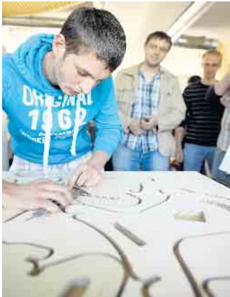
Die Arbeit mit dem Naturmaterial Holz fasziniert die Menschen seit Langem.

Außenhandel mit Schwerpunkt Großhandel zum Beispiel wird immer komplexer. Er bietet sehr gute Chancen auf eine Übernahme und kontinuierliche Weiterbildungen sowie Aufstiegsmöglichkeiten nach dem Ende der Berufsausbildung. Neben der Begeisterung für den Werkstoff Holz zählen Kommunikationsgeschick, Teamfähigkeit und Freude am direkten Kommunizieren mit Lieferanten