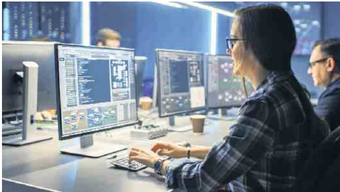
Die Absolventinnen und -absolventen des Studiengangs sollen Cybercrime-Angriffe frühzeitig erkennen und entsprechende Sicherheitsmaßnahmen planen und umsetzen können.

den Fernstudiengängen gibt es unter www.wings.de/it-forensik . Umfassende Ausbildung gegen Hacker Rund 300 IT-Forensiker und Sicherheitsexperten haben bereits ihren staatlichen Hochschulabschluss gemacht. Insbesondere für IT-Fachkräfte bietet das Fernstudium die Möglichkeit, sich neben dem Beruf praxisnah und wissenschaftsbasiert spezifisches Fachwissen anzueignen. Die angehenden IT-Sicherheitsexperten setzen sich vor allem mit dem technischen Vorgehen von Hackern auseinander: Dem Datendiebstahl von Smartphones und Tablets, dem Hacken persönlicher Profile in sozialen Netzwerken oder dem Lahmlegen von