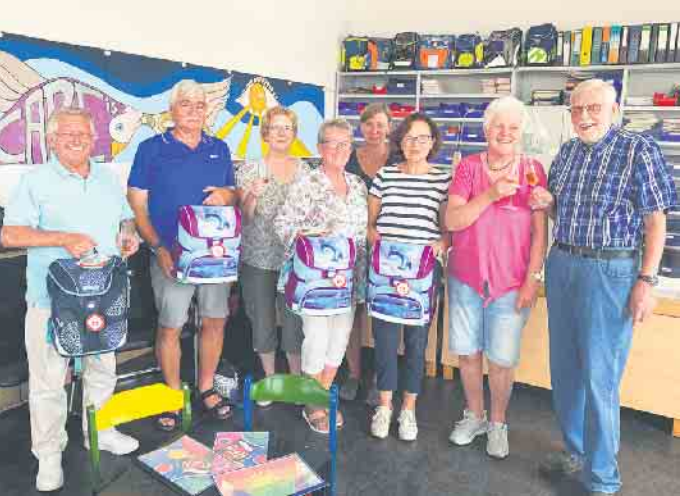
Die ehrenamtlichen Helferinnen und Helfer im Schulmaterialmagazin stoßen auf das 10-jährige Jubiläum an. Sie freuen sich auch in diesem Jahr wieder auf die Ausgabe des Schulmaterials rechtzeitig zu Schulbeginn.

Mit Beginn des kommenden Schuljahres stellt das Schulmaterialmagazin wieder hochwertiges Schulmaterial und für alle Erstklässler einen neuen Tornister zur Verfügung. In der letzten Ferienwoche öffnet das Schulmaterialmagazin am Bahnhof, Brühlscherweg 2, in Geldern seine Türen.