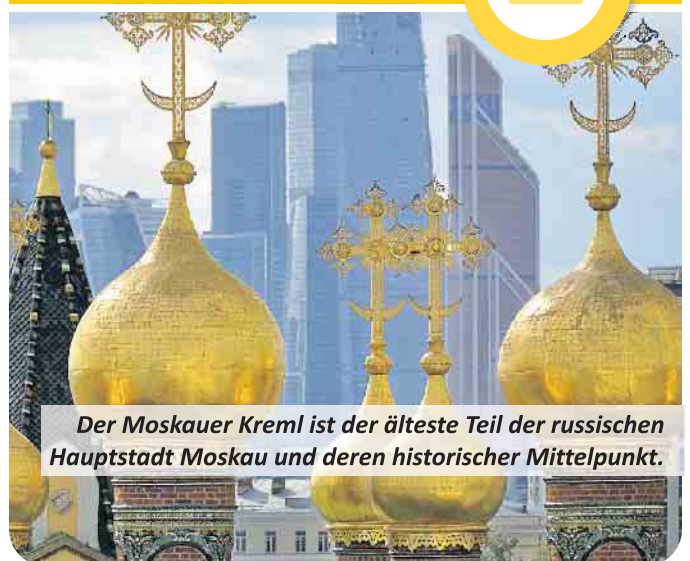
Der Moskauer Kreml ist der älteste Teil der russischen Hauptstadt Moskau und deren historischer Mittelpunkt.