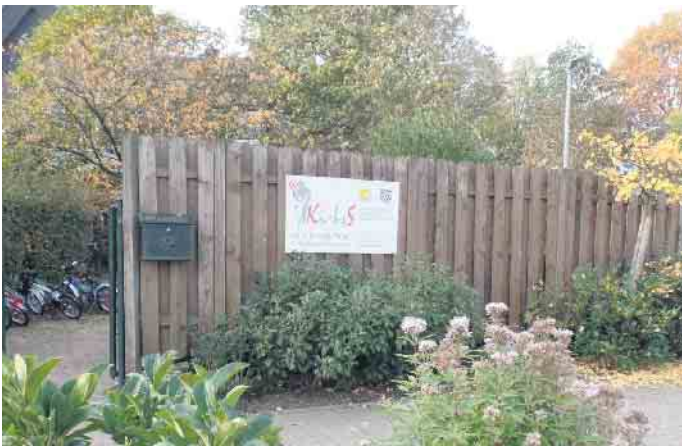
Ki-IsS Familienzentrum - St. Nikolaus Kindergarten

Str. 51, Issum, Gebühr: 4 Euro - 50 Prozent zahlt das Ki-IsS Familienzentrum aus dem Reinerlös der Second-Hand-Shops für Sie! Dozentin: Martina Babenhauser-Heide Anmeldungen bitte beim Ki-IsS Familienzentrum: per E-Mail unter: fz.ki-issum@bistum-muenster.de oder telefonisch unter: 0 28 35 / 33 74 oder online unter www.ki-iss.de/familienzentrum . Anmeldungen sind auch telefonisch bei der Familienbildungsstätte in Geldern möglich: 02831-134 600 oder unter www.fbs-geldern-kevelaer.de .