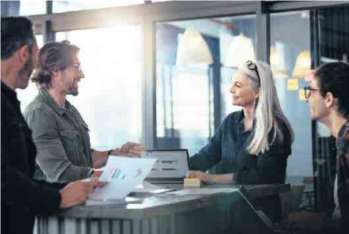
Der Bildungsurlaub dient der Weiterbildung, die nicht immer zwingend berufsspezifisch sein muss.

Bei fortlaufendem Gehalt in die eigenen Kompetenzen investieren