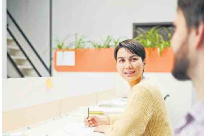
Bildungsurlaub ist eine gesetzlich geregelte, bezahlte Freistellung im derzeitigen Job, um sich weiterzubilden.

Der Bildungsurlaub muss frühzeitig, meist vier bis sechs Wochen vor Beginn, beim Arbeitgeber beantragt werden und zudem in dem Bundesland, in dem man arbeitet, anerkannt sein. Nach der Auswahl eines Kurses erhalten die angehen-