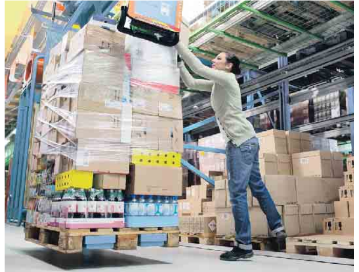
Erkrankungen des Muskel-Skelett-Systems machen den größten Anteil an den Arbeitsunfähigkeits-Tagen aus.

Tätigkeiten zählen unter anderem das Heben und Tragen von Lasten, Zwangshaltungen, sich ständig schnell wiederholende Tätigkeiten und Vibrationen. Für den Einstieg in die Gefährdungsbeurteilung von Muskel-Skelett-Belastungen haben BAuA und die Deutsche Gesetzliche Unfallversicherung Checklisten herausgebracht. Im Idealfall können hieraus bereits wirksame Maßnahmen abgeleitet werden. Ist die Beurteilung komplexer, sollte der betriebliche Praktiker ein vertiefendes Verfahren nutzen oder einen Experten hinzuziehen. Speziell für kleinere Unternehmen hat die Berufsgenossenschaft Energie Textil Elektro Medienerzeugnisse (BG ETEM) den