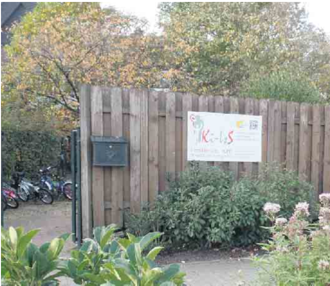
Ki-IsS Familienzentrum - St. Nikolaus Kindergarten