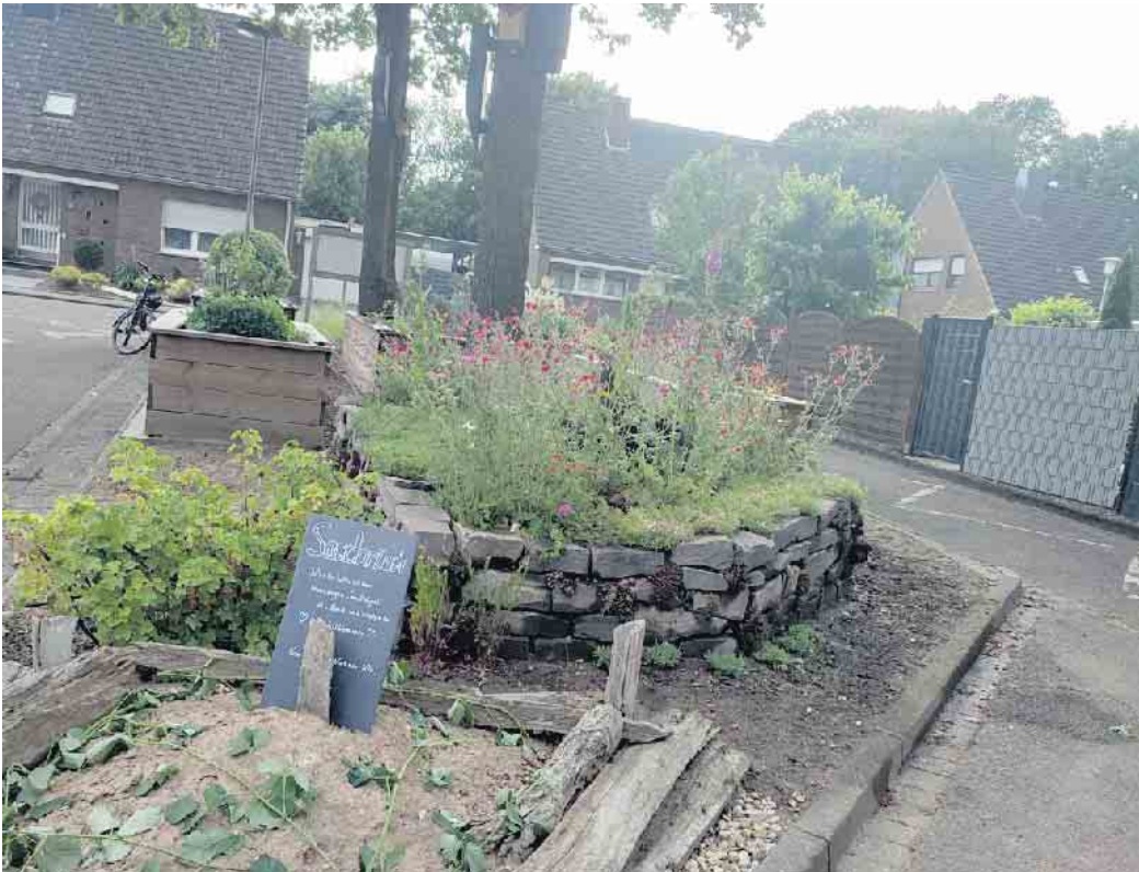
Das Nachtleben von Schaephuysen. Eine Freifläche mit Hochbeeten und Nahrung für Nachtfalter