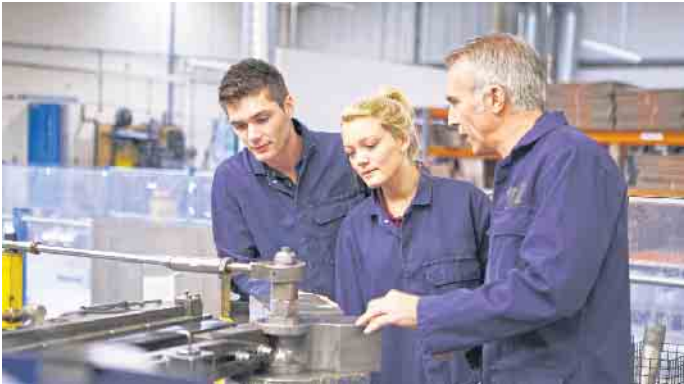
Ein Angebot wie die betriebliche Krankenversicherung wird als besondere Wertschätzung durch den Chef empfunden: Man wird im Freundeskreis gerne davon erzählen und Werbung für die eigene Firma machen.

stehen, zeigt: Die junge Generation will ihr Leben bei aller Flexibilität vorausschauend gestalten.“ (djd)