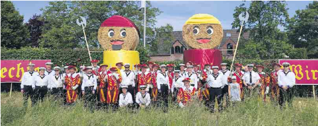
Der Spielmannszug zu Gast bei den Landsknechten aus Traar

Die Spielleute des Marine Spielmannszuges Blau-Weiß Schae-phuysen blicken auf einige schöne Auftritte im ersten Halbjahr zurück. So waren wir am Rosenmontag zu Gast bei der Karnevalsgesellschaft „alle Mann an Bord“. Mit circa 100 maritim gekleideten Personen nahmen wir am Rosenmontagsumzug durch die Innenstadt in Duisburg teil. Ein weiteres Highlight war das Schützenfest in Vorst, bei dem wir jedes Jahr sowohl den Umzug sonntags als auch den großen Zapfenstreich montagsabends an der Kirche begleiten dürfen. Das ist jedes Mal sehr ergreifend, wenn wir gemeinsam mit der Blasmusik aus Oedt vor so einem großen Publikum aufmarschieren dürfen. Ende Mai schloss sich das Schützenfest in Traar an. Man soll es nicht für möglich halten, aber dort wächst Brauchtum und es wird gelebt. Alle vier Jahre feiert die Dorfgemeinschaft ihr Fest. Ungefähr 35 Gruppen in der Stärke von 10 bis 20 Leuten leihen sich für die fünf Festtage Uniformen aus, um mit Ihrem Club ganz groß raus zu kommen. Ein bunt gemischter Umzug begleitet von der Reiterei und 14