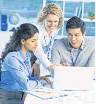
Motivierte und gut ausgebildete junge Menschen erwarten bei ihrem künftigen Arbeitgeber nicht nur ein schönes Gehalt und gute Karrierechancen - auch das Drumherum muss stimmen.