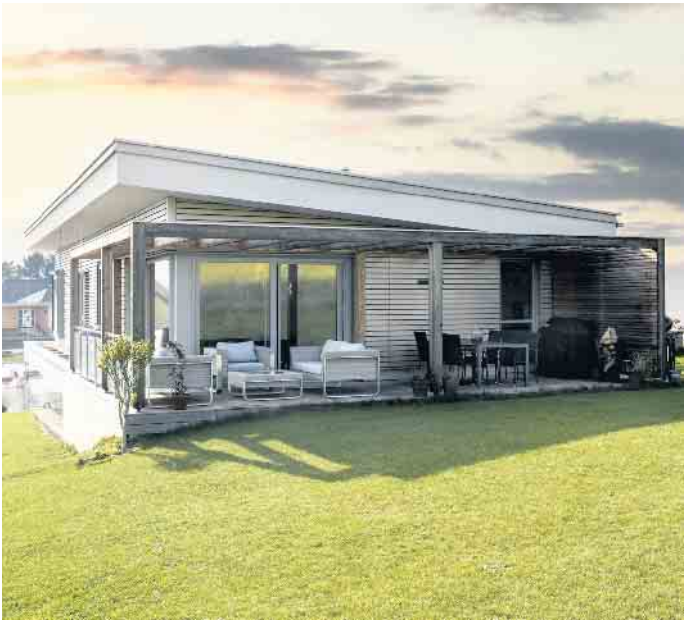
Bungalows in Holz-Fertigbauweise können alle individuellen Gestaltungswünsche erfüllen.

les lässt sich mit einem modernen Fertighaus individuell auf die Wünsche und Bedürfnisse des Bauherrn anpassen und planungssicher in die Tat umsetzen“, schließt Tews. (BDF/FT)