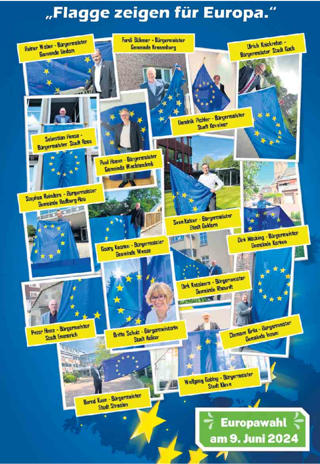
(Grafik: Stadt Geldern)