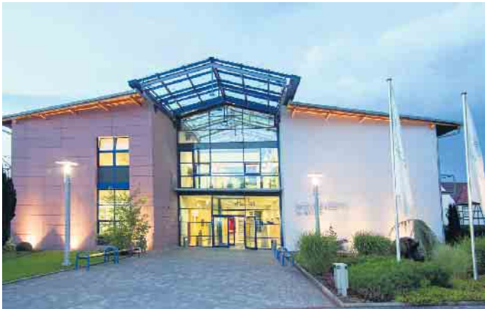
Das Bundesausbildungszentrum der Bestatter.

Bestatter fühlen sich als Experten im Umgang mit dem Tod dem deutschen Handwerk besonders verbunden. Um die hohe Qualität der Ausbildung zu gewährleisten, fordert der