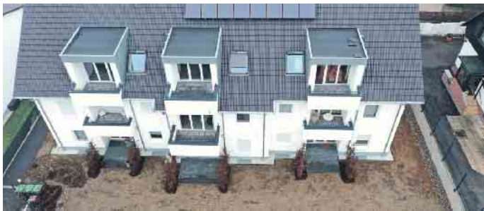
Das Dachdeckerhandwerk, der richtige Ansprechpartner für die Solar-anlage auf dem Dach.

arbeiten und dabei auch Klimaschüt-zer sein wollen, liegen mit einer Aus-bildung im Dachdeckerhandwerk genau richtig“, rät ZVDH-Präsident Dirk Bollwerk und ergänzt, dass das Dachdeckerhandwerk bislang auch gut durch die Coronakrise gekom-men sei: kaum Kurzarbeit und weni-ge Entlassungen. Auch dies ein Plus-punkt, der für eine Dachdecker-Aus-bildung spricht: Dachdecker sind immer gefragt. Mehr Infos unter www.dachdeckerdeinberuf.de (akz-o)