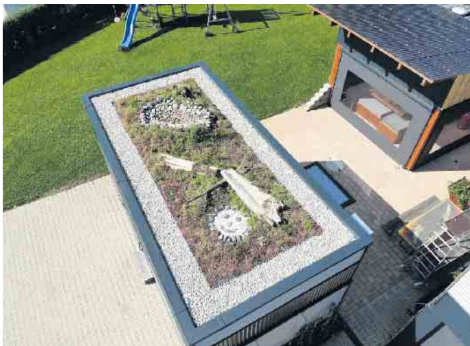
Mehr Grün für die Stadt: Flachdächer lassen sich in kleine Biotope verwandeln.

Die dritte Form neben extensiver und intensiver Begrünung ist die Anlage eines ökologisch wertvollen, naturnahen Dachbiotops. Dabei legen erfahrene Dachexperten Wert auf eine naturnahe, abwechslungsreiche Gestaltung mit insektenfreundlichen Biotopelementen, variierenden Substratstärken sowie blütenreicher Bepflanzung für Bienen und Schmetterlinge zum Schutz der Artenvielfalt. Komplettsysteme beispielsweise von Bauder erleichtern den Aufbau langlebiger und dichter Gründächer, unter www.bauder.de etwa finden sich mehr Details sowie Ansprechpartner im Fachhandwerk vor Ort. Erfahrene Experten begleiten die gesamte Planung und Ausführung und können darüber hinaus nützliche Tipps zur Pflege des Gründachs geben. Übrigens: Einige Kommunen fördern die Dachbegrünung, zum Bei-