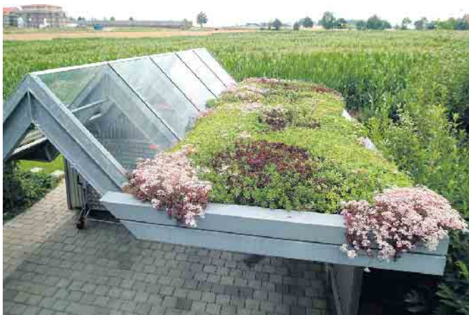
Auch auf kleinen Flächen wie dem Dach eines Carports kann viel Grün sprießen.

spiel durch Nachlässe bei den Abwassergebühren. Details dazu sind mit der örtlichen Verwaltung zu klären, dabei können die Fachbetriebe ebenfalls unterstützen. (DJD)