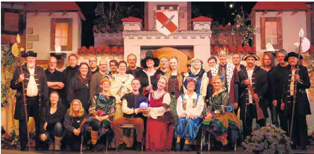
Über 8.500 Besucherinnen und Besucher wollten im vergangenen Jahr das 37. Weihnachtsmärchen Straelen „Das blaue Licht“ in der bofrost*HALLE sehen. Jetzt freut sich das Märchenteam des Kulturring Straelen e.V. auf die neue Inszenierung, die ab dem 15. Dezember Premiere feiert.

In diesem Jahr dürfen sich alle Märchenfans auf eine Inszenierung von „Das Wasser des Lebens“, in einer eigenen Bearbeitung frei nach den Gebr. Grimm, natürlich wieder mit „Happy End“ und einem großen Finale, freuen. Ein riesiges Bühnenbild mit viel Liebe zum Detail, eine kindgerechte Umsetzung der Geschichte, faszinierende Amateurdarsteller, die alle Kinder immer in die Handlung einbeziehen und nicht zuletzt die professionelle Bühnentechnik mit ganz besonderen Effekten garantieren wieder einen unterhaltsamen Theaternachmittag in der Vorweihnachtszeit. Auch in diesem Jahr bleibt der Kartenpreis wie im vergangenen