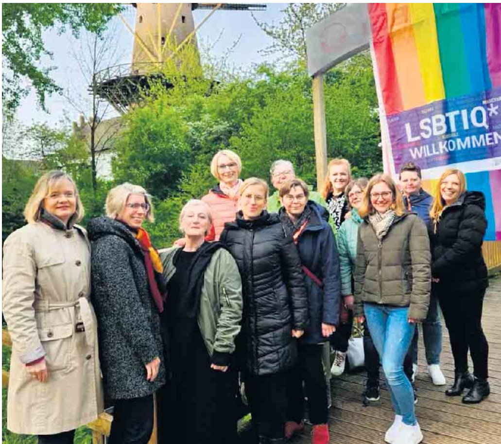
Mitglieder der Arbeitsgemeinschaft der Gleichstellungsbeauftragten im Kreis Kleve

In Anbetracht der gegenwärtigen gesellschaftlichen Herausforderungen und kontinuierlichen Bemühungen um Akzeptanz und Gleichberechtigung nehmen die Gleichstellungsbeauftragten im Kreis Kleve eine klare Stellung ein, um die Bedeutung des Aktionstags gegen Homophobie zu betonen.