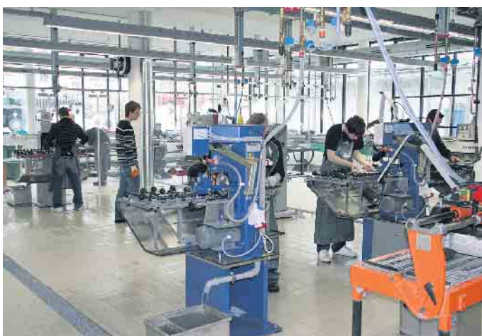
Ausbildung in der Flachglasindustrie.

tung Glastechnik soll die Studierenden im Werk und an der Fachhochschule auf eine spätere Tätigkeit in der Glasindustrie vorbereiten, und zwar mit der Orientierung auf die Optimierung von Fertigungsanlagen sowie der Produktionssteuerung und -überwachung“, so Grönegräs. Dazu komme die eigenständige Durchführung von Projekten, die Konzeption und Entwicklung von kundenspezifischen Produkthanforderungen, der technische Einkauf und die Materialwirtschaft. „Das Studium dauert sechs Semester, danach steht einer Laufbahn als Nachwuchsführungskraft in der Flachglasindustrie nichts mehr im Wege“, so Grönegräs abschließend zu den zahlreichen Ausbildungsmöglichkeiten in einer hoch spannenden Branche. (BF/DS)