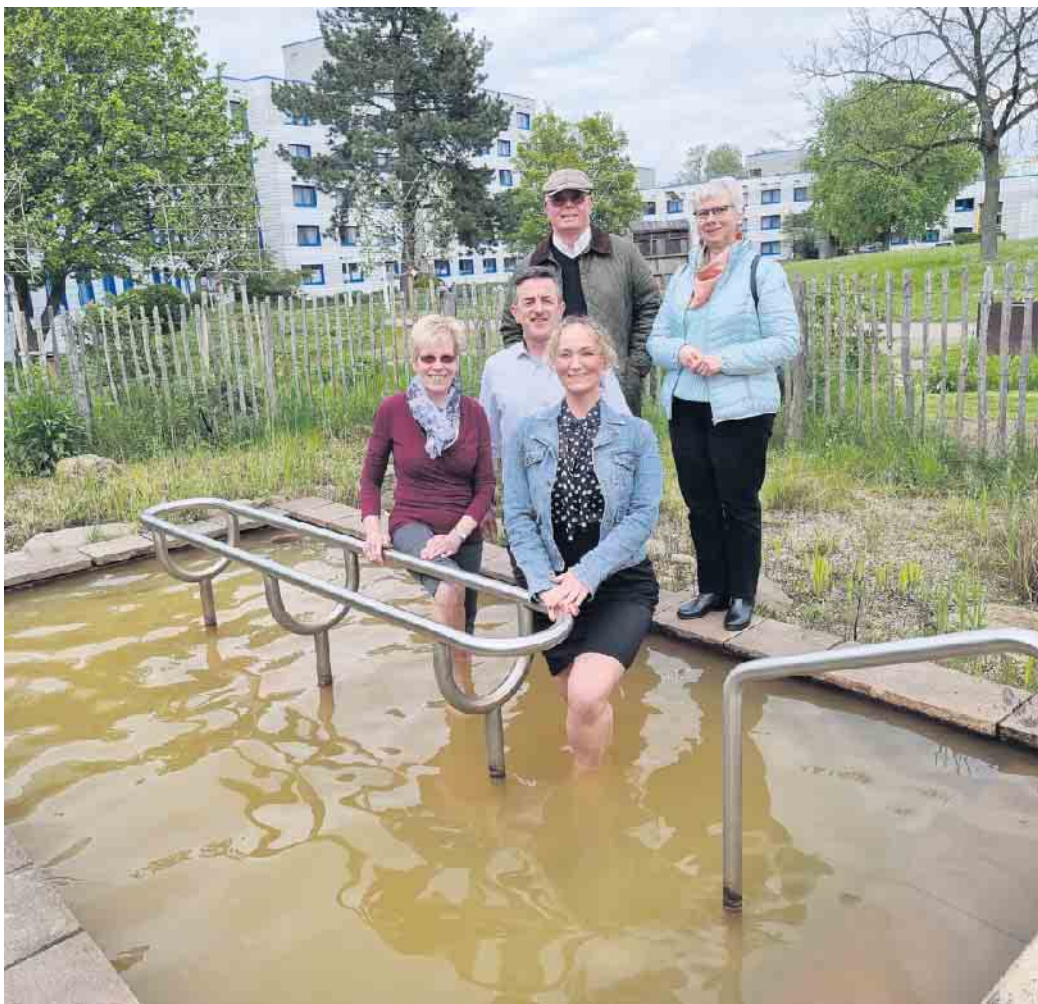
„Antreten“ im Kneipp-Garten

Sebastian Kneipp hat schon im 19. Jahrhundert erkannt und in seinen ganzheitlichen naturheilkundlichen Büchern niedergeschrieben, dass jeder täglich etwas für seine eigene Gesundheit tun sollte: „Das Leben ist das höchste Gut nicht allein, vielmehr ist es die Gesundheit; sie ist der größte Reichtum. Ohne Gesundheit ist der Reichste ein armer Tropf.“ Deshalb empfahl er zur Kräftigung und Gesunderhaltung des Körpers Wasseranwendungen. Das Wassertreten im Storchengang ist die berühmteste Wasseranwendung des Gesundheitspioniers. Es regt den Kreislauf und den Stoffwechsel an und stärkt das Immunsystem. Es fördert die Durchblutung, kräftigt die Venen, hilft gegen Krampfadern