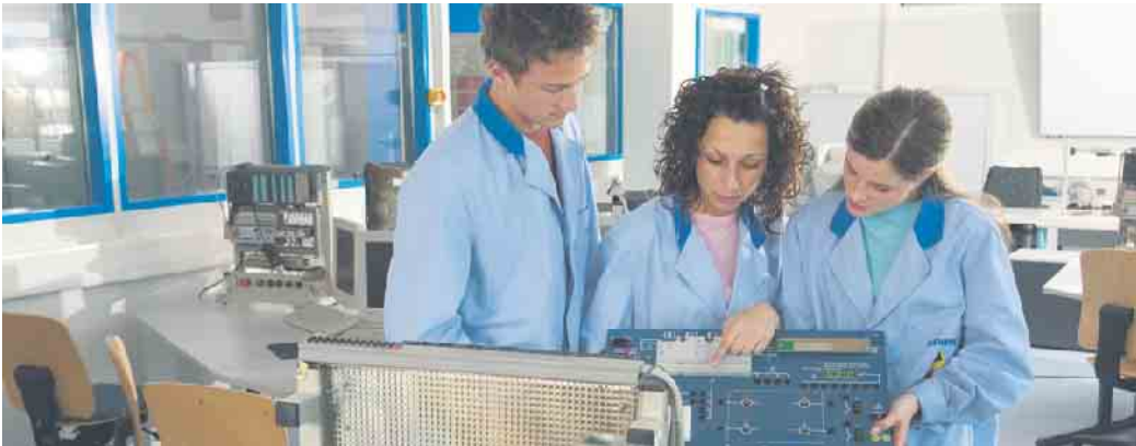
Während eines Praktikums gewinnt man Einblicke ins Berufsleben.

Wenn man in seinem Lebenslauf ein Praktikum oder sogar mehrere Praktika stehen hat, macht das einen guten Eindruck auf Personalverantwortliche. Es zeigt, dass man sich selbst ein Bild vom Beruf gemacht hat und engagiert ist. Im Bewerbungsgespräch für einen Ausbildungsplatz kann man eine Berufswahl besser begründen, da man aus eigener Erfahrung spricht. Zusätzlich ist das Erstellen einer Bewerbung für ein Praktikum auch eine gute Gelegenheit um herauszufinden, wie fit man mit Lebenslauf, Anschreiben und Co. ist. (wwp)