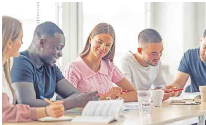
Die kompakten Lehrveranstaltungen finden in einem der Studienzentren der Hochschule statt.

Mit einer dualen Ausbildung im Bereich Fitness und Gesundheit durchstarten