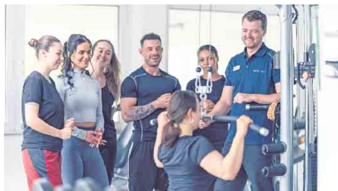
Die Verbindung von Theorie und Praxis macht den Reiz der dualen Bachelor-Studiengänge aus.