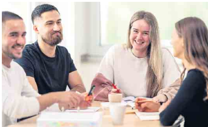
Die dualen Bachelor-Studiengänge bestehen aus einem Fernstudium in Kombination mit kompakten Lehrveranstaltungen.

Gesundheit ist ein zentraler Wert unserer Gesellschaft und Fitnessstudios sind deshalb immer gefragter. Aufgrund der wachsenden Bedeutung der Zukunftsbranche kann es sich daher lohnen, sich in Berufen rund um Fitness- und Gesundheitstraining zu qualifizieren. Fitnesstraining stellt noch immer die mitgliederstärkste Trainingsform in Deutschland dar, die Studios leisten einen wichtigen Beitrag, damit Millionen Menschen von den vielfältigen Gesundheitseffekten profitieren können.