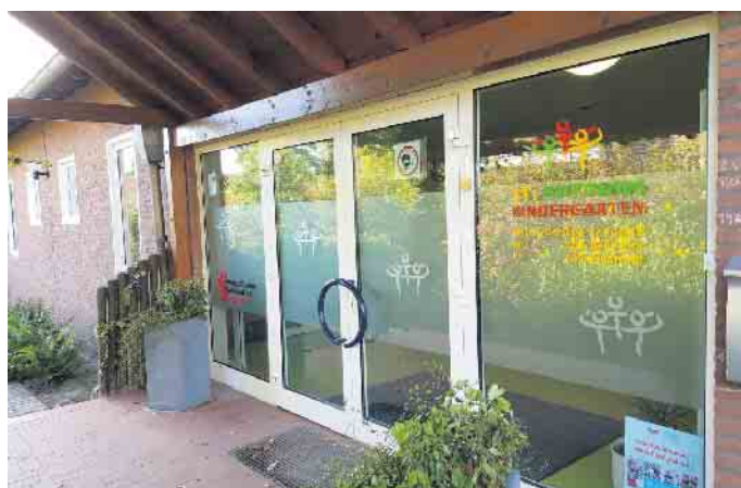
St. Antonius Kindergarten Sevelen