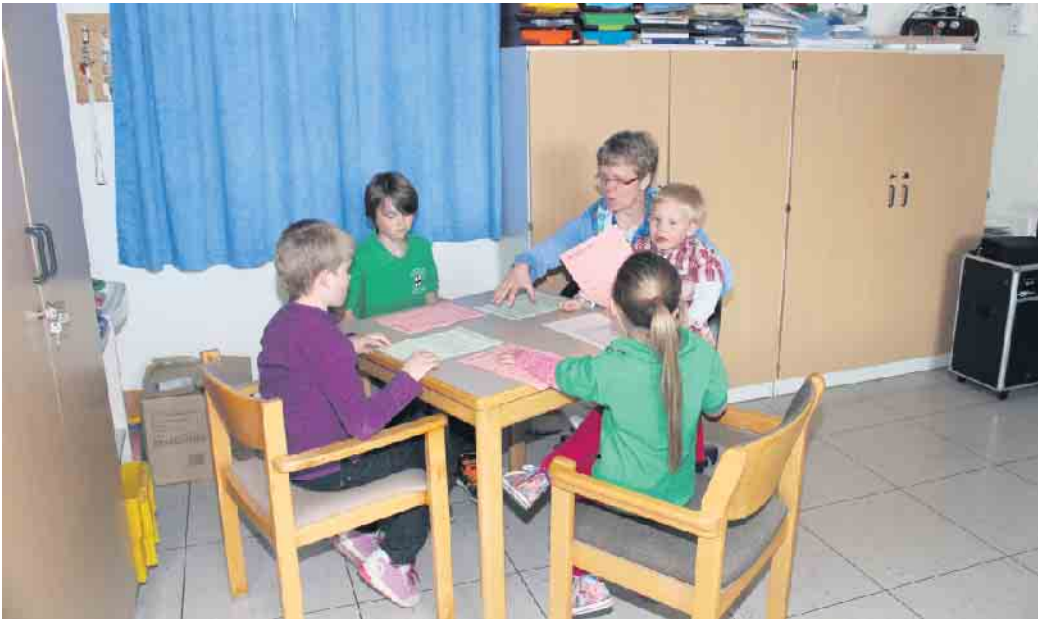
Eindrücke der letzten Musikolympiade

schaftsgrundschule Menzelen (Ringstraße 92 in Alpen) Datum: So., 23.04.2023 Beginn: 11 Uhr Ende: ca. 15 Uhr Anmeldeschluss: Di., 11.04.2023 Anmeldung per Mail an Info@Musikverein-Menzelen.de mit Angaben über Name, der E-Mail-Adresse, Geburtsda- tums, Instruments und Ausbil- dungsdauer