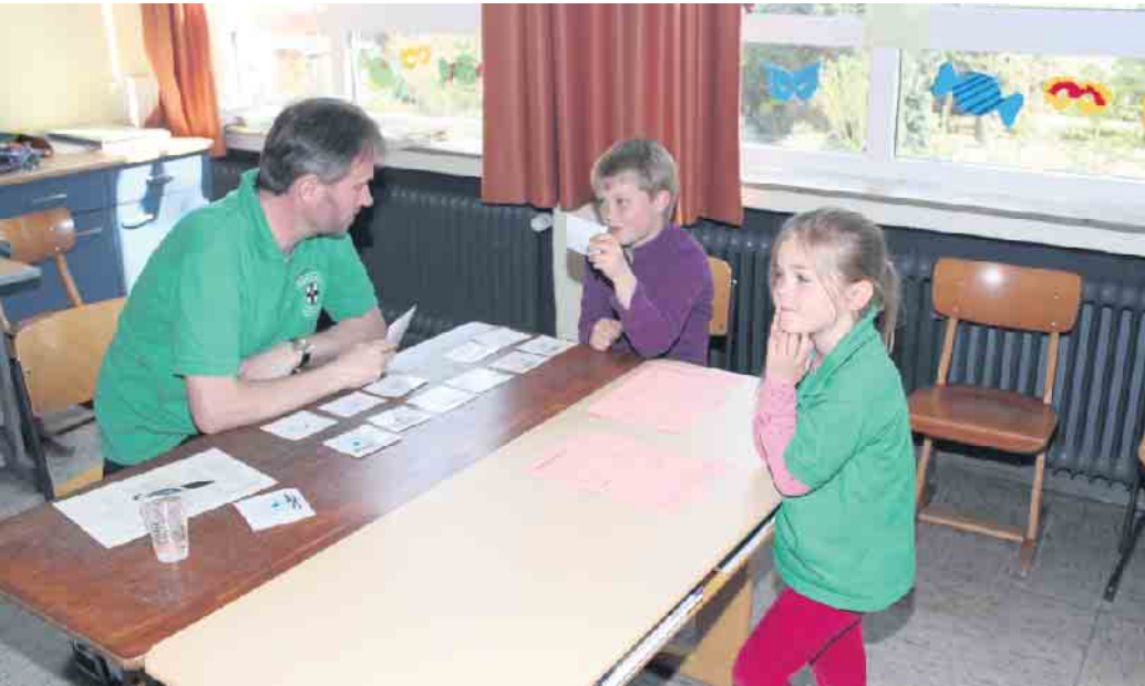
Eindrücke der letzten Musikolympiade