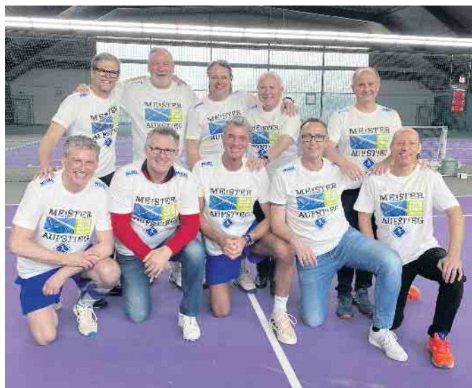
Herren 50: Aufsteiger 2024!