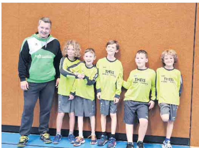
Das Bild zeigt die U10.

Die Vereinskoooperation TV Asberg/SpVgg Rheurdt-Schaephuyzen startete wieder mit einer Jugendmannschaft in den Spielbetrieb. Die fünf Spieltage wurden in Siegburg und Leverkusen durchgeführt.