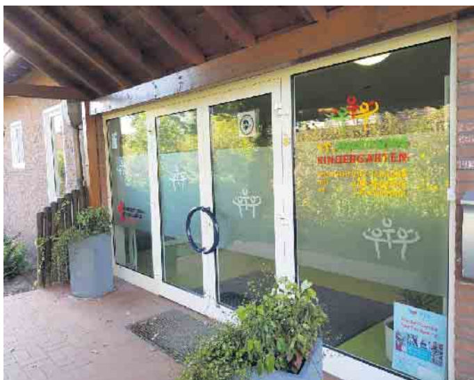
St. Antonius Kindergarten in Sevelen

Ein Angebot des Ki-IsS Familienzentrums - hier St. Antonius Kindergarten Sevelen