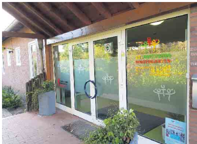
St. Antonius Kindergarten, Im Huck 6 in Sevelen