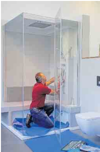
In der SHK-Branche ist technisches Verständnis und Gespür beispielsweise für die Badgestaltung gefragt.

Solartechnik. Für Kaufleute eröffnen sich vielfältige Arbeitsmöglichkeiten etwa in der Auftragsbearbeitung, Beschaffung, im Rechnungswesen und in der Personalverwaltung. Auch in Verkauf, Beratung und Marketing gibt es interessante Tätigkeiten. Mehr Informationen zu Ausbildungsmöglichkeiten sowie zu Stellenangeboten sind unter www.diebadgestalter.de/jobs zu finden. Unter der Marke „Die Bad- und Heizungsgestalter“ versammeln sich deutschland- und österreichweit über 130 Fachbetriebe, die sich einheitlichen und hohen Qua-