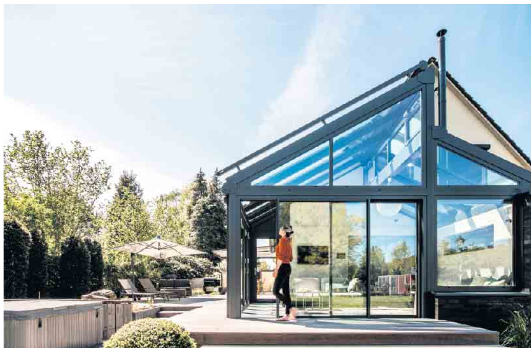
Schöne Aussichten dank staatlicher Zuschüsse: Für einen Wintergarten können Hausbesitzer von Förderungen profitieren.

Die Voraussetzungen für eine Förderfähigkeit erfüllt Solarlux als aktuell einziger Hersteller mit seinen hochwärmegeprägten Wintergärten. Hauseigentümer erhalten umfassende Unterstützung beim Wintergartenbau, von der Prüfung der Förderfähigkeit über den Antrag bis zur Realisierung. Bei beiden Förderungsvarianten sind besondere bauliche Gegebenheiten und energetische Anforderungen zu berücksichtigen. So ist es zwingend notwendig, den Antrag für die Förderung vor dem Baubeginn zu stellen. Zu den weiteren Kriterien bei der Förderung über die BAFA gehört unter anderem, dass der Bauantrag des Bestandshauses älter als fünf Jahre sein muss. Eine Anforderung für die Förderung mittels Ein-