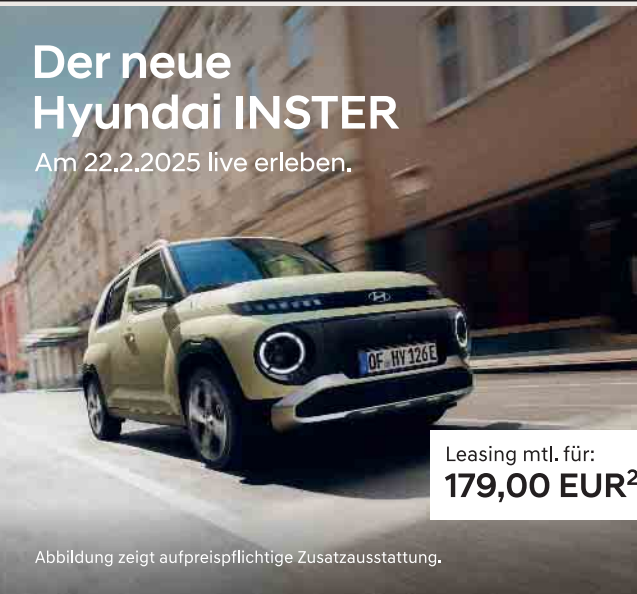
Abbildung zeigt aufpreispflichtige Zusatzausstattung.

Erleben Sie den neuen Hyundai INSTER als einer der Ersten. Am 22.02.25 von 9 - 14 Uhr in unserem Autohaus am Hoogeweg 146 in Kevelaer. Kommen Sie vorbei und überzeugen Sie sich selbst, welche Möglichkeiten dieser kompakte Elektro-Flitzer für Sie bereithält. Das innovative Raumkonzept und eine Reichweite von bis zu 370 km 1 bietet nahezu unbegrenzte Möglichkeiten. Freuen Sie sich auf eine tolle Produktpräsentation und genießen Sie ein Stück Kuchen oder eine frisch gegrillte Bratwurst. Wir freuen uns auf Ihren Besuch.