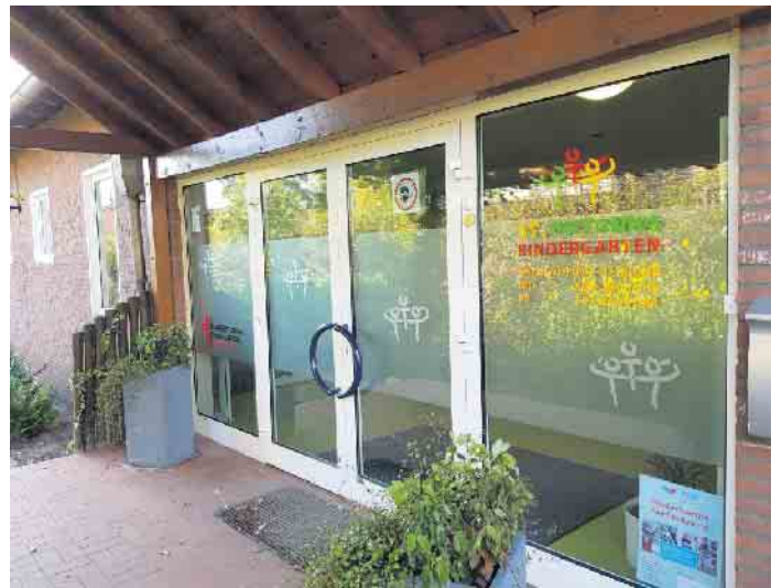
St. Antonius Kindergarten, Sevelen

Anmeldungen sind auch telefonisch bei der Familienbildungsstätte in Geldern möglich: