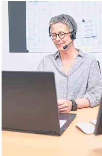
Schon am ersten Tag sollte ein fertig eingerichteter Arbeitsplatz zur Verfügung stehen.

tauschen und Interesse am Gegenüber haben. Denn wir müssen für eine gute Beratung auch viel zuhören und die Bedarfe der Menschen wahrnehmen.“ (DJD)