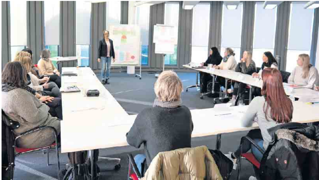
Zu einer guten Einarbeitung können auch Schulungen gehören, in denen Wichtiges über die Firma oder spezifische fachliche Anforderungen vermittelt werden.

Zu einem gelungenen Onboarding, wie die Einarbeitung heute auch heißt, gehören die persönliche Begrüßung am ersten Arbeitstag, ein vorbereiteter Einarbeitungsplan und die entsprechend vereinbarten und vorbereiteten Termine sowie die Vorstellung des neuen Kollegiums. Ebenfalls wichtig: genug Zeit. „Bei compass gibt es für neue Pflegeberater und Pflegeberaterinnen eine Einarbeitungszeit von mehreren Monaten. In dieser werden in Schulungen Fachkenntnisse und Kompetenzen vermittelt. Außerdem werden die Neuen von erfahrenen Kolleginnen und Kollegen begleitet und so an die Tätigkeit herangeführt. Jeder Mitarbeitende bekommt zudem am ersten Tag eine komplette Arbeitsausrüstung und ab einem bestimmten Stundenumfang in der Pflegeberatung vor Ort auch einen Dienstwagen gestellt“, beschreibt Wessel. Unter www.compass-pflegeberatung.de sucht das Unternehmen zurzeit bundesweit Pflegefachkräfte, Sozialversicherungsangestellte und Personen mit passendem Studium für die Pflegeberatung vor Ort sowie für die telefonische Beratung an den Standorten Köln und Leipzig. Dort kann unter der kostenfreien Nummer 0800 - 101 88 00 jeder Anrufende