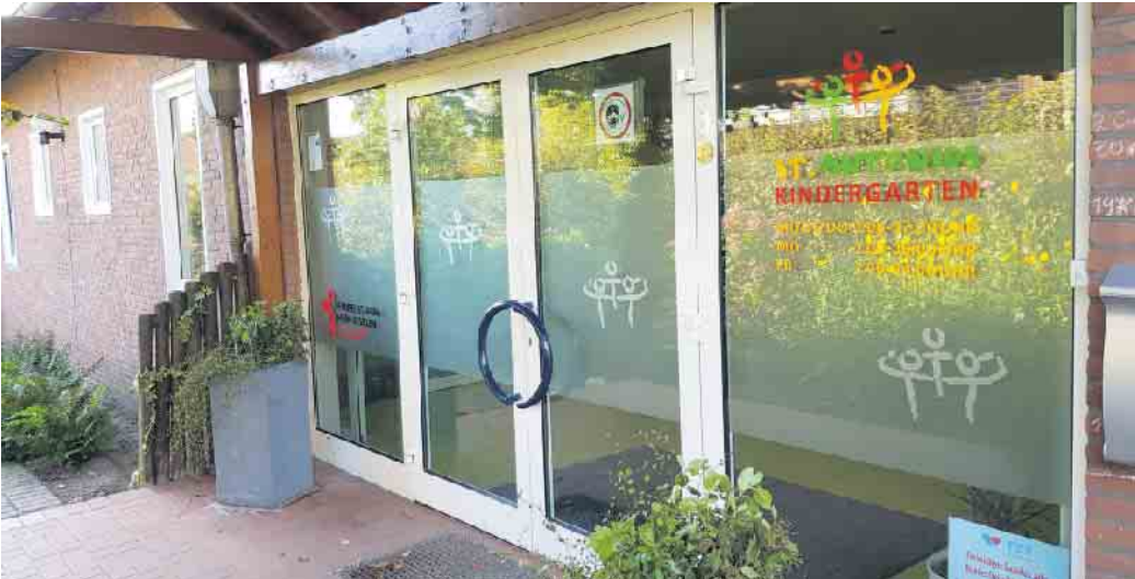
St. Antonius Kindergarten Sevelen

Geschwister haben sich nicht ausgesucht, wachsen aber zusammen auf. Sie streiten und sie lieben sich. Trotz mancher Konflikte verbindet Geschwister eine ganz besondere Liebe. Ein Abend mit Gedanken und Tipps zu einer Beziehung, die Menschen zeitlebens prägt. Termin: Donnerstag, 27. März, 19.30 bis 21.45 Uhr , Ort: St. Antonius Kindergarten, Im Huck 6, Issum-Sevelen , Gebühr: 4 Euro - 50 Prozent zahlt das Ki-IsS Familienzentrum aus dem Reinerlös der Second-Hand-Shops für Sie! Dozentin: Antje Freudenberg, Sozialpädagogin Anmeldungen bitte beim Ki-IsS Familienzentrum: per E-Mail unter: fz.ki-issum@bistum-muenster.de oder telefonisch unter: 0 28 35 / 33 74 oder online unter www.ki-iss.de/familienzentrum Anmeldungen sind auch telefonisch bei der Familienbildungsstätte in Geldern möglich: 02831-134 600 oder unter www.fbs-geldern-kevelaer.de .