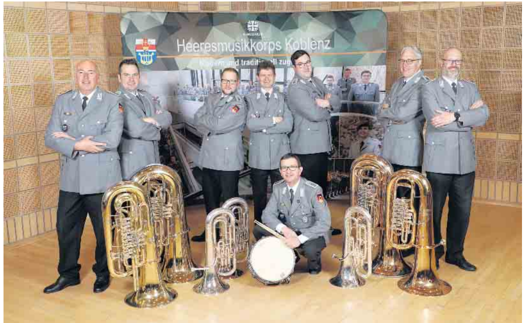
Bläser-Ensemble Bas(s)tion des Heeresmusikkorps Koblenz, aus dessen Reihen die Dozenten für den Workshop kommen.

Der stellv. Vorsitzende und passionierte Tenorhornspieler Dirk