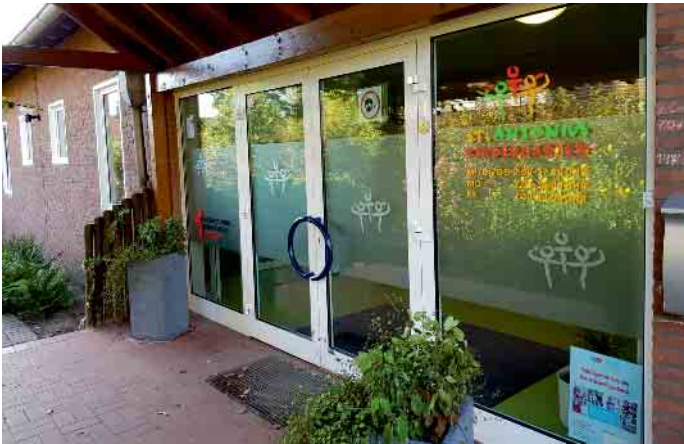
St. Antonius Kindergarten Issum-Sevelen, Im Huck 6

anstrengende Phase bewältigen kann. Termin: Dienstag, 5. März, 19.30 bis 21.45 Uhr Ort: St. Antonius Kindergarten, Im Huck 6, Issum-Sevelen Gebühr: 3 Euro Dozentin: Anne-Katrin Legeit-Fidomski, Erzieherin Anmeldungen bitte beim Ki-IsS Familienzentrum mit Kurs-Nr. 24: per E-Mail unter: fz.ki-issum@bistum-muenster.de oder telefonisch unter: 0 28 35 / 33 74 oder online unter www.ki-iss.de/familienzentrum