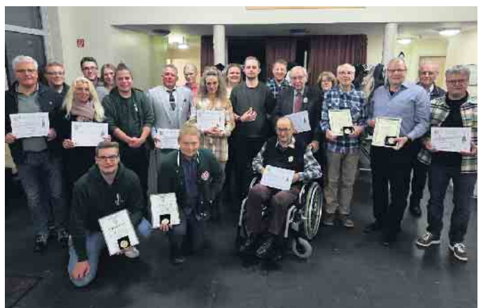
Gesamtbild der geehrten Mitglieder