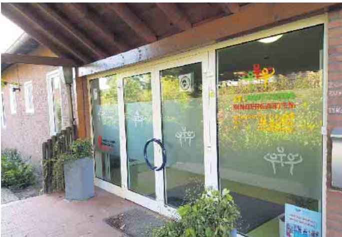
St. Antonius Kindergarten Issum-Sevelen, Im Huck 6

Termin: Dienstag, 5. März, 19.30 bis 21.45 Uhr Ort: St. Antonius Kindergarten, Im Huck 6, Issum-Sevelen Gebühr: 3 Euro Dozentin: Anne-Katrin Legeit-Fidomski, Erzieherin Anmeldungen bitte beim Ki-IsS Familienzentrum mit Kurs-Nr. 24: per E-Mail unter: fz.ki-issum@bistum-muenster.de oder telefonisch unter: 0 28 35 / 33 74 oder online unter www.ki-iss.de/familienzentrum