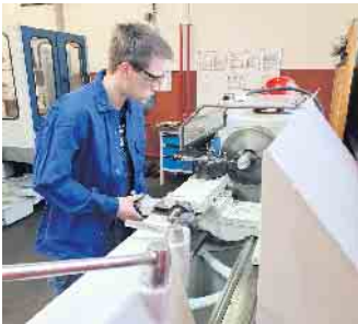
Kupfer spielt in vielen metallverarbeitenden Berufen eine Rolle.

trieb und der Kundenberatung. Einige Studiengänge wie die Angewandten Materialwissenschaften können als dualer Bildungsweg mit der Kombination aus Berufsausbildung im Unternehmen und Studium an einer Uni oder FH absolviert werden. (DJD)