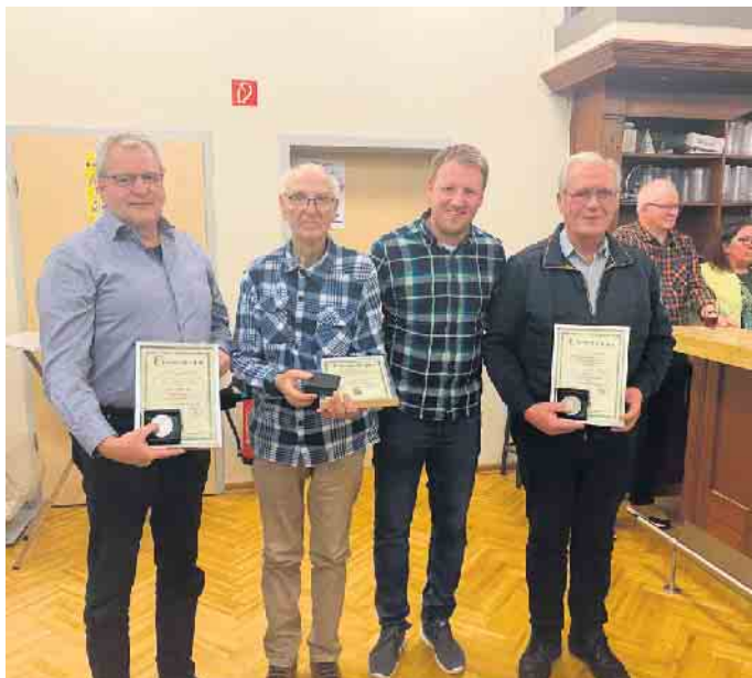
Sonderehrung Ehrenmitglieder St. Nicolai

an alle geehrten Schützenbrüder und Schützenschwestern. Im Anschluss an die Ehrungen wurde die Tombola gestartet. Viele große und kleine Preise wurden verlost. Ein Highlight der diesjährigen Tombola war sicherlich der Hauptpreis. Ein Balkonkraftwerk, das von der Firma Frosch Elektrotechnik gesponsert wurde. Einen herzlichen Dank hierfür! Nach einer letzten Stärkung am Käsebuffet wurde dann bis in den frühen Morgen hinein gefeiert und der Abend nahm einen gemütlichen Ausklang.