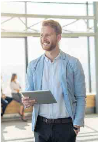
Wer eine fundierte kaufmännische Ausbildung mit Anspruch sucht und gerne mit Menschen umgeht, für den ist der Beruf der Bankkauffrau oder des Bankkaufmanns bestens geeignet.

Für Abiturienten, die sowohl ein Studium als auch eine praxisbezogene Ausbildung absolvieren wollen, ist das duale Studium mit seinen Varianten und Fachrichtungen eine interessante Alternative. Dual Studierende lernen wie bei einer Ausbildung die Kundenberatung in der Filiale kennen. Sie arbeiten in verschiedenen zentralen Abteilungen wie der Kreditabteilung, dem Marketing