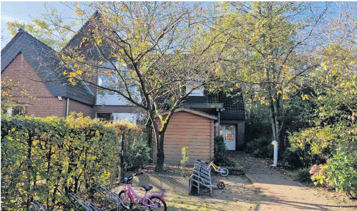
Ki-IsS Familienzentrum-St. Nikolaus Kindergarten