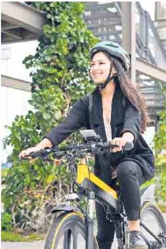
Mit Schwung in einen neuen Lebensabschnitt: Für junge Leute ergeben sich im Bankwesen interessante berufliche Perspektiven.

Genossenschaftsbanken bieten auch Ausbildungen in anderen Bereichen an - etwa in IT-Berufen, im Dialogmarketing, zu Kaufleuten für Bürokommunikation oder im E-Commerce. Auch wer sich als Quereinsteiger neu orientieren will, findet zahlreiche Chancen. Gefragt sind etwa Berufstätige aus anderen Wirtschaftsbereichen, die über keine Bankausbildung verfügen, aber im Service- und Beratungsbereich der Bank arbeiten möchten. „Durch intensive Trainings werden sie für die neue Tätigkeit fit ge-