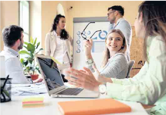
Angehende Bankazubis sollten Kontaktfreude und Kommunikationsstärke mitbringen.

Job und Karriere: Die drei wichtigsten Optionen für einen Einstieg ins Bankwesen