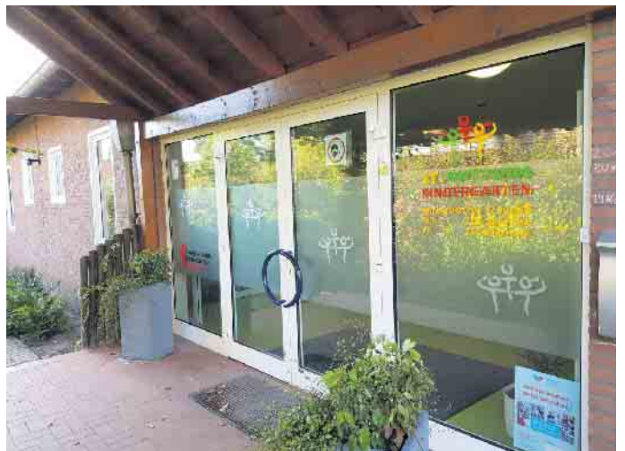
St. Antonius Kindergarten Sevelen