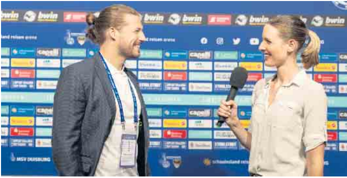
Reporter und Journalisten sind ganz nah dran an den wichtigen Leuten des Sportbusiness. Hier ist die richtige Kommunikation ausschlaggebend.