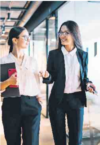
Am Arbeitsplatz durchstarten, einen Job im Ausland annehmen oder eine Fortbildung draufsatteln: Dual ausgebildete Fachkräfte haben im Berufsleben zahlreiche Optionen.

Langfristige Perspektiven für den erfolgreichen Aufstieg im Beruf