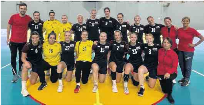
Das US-Damen-Team hat sich große Ziele gesetzt

pularität wie in Deutschland oder Österreich. In der Breite interessieren sich die Amerikanerinnen und Amerikaner für die traditionellen Top 3 ihrer Ballsportarten: American Football, Baseball und Basketball. Um den Handball, näher gefasst, den Damenhandball im „Land der unbegrenzten Möglichkeiten“ voranzubringen, arbeitet der Verband USA Team Handball viel auf internationaler Ebene mit Verbänden großer Handballnationen zusammen. Denn die Amerikanerinnen stehen auf dem Weg zu ihrem erklärten Ziel, die Olympischen Spiele 2024 und 2028, vor großen Herausforderungen. Mit nur wenigen Sponsoren und einem relativ kleinen Budget kann der US-Verband nicht optimal arbeiten: die Nationalspielerinnen müssen