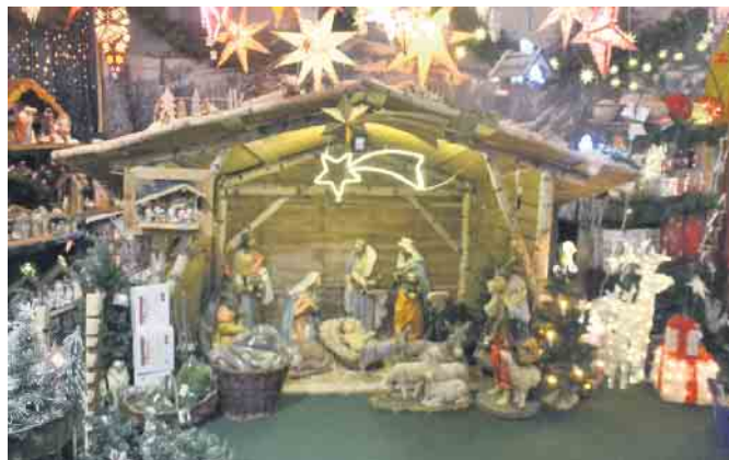
Verschiedene Krippen sind liebevoll zusammengestellt

Die Reitsportabteilung lässt das Herz jeder Reiterin oder jedes Reiters höher schlagen. Auch der Angler ist im Baumarkt herzlich willkommen. Auch hier erwartet ihn ein umfassendes Sortiment. Dies noch nicht alles, denn auch das Angebot an Fahrradzubehör lässt jede Reparatur schnell vergessen. Letzten Endes ist es auch noch der Futtermarkt, in dem jegliches Futter für Heim- und Wildtiere angeboten wird.