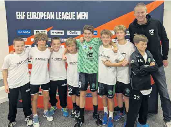
Auch Handball-Riese Volker Zerbe konnten den HSG-Kids nicht entkommen und posierte gern für ein Gruppenbild

für ein Gruppenfoto und einige Autogramme für die HSG-Kids. Am Ende eines tollen Abends gab es neben einer weiteren, fast exklusiven Autogrammstunde mit allen Spielern beider Teams in der Mixed Zone, einfach nur viele, viele glückliche Kindergesichter.