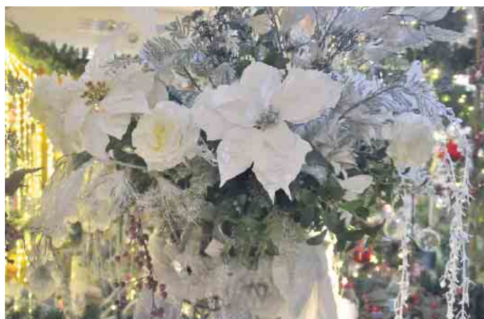
Die Auswahl an Deko-Möglichkeiten zur Weihnachtszeit lässt das Herz höher schlagen