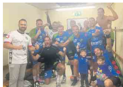
Mit voller Punktzahl kehrten die Handballer aus Rheinbach zurück.