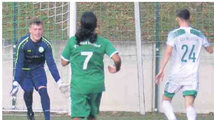
Vollkommen frei vor dem HFV-Keeper kamen die Mertener zu Torerfolgen