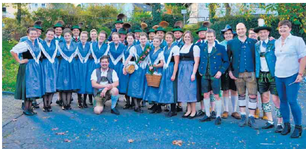
Trachtengruppe „D'Schellenberger“ mit Vorstand des Tambourcorps