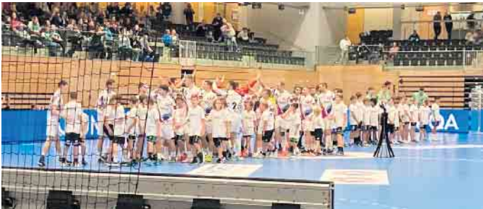
Die HSG-Kids waren ganz nah dabei, bevor das European League Spiel in Düsseldorf losging.