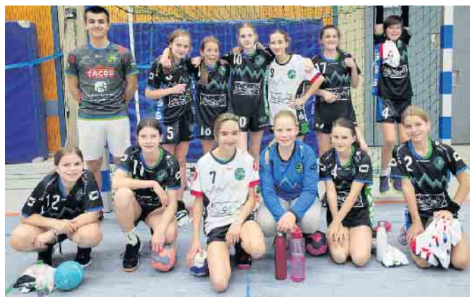
Die erste weibliche D-Jugendmannschaft der HSG siegte im Vereins-eigenen Duell.

An diesem Wochenende sind die HSG-Mädchen-Mannschaften wieder in der Kreisliga im Einsatz und freuen sich über Unterstützung von den Zuschauerinnen und Zuschauern.