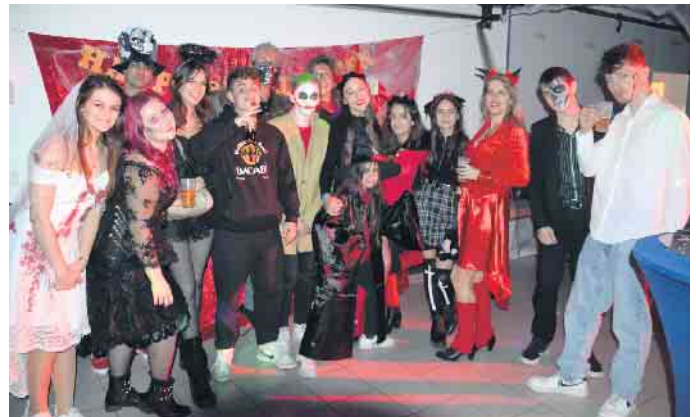
Gruselig ging es im Franz-Unterstell-Saal in Thomasberg zu

seit der Jahrtausendwende schwappt die Halloween-Welle nach Europa zurück - wo sie genau genommen ja auch ihren Ursprung hat. Bei uns ist Halloween in erster Linie als ein aus den USA importierter Grusel-Party-Spaß bekannt. Viele Kinder gehen durch die Straßen und klingeln an den Haustüren. „Süßes oder Saures“ - so wird um leckere Gaben gebeten. Man kleidet sich gruselig, schminkt das Gesicht und macht sich auf den Weg. Darüber hinaus wird so mancher Vorgarten umgestaltet und spiegelt einen gruseligen Charakter wieder. Vielerorts findet man sich zu Halloween-Partys zusammen, so auch im Franz-Unterstell-Saal in Thomasberg. Hier hatte der Kulturverein LebensArt Thomasberg e.V. erstmalig eingeladen. Nahezu 80 Jugendliche feierten und tanzten zur Musik des DJs durch die Nacht.