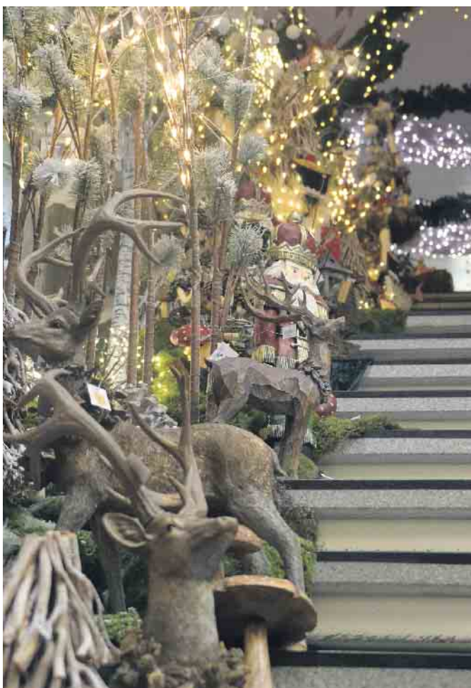
Wenn man die Treppenstufen hinauf die obere Etage des Baumarktes betritt wartet eine romantische Weihnachtswelt auf die Besucher

Baumarktes betritt, merkt man, dass man sich nicht mehr in einem normalen Ladenlokal befindet. Damit das Weihnachtsfest auch im richtigen Licht erstrahlen kann, verzaubert ein großes Sortiment, sowohl Innen- wie Außenbeleuchtung, diesen Markt, was die besondere Atmosphäre noch verstärkt. Von LED Beleuchtung bis hin zu traditionellen Wachs-Baumkerzen wird vieles angeboten. Tannenbäume, Kränze, Gestecke - überwiegend aus künstlichem Grün, jedoch täuschend echt aussehend - und Kerzen, nicht nur in roten Farbtönen, sondern in einer Vielzahl von Schattierungen und Größen. Schon lange gilt der mit viel Liebe zum Detail gestaltete große Ausstellungsraum als Geheimtipp für die ganze Familie. Es ist dem Team, das all dies geschaf-