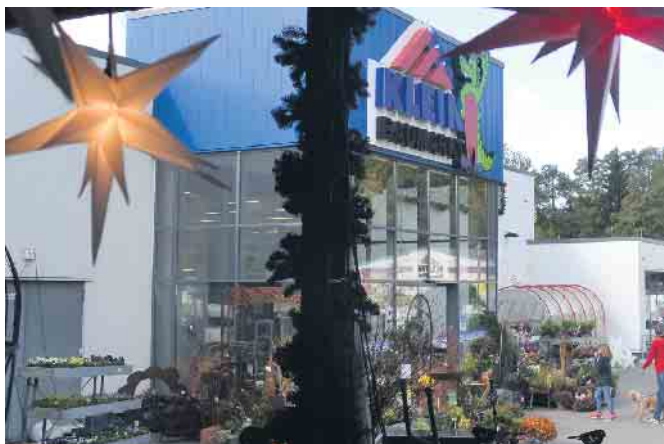
Bereits das Außengelände des Marktes weist auf das kommende Weihnachtsfest hin

die Kundschaft hier in der Vorweihnachtszeit stets etwas ganz Besonderes. In der ersten Etage der Firma „Baustoffe Klein“ befindet sich der wunderschöne