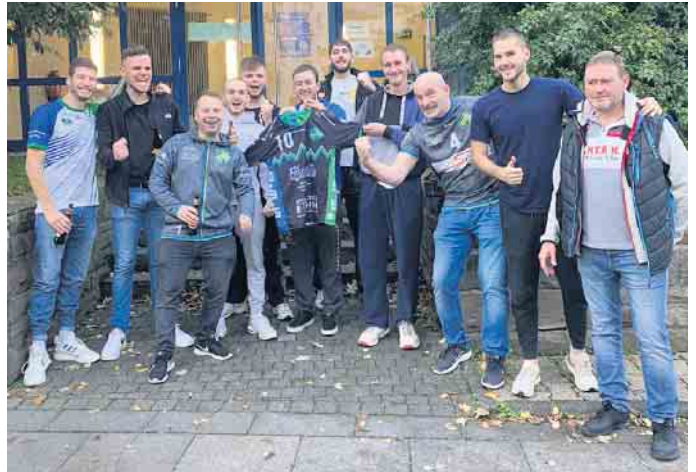
Die Herren feierten ihren ersten Auswärtssieg der laufenden Saison.