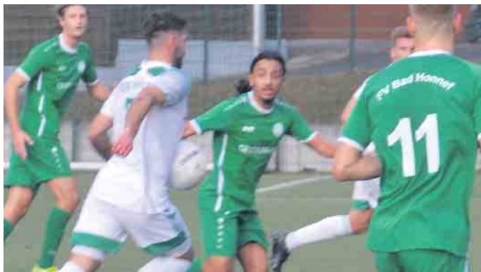
Der SSV Merten stürmte permanent in Richtung Honnerfer Tor