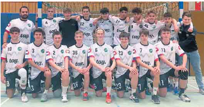
Mit zwei B-Jugendmannschaften tritt die HSG in der Meisterschaft an - die B1 belegt den 1. Platz in der Tabelle

belegt momentan den dritten Tabellenplatz. Anwurf ist um 14:15 Uhr.