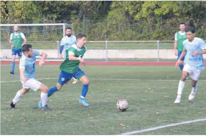
Die Sportfreunde kannten nur eine Richtung - das Tor der Gäste stand unter Dauerbeschuss