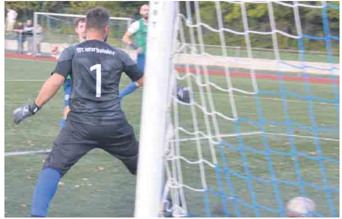
Und wieder schlug der Ball im gegnerischen Tor ein - Aegidienberg überzeugte mit einem 10:1