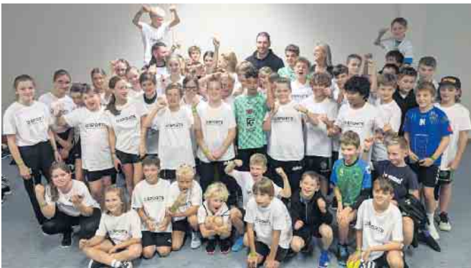
Kretzsche mit Kids: die Siebengebirgler freuten sich über das Treffen mit Handball-Legende Stefan Kretzschmar