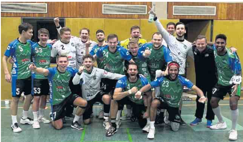
Der Sieg gegen Rheinbach sichert dem Oberliga-Team der HSG den 4. Tabellenplatz.

formation. Ein ums andere Mal konnten Ballgewinne in einfache Tore umgemünzt werden und den Rheinbachern in den Zweikämpfen der Schneid abgekauft werden. So setzten sich die Grün-Blauen bis zur Halbzeit auf 14:8 ab. In der zweiten Hälfte wollten sich die Rheinbacher noch einmal gegen die drohende Heimmiederlage wehren, doch die Siebengebirgler ließen an diesem Tage keine Zweifel an den nächsten zwei Auswärtspunkten aufkommen. Die Rheinbacher Mannschaft fand keine Mittel gegen die intensive, offensive Abwehr der HSGler und musste die Gäste aus dem Siebengebirge auf zehn Tore davon ziehen lassen. Am Ende entschied dann auch die „frische Bank“ mit mehr Wechseloptionen der HSGler, sodass es an diesem Abend nur einen Gewinner geben konnte. So konnten sich die HSGler über einen verdienten 28:18 Erfolg freuen. Für die HSG spielten und trafen: Fischer, Burgunder (beide Tor); Marcinkovic (5/4), Gebel, Runge, Sivanathan (je 4), Koch (3), Lopez, Ghussen, Krefting, Picard (je 2), Andrassy, Hayer und Al-Zaidi. Mit diesem Sieg belegt die HSG nun den 4. Tabellenplatz in der Oberliga-Tabelle. An diesem Samstag geht es um 18:30 in eigener Halle gegen den TV Jahn Köln-Wahn. Der Gegner der HSG belegt momentan den 9. Tabellenplatz.