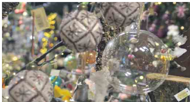
Christbaumkugeln in Hülle und Fülle, für jeden Geschmack ist etwas dabei