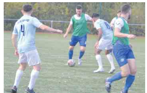
Über die Flügel oder durch die Mitte - die gegnerische Abwehr bot dem Gastgeber zahlreiche Lücken

hoven II. Birlinghoven konnte bislang erst einen Punkt in der Tabelle erringen. Somit ist, vor allem aufgrund des hochverdienten Sieges gegen Troisdorf, Aegidienberg der klare Favorit in diesem Spiel.