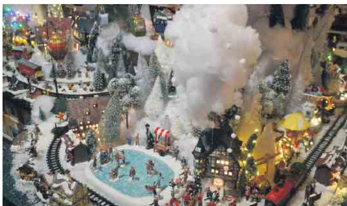
Auf die jüngeren Besucher wartet die Modelleisenbahn, die durch eine winterliche Landschaft führt