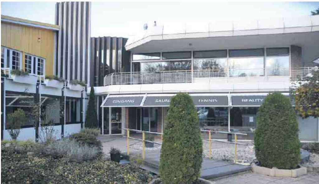
Der Saunapark Siebengebirge bietet viele Möglichkeiten, Ruhe und Entspannung zu genießen