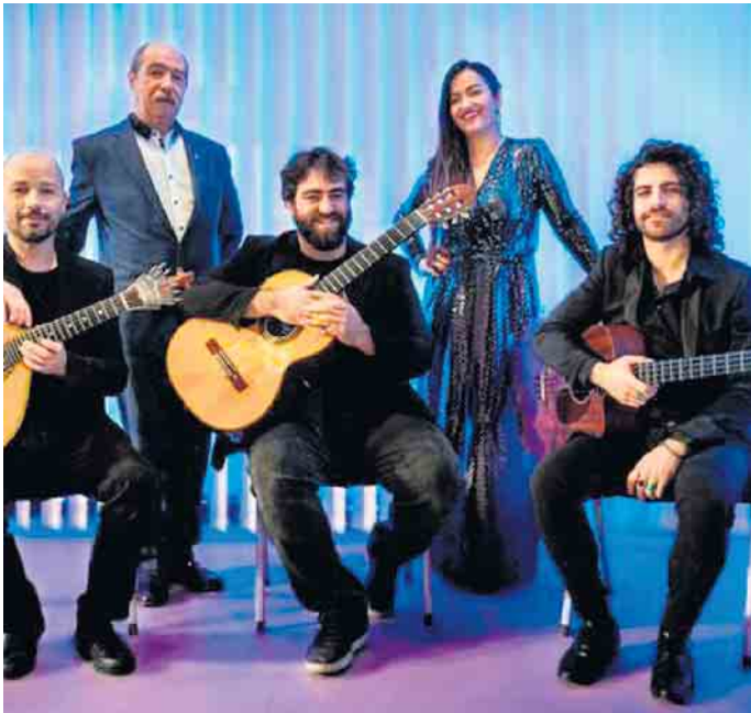
Die Band „Gerações“ hat sich mit voller Hingabe dem Fado verschrieben

Eine Veranstaltung des Kulturvereins Pro Klassik e.V. im Rahmen der Königswinter Akzente 2024 am 17. November von 18 bis 20 Uhr in Haus Bachem