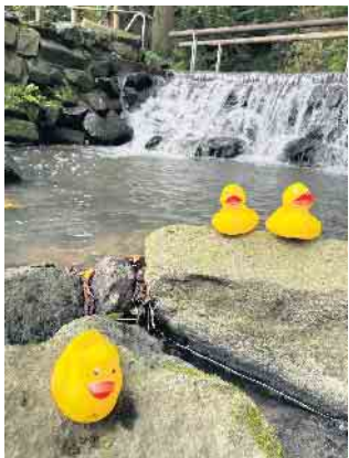
Zum Entenrennen auf dem Lützbach, der durch das Außengelände des Saunaparks fließt, lädt der Saunapark während der Festwochen ein