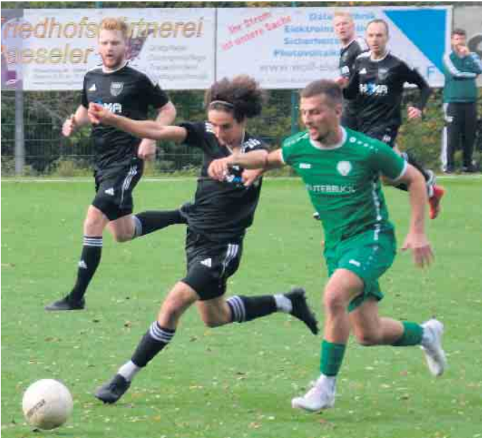
Der FV Bad Honnef und der FSV Neunkirchen-Seelscheid zeigten ein Spiel auf Augenhöhe

nen. Damit setzt sich Abwärtstrend für die Honnefer fort. Durch den 3:2-Sieg des bis dato Tabellenletzten, TuS Marialinden, gegen den TuS 05 Oberpleis, machte die Mannschaft drei Punkte gut und tauschte mit Bad Honnef die Plätze. Somit findet sich der HFV nun auf dem letzten Platz der Landesliga wieder. Zwei Siegen und einem Unentschieden stehen nun bereits sechs Niederlagen gegen