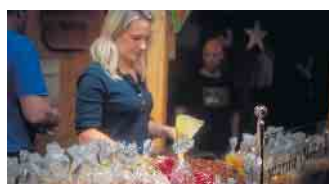
Alles was das Herz begehrt wird von den Ausstellenden angeboten

fentlichen Verkehrsmittel. Die Anreise mit der Bahn bis zu Endhaltestelle Bad Honnef ist ein guter Startpunkt. Von dort ist der Weg in die Innenstadt mit drei Minuten leicht zu bewerkstelligen. In der Innenstadt gibt es nur ein begrenztes Angebot an Parkplätzen, daher ist der Weg zu Fuß die bessere Alternative. Vielen Dank.“ Der Martini Markt findet vom 25. bis 29. Oktober statt, die Marktzeiten sind jeweils von 12 bis 21 Uhr.