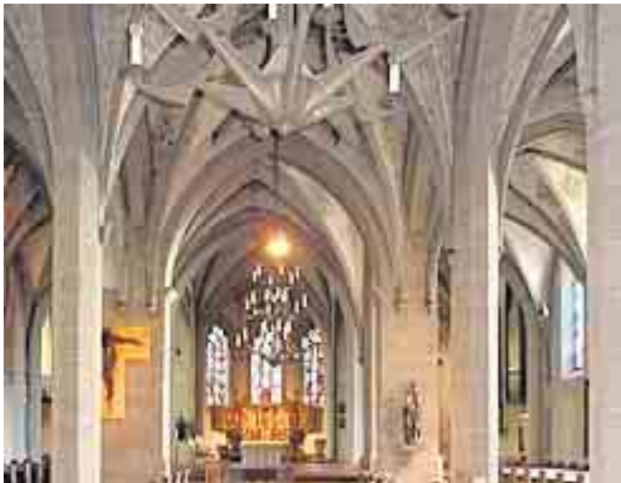
Das mittelalterliche Langhaus hütete zahlreiche Ereignisse, die über die Jahrhunderte hier abgespielt haben

che lassen sich Bücher schreiben. Eine Kurzfassung wird im Rahmen des Martini-Marktes präsentiert. Am Samstag, 28. Oktober, können die jungen Besucher im Rahmen einer Kinderführung um 16 Uhr auf Entdeckungsreise gehen. Um 18 Uhr wendet sich dieses Angebot an die Erwachsenen und es wird zu einem Rundgang durch 1800 Jahre angeboten. Treffpunkt ist der Innenbereich der Kirche. Die Teilnahme an diesem Martini-Markt-Angebot ist frei.