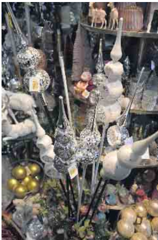
Eine riesige Auswahl an weihnachtlichen Dekorationen findet man bei Klein,s