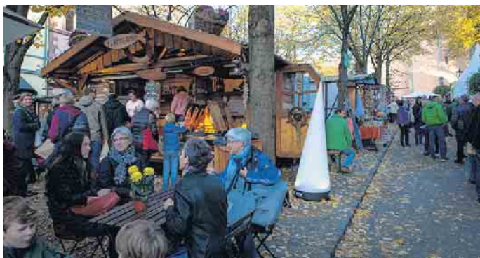
In zahlreichen Buden kann man sich auch kulinarisch verwöhnen lassen