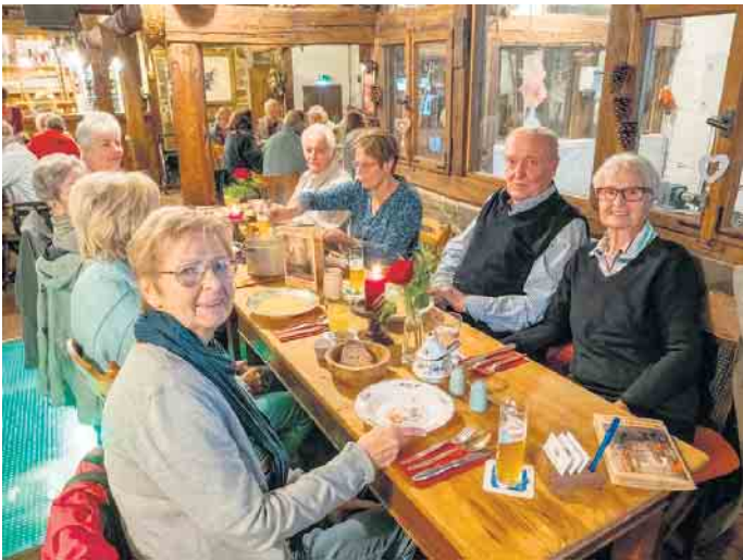
Guten Appetit