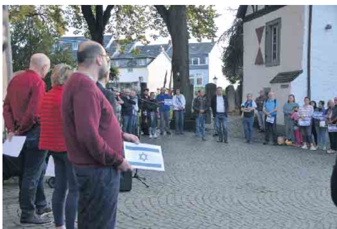
Es war Vielen ein dringendes Bedürfnis zumindest symbolisch ihre Solidarität mit dem Volk Israel zum Ausdruck zu bringen

mengekommen sind, auf diese grausame Art und Weise angegriffen, verschleppt und gar getötet werden. Wenn ein Vater um seine Töchter bangt, wie kann da die Menschlichkeit gewinnen und der Hass ausgegessen werden.“ In einer Schweigeminute gedachten die Bürgerinnen und Bürger dem Geschehen in Israel, durchaus in dem Bewusstsein, die Gräueltaten hautnah auf den Bildschirmen mitzerleben aber dem Geschehen vor Ort hilflos gegenüber zu stehen. So war es vielen das dringende Bedürfnis zumindest symbolisch ihre Solidarität mit dem Volk Israel zum Ausdruck zu bringen. Die Gedenkfeier endete mit den Tönen zu „Shalom aleichem“, der Begrüßung auf Hebräisch mit der Bedeutung „Friede sei mit dir“.