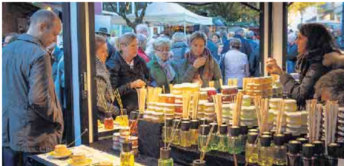
Der Marktplatz in der Innenstadt erstrahlt in einem vorweihnachtlichen Flair