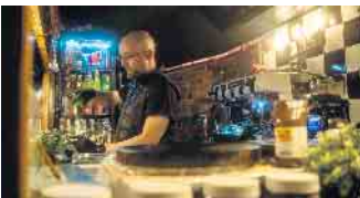
Die Marktbestücker freuen sich auf die Besucherinnen und Besucher

den Augen der Besucherinnen und Besucher präsentiert. „Zu erwähnen ist auch das denkmalgeschützte Riesenrad, das auch dieses Jahr wieder auf dem Kirchplatz seine Kreise ziehen wird“