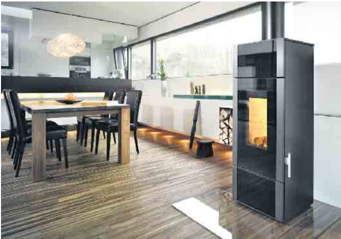
Kaminöfen mit moderner Technik sind eine Wertsteigerung für die Immobilie.

Die Zukunftsenergie Holz wertet Wohnungen und Häuser auf