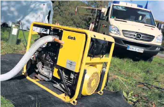
Vielfaches Gerät war bei der Übung im Einsatz