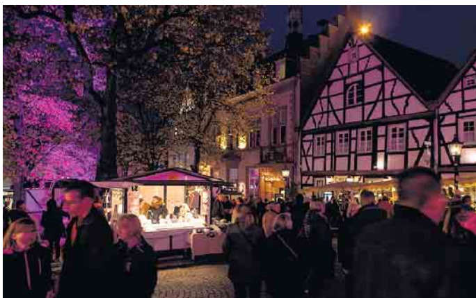
Wenn es dunkel wird strahlt der Herbstmarkt eine besondere Atmosphäre aus

Angebot an Waren auf die Besucher. Diese Stände verteilen sich auf Marktplatz, Kirchplatz, der Fußgängerzone bis in die Bahnhofstraße hinein. Eine Mischung aus Herbstromantik aus Stroh, Herbstblumen und Kürbissen und erstem vorweihnachtlichem Flair lädt zum Bummeln auf dem Mar-