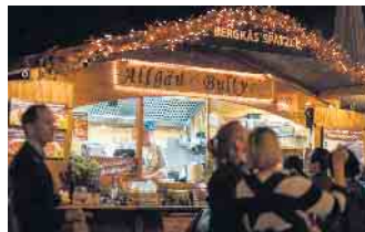
Gerade in den abendstunden strahlt der Markt eine ganz besondere Atmosphäre aus

ergänzt Enrico Menge, „Für die kleinen Gäste gibt es in diesem Jahr auch eine kleine Eisenbahn in Höhe der Volksbank.“ Noch ein Hinweis für alle Besucher: „Bitte nutzen Sie bei der Anreise die öf-