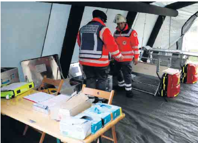
Die Kräfte des DRK Siebengebirge testeten in Zusammenarbeit mit dem DRK Sankt Augustin das Versorgungskonzept