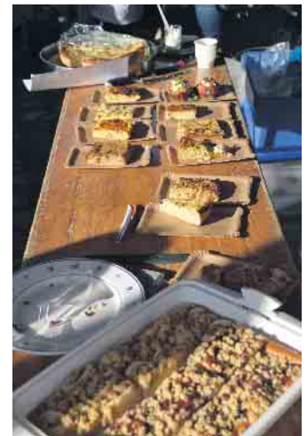
Das Buffet wurde geplündert - die schmackhaften Zwiebelkuchen wurden prämiert