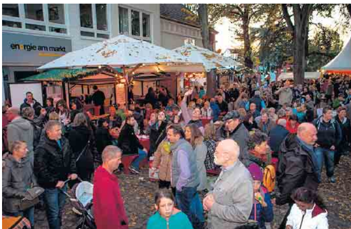
Stets lockt der Martini Markt in der Bad Honnefer Innenstadt zahlreiche Besucher an

tinimarkt in Bad Honnef ein. Für Unterhaltung sorgen Rahmenprogramm, Holzriesenrad und Mitmachaktionen. Für das leibliche Wohl der Besucher sorgen kulinarische Spezialitäten. Zusätzlich beteiligen sich die Einzelhändler mit einem verkaufsoffenen Sonntag in der In-