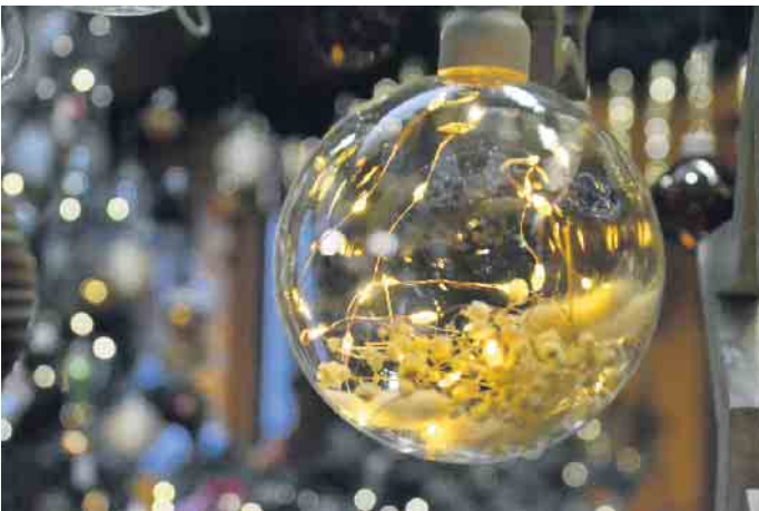
Mit dem Auge für das Detail präsentiert das Weihnachtsmarkt-Team die Vielzahl von Ausstellungsstücken