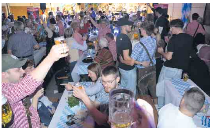
Ein Hoch auf das Oktoberfest - die Stimmung auf der Eudenbacher Gaudi hätte nicht besser sein können