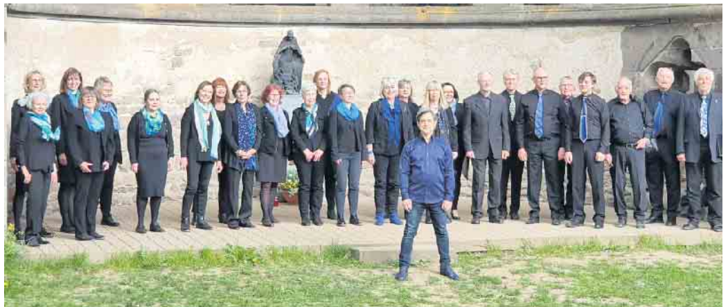
Der Kammerchor Oberpleis, hier vor der Klosterruine Heisterbach, lädt zu zwei Konzerten ein