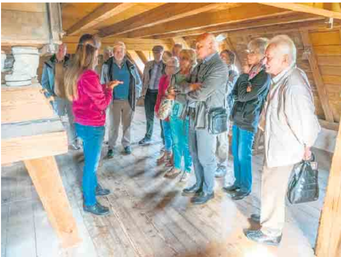
Weit oben in der Kornmühle