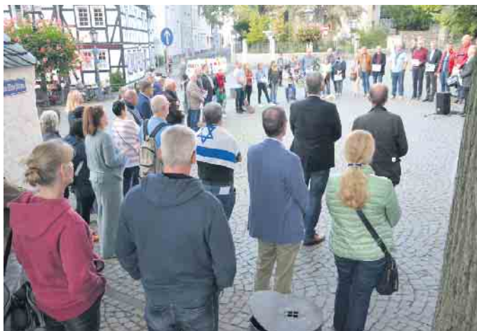
Bürgerinnen und Bürger kamen auf dem Kirchvorplatz zusammen