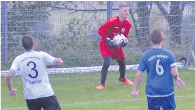
Der Gastgeber wehrte sich gegen die drohenden Niederlage, musste am Ende die Punkte jedoch abgeben