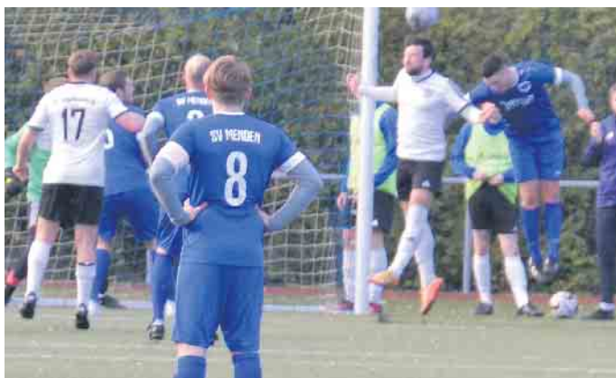
In der zweiten Halbzeit stand die Defensive der Aegidienberger vermehrt unter Druck

freunde in der 89. Minute auf nur noch neun Spieler dezimierte. In derartiger Unterzahl war ein weiterer Treffer für die Sportfreunde kaum mehr möglich. So blieb bei der 2:3-Niederlage und weiterhin dem letzten Tabellenplatz. Auch wenn die Abstiegszone noch verlassen werden konnte, jubelte der SV Menden über diese wichtigen drei Punkte. An diesem Sonntag sind die Sportfreunde auswärts gefordert. Sie treten bei Umutspor Troisdorf an, mit sieben Niederlagen eine Mannschaft, die über den bisherigen Saisonverlauf auch nicht glücklich sein kann. Bleibt zu hoffen, dass den Sportfreunden auf dem Sportplatz in Eschmar diesmal zumindest ein Punktgewinn gelingt.