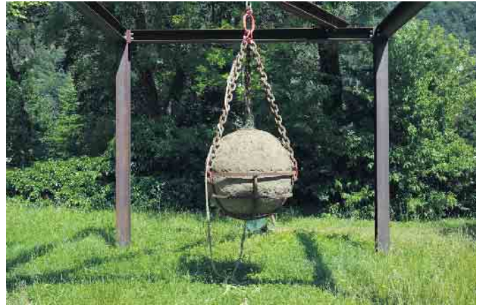
Das prämierte Kunstwerk „THEIA“