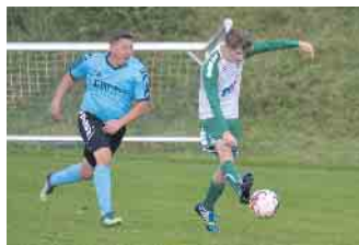
Das Eudenbacher Team verharrt auch nach dieser Niederlage auf dem 12. Tabellenplatz