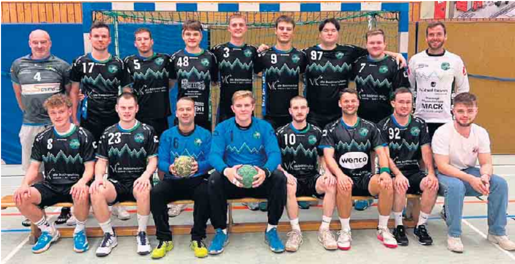
Die Herren III verlor das Spiel in der Schlussphase

(bk) Oberpleis. Am vergangenen Sonntag fand das Nachholspiel der Kreisliga-Herren gegen die Drittbeseztung des TSV Bonn rrh statt. In diesem „Derby der Dritten Mannschaften“ wollten die Grün-Blauen ihre Serie auf vier Partien in Folge ohne Niederlage ausbauen. Danach sah es auch eine Zeit lang sehr gut aus - ehe die Beueler das Derby noch drehen konnten. Das Spiel begann für die Grün-Blauen aussichtsreich, sodass man bis zur Halbzeit nicht eine einzige Bonner Führung zuließ. Bei einem Pausenstand von 11:11 konnte man sich auf Seiten der HSG noch einen positiven Ausgang und somit einen Sprung auf Platz 3 in der Kreisliga erhoffen. Die zweite Halbzeit begann ebenso ausgeglichen, wie die erste und das Spiel schien in eine spannende Schlussphase zu gehen, ehe die Bonner Heimmannschaft in der 43. Minute die erste Führung des Spiels erzielen konnte. Im Anschluss liefen sich die Siebengebirgler zu oft in der kompak-