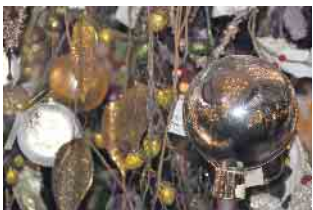
Eintauchen in eine Weihnachtswunderwelt

Eisenbahn, die durch eine zauberhaft aufgebaute Weihnachtslandschaft fährt, warten auf die interessierten Besucher. Eine große Krippenausstellung zum Staunen und das dazugehörige Krippenzubehör zeigen, mit welcher Liebe zum Detail die einzelnen Figuren ausgesucht und dargestellt werden. „Fühlen Sie sich in eine märchenhafte Winter- und Weihnachtswelt versetzt“, so das Weihnachtsmarkt-Team, „Jedes Jahr werden bei uns die neuesten Trends geschmackvoll mit Tradition vorgestellt. In einmaliger Atmosphäre kann man hier in Ruhe alles für sein eigenes weihnachtliches Zuhause finden.“ Wer den über die Grenzen des Ortes hinaus bekannten „Romantischen Weihnachtsmarkt“ noch nicht kennt, sollte sich die Gelegenheit auf keinen Fall entgehen lassen.