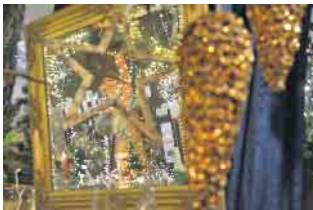
Liebevoll präsentiert sich der „Romantische Weihnachtsmarkt“ in Oberpleis