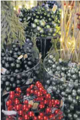
Ein farbenfrohes Bild spiegelt die Vielfalt des Sortiments wieder