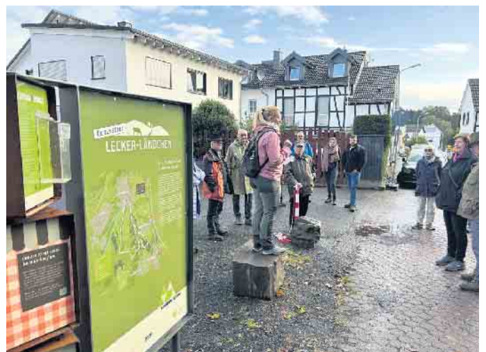
Startpunkt der Tour ist das Dorfgemeinschaftshaus Oelinghoven.