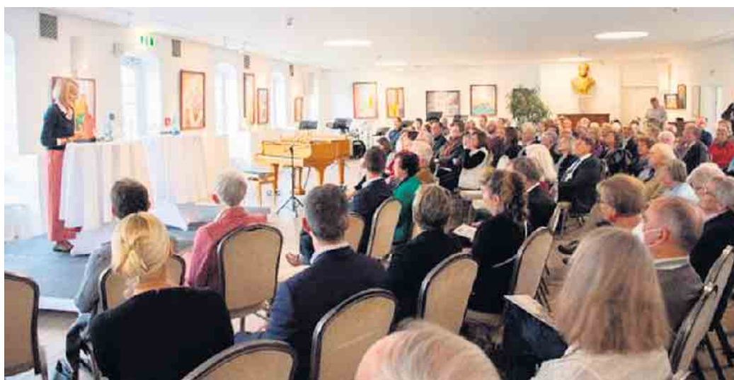
Rund 130 Personen nahmen am Festakt teil