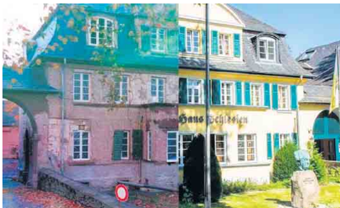
Das Haus vor der Renovierung (um 1978) und heute