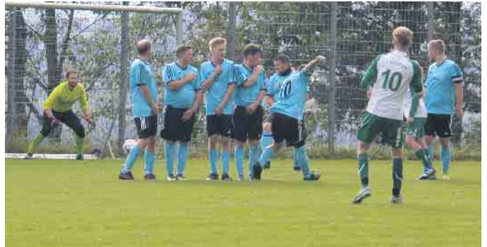
Dieser Freistoß sorgte für ein Tor der Reserve des TuS Eudenbach