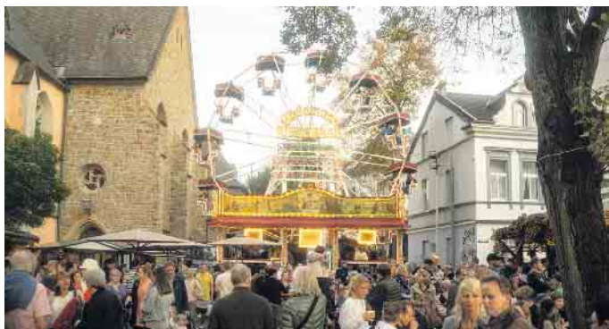
Jahr für Jahr erfreut sich der Martini Markt zahlreicher Besucher

ne Angebote. Die Präsentation und Verkauf der Waren wird in vielen Fällen auch von einem Einblick in die Herstellung ergänzt. So können die Besucher nicht nur das Ergebnis bewundern, sondern auch die Entwicklung beobachten. So werden Rattan-Möbel live auf dem Markt geflechtet, BonBon's selbst gemacht oder Holzschnitzerei und Malereien vor