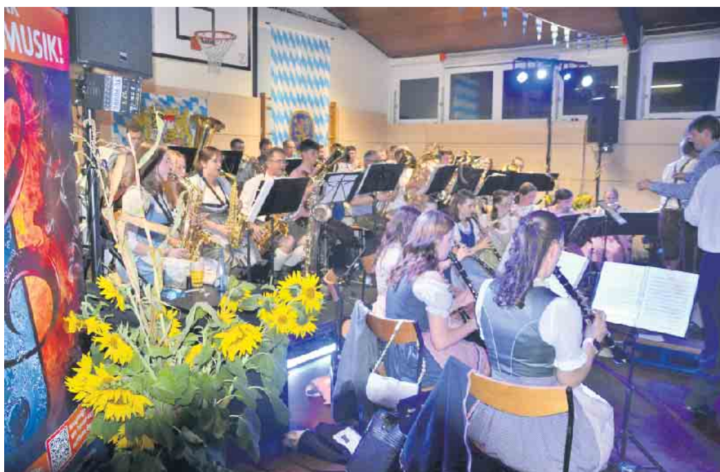
Der Musikzug der Freiwilligen Feuerwehr sorgte für den guten Ton