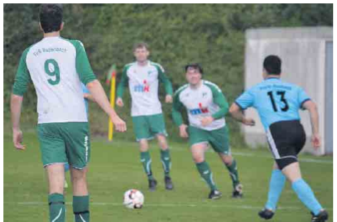
In der ersten Halbzeit boten beide Mannschaften ein Spiel auf Augenhöhe