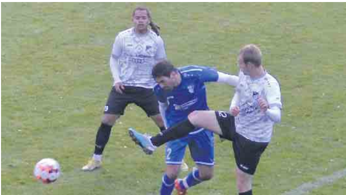
Auch wenn er hier den Ball sicher halten konnte, musste der TuS-Keeper viermal hinter sich greifen