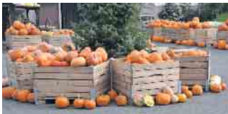
Die Kisten sind mit zahlreichen Kürbissen gefüllt