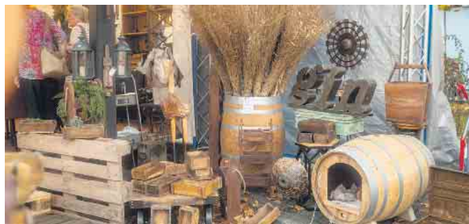
Liebevoll dekorierte Buden machen den besonderen Reiz dieses Herbstmarktes aus