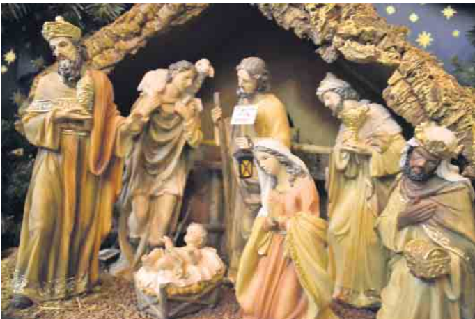
Auch die Krippenausstellung lässt keine Wünsche offen