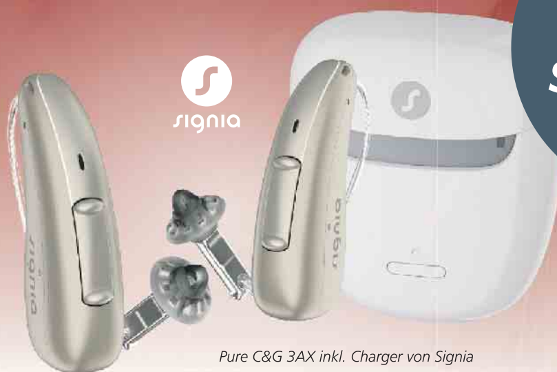
Pure C&G 3AX inkl. Charger von Signia

* Gültig bis zum 31.12.2023 beim Kauf von Signia Pure C&G 3AX Hörgeräten. Nur solange der Vorrat reicht. Sie erhalten 250 Euro Preisnachlass pro versorgtem Ohr auf den privaten Eigenanteil Ihrer Hörgeräteversorgung. Für Mitglieder gesetzlicher Krankenkassen mit Leistungsanspruch und ohrenärztlicher Verordnung. Zzgl. der gesetzlichen Zuzahlung in Höhe von 10 € pro Hörgerät. Keine Bar- und Restauszahlung möglich.