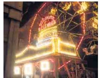
Gerade das denkmalgeschützte Riesenrad ist ein Anziehungspunkt für die jüngeren Besucher

fentlichen Verkehrsmittel. Die Anreise mit der Bahn bis zu Endhaltestelle Bad Honnef ist ein guter Startpunkt. Von dort ist der Weg in die Innenstadt mit drei Minuten leicht zu bewerkstelligen. In der Innenstadt gibt es nur ein begrenztes Angebot an Parkplätzen, daher ist der Weg zu Fuß die bessere Alternative. Vielen Dank.“ Der Martini Markt findet vom 25. bis 29. Oktober statt, die Marktzeiten sind jeweils von 12 bis 21 Uhr.