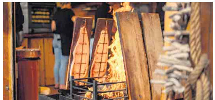
Das Spektrum der ausgestellten Produkte ist groß, es erstreckt sich über Holzarbeiten bis hin künstlerischen Objekten