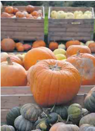
Kürbisse in allen Formen und Farben gibt auf dem Obst- und Kartoffelhof in Stieldorferhohn