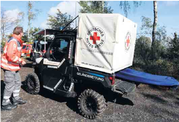
Auch der Polaris Ranger (ATV) als vollgeländefähige Erstversorgungsoption war im Einsatz

der ICE-Strecke in Siegburg oder in der Wahner Heide entwickelt haben funktioniert. Wir werden noch die ein oder andere Nachbesserung vornehmen müssen,