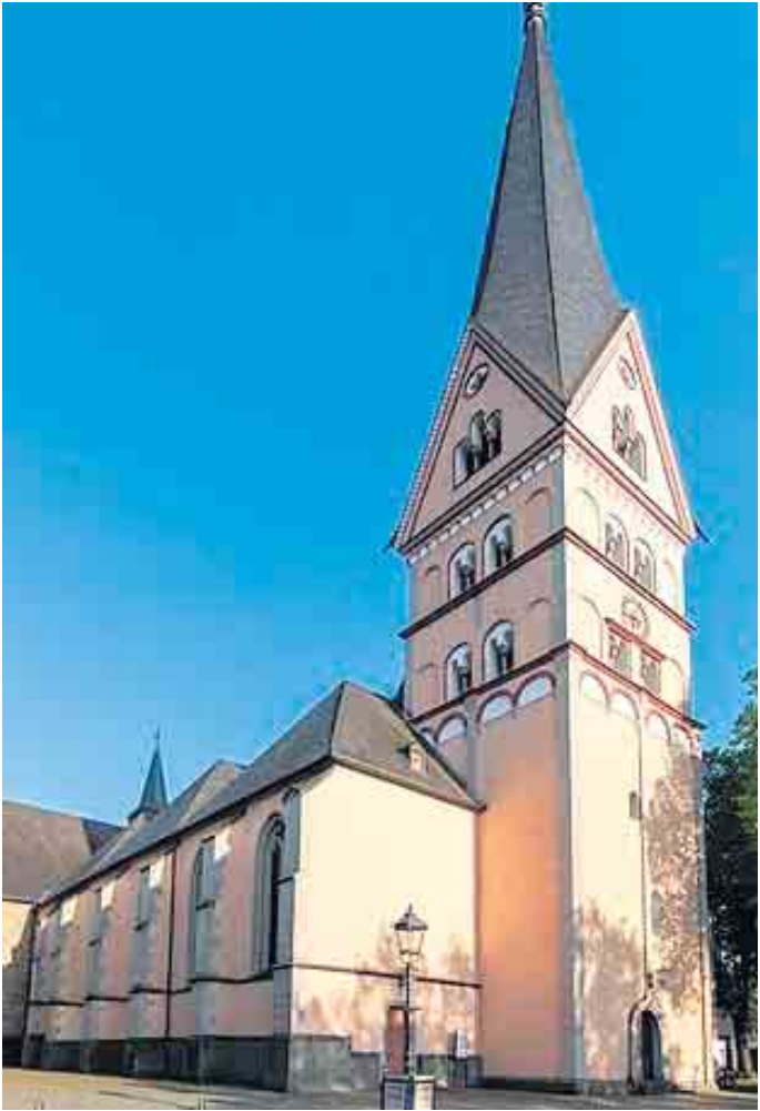
St. Johann Baptist ist ein Kirchenbau mit einer langen und interessanten Geschichte

Wir haben die passenden Tarife für Geschäftskunden!