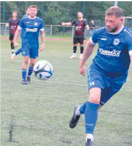
Einen weiteren Sieg fuhren die Sportfreunde gegen Lohmar ein