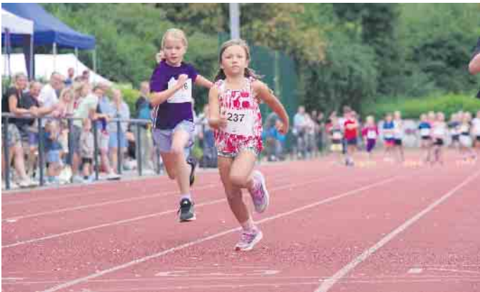
Cali Kennel von der LAZ Rhein-Sieg im 50-Meter-Sprint. Sie wurde Zweite im Dreikampf in der W7.