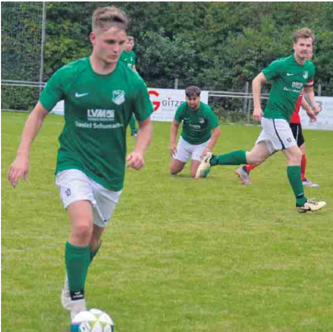
Trotz des Spiels in Unterzahl gewinnt die Reserve des TuS Eudenbach mit 5:2

Treffer zum 6:0 den Endstand her. Drei Spiel - drei Siege und damit der 2. Tabellenplatz. Mit ebenfalls neun Punkten liegt der Siegburger TV auf Platz 1, hat jedoch ein Spiel mehr absolviert. An diesem Sonntag geht es für die Herren I zum Wahlscheider SV III. Das Spiel beginnt bereits um 11 Uhr.