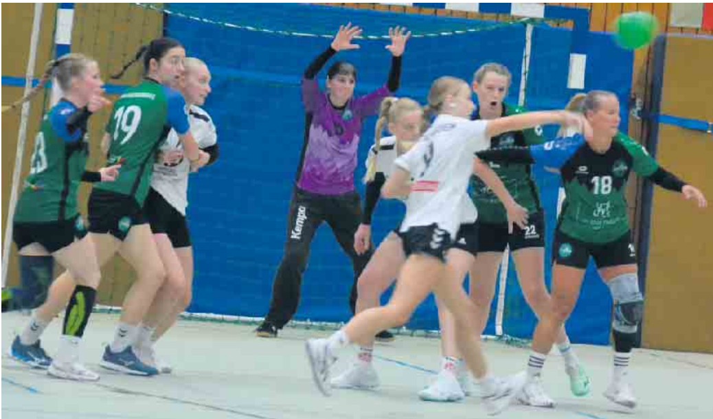
Die Gäste scheiterten oftmals an der Defensive der HSG Siebengebirge