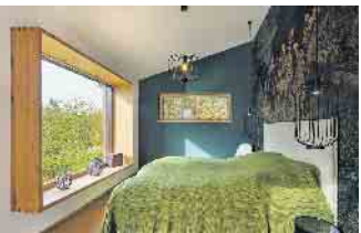
Holz im Innenraum reguliert den Feuchtehaushalt und sorgt für ein angenehmes Raumklima, dass das Wohlbefinden fördert.

Gesundes Raumklima auf natürliche Weise Holzfertighäuser schaffen ein angenehmes Raumklima. Holz reguliert Feuchtigkeit und sorgt für eine warme, gemütliche Atmosphäre. Die verwendeten Holzelemente kommen ohne chemische Zusatzstoffe aus und fördern saubere Raumlufte. „Die angenehme Wohnqualität in Holzfertighäusern erleben Baufamilien am besten in den Mus-