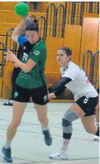
Mit einem deutlichen Sieg setzten sich das Damenteam gegen die Gäste aus Palmersheim durch

sechs im gegnerischen Netz. An diesem Sonntag geht es einem weiteren Heimspiel gegen den VfB Schleiden, ein Team, dass bislang in der jungen Saison einen Sieg und eine Niederlage verbuchen konnte. Anstoß ist in der Sporthalle am Sonnenhügel um 18 Uhr.