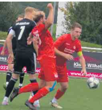
Ein spannendes Spiel konnte der TuS 05 am Ende knapp für sich entscheiden