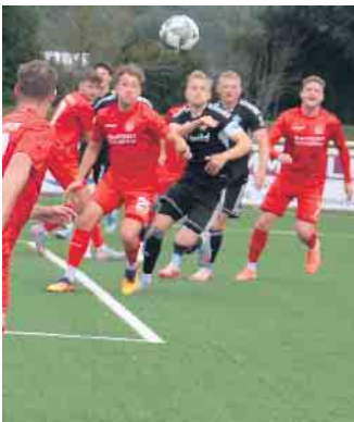
Lange Zeit konnte der Gastgeber seine Chancen nicht nutzen

Fans. Er durfte in der 94. Minute den Platz verlassen und wurde durch Jannik Goethe ersetzt. In der 8. Minute der Nachspielzeit sah ein gegnerischer Spieler die rote Karte, was jedoch keinen Einfluss mehr auf den Spielverlauf hatte. Während der Gegner aus Hangelar damit weiterhin ohne einen Sieg blieb und auf den 12. Tabellenplatz abrutscht, sonst sich der TuS 05 auf Platz 1. Während unter der Woche ein