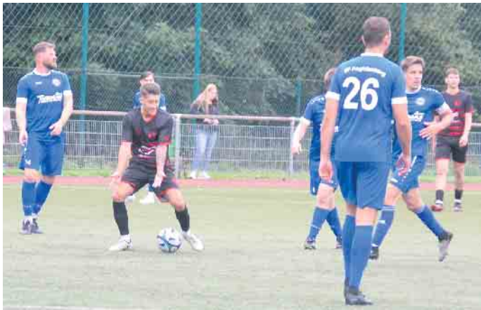
Mit den Entscheidungen des Schiedsrichters waren die Gäste nicht immer einverstanden