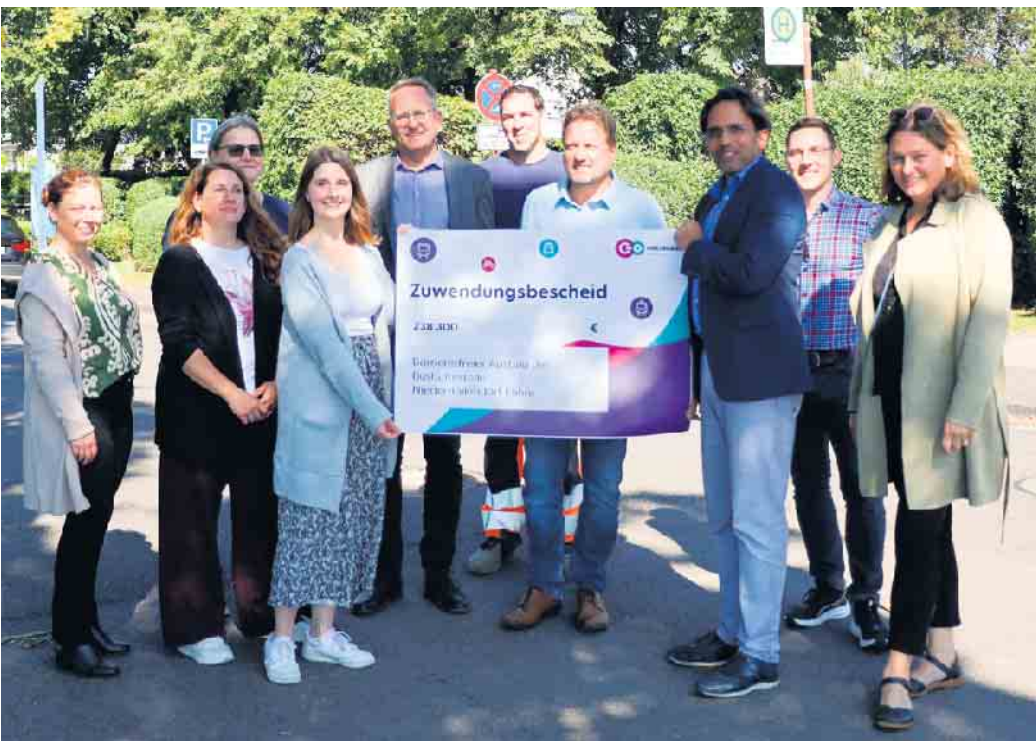
Die Stadt Königswinter freut sich zusammen mit Vertreterinnen und Vertretern von go.Rheinland, der Bezirksregierung Köln und der Baufirma Wurzel über die Förderungen und den Start der Maßnahmen an der Rheinuferstraße

(bk) Königswinter. Im Herbst beginnt der weitere Ausbau des Rheinradwegs zwischen der Fährstraße und dem Weidenweg in Königswinter-Niederdollendorf. Ein weiterer Meilenstein im „Aktionsprogramm Fahrradmobilität“ der Stadt Königswinter entsteht. Die Bauarbeiten starten Ende September und sollen planmäßig bis Ende März 2026 abgeschlossen werden. Die Maßnahme umfasst die umfassende Sanierung und Umgestaltung der bestehenden Rheinuferstraße zur Fahrradstraße sowie die barrierefreie Modernisierung der vorhandenen Bushaltestellen „Niederdollendorf Fähre“. Zudem wird die Straßenbeleuchtung erneuert und erweitert. Die vorhandene Infrastruktur, wie der Parkplatz, die E-Ladestationen für E-Fahrzeuge und E-Bikes, sowie die Anlegestelle für die elektrische Fähre, werden in Zukunft ergänzt durch eine neue Fahrradleihstation, eine Fahrradreparaturstation, einen neuen geschützten Radabstellbereich sowie ein neues Beschilderungskonzept. Diese Bausteine befinden sich derzeit in der Planung. Mit dem Ausbau und der Modernisierung der Infrastruktur wird der Umweltverbund gestärkt. Für Königswinter ist das gesamte Maßnahmenpaket ein wichtiger Schritt zu mehr nachhaltiger, barrierefreier und zukunftsorientierter Mobilität. „Der dritte Bauab-