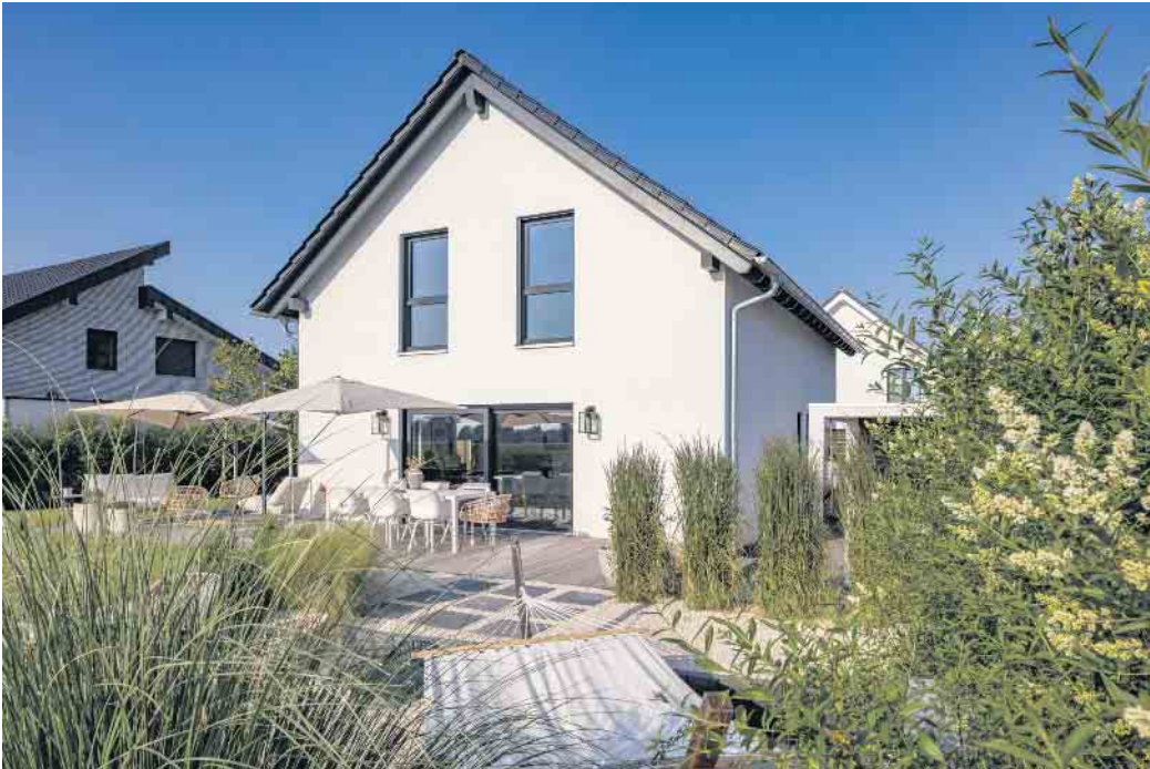
Mit dem nachwachsenden Rohstoff Holz aus nachhaltiger Forstwirtschaft und energieeffizienter Bauweise stehen Fertighäuser für zukunftsfähiges Wohnen.

terhausparks vor Ort,“ erklärt Hannott. „Beim Betreten eines Musterhauses spürt jeder sofort die Wirkung des natürlichen Baustoffs.“