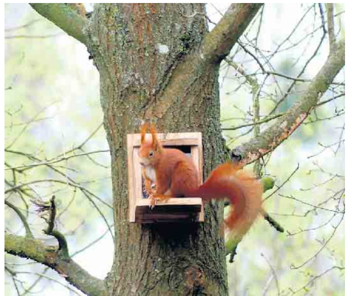
Eichhörnchen sammeln im Herbst Futter, um über den Winter zu kommen

Gerade im September und Oktober sind die kleinen Igelkinder, die im Frühjahr geboren wurden, unterwegs und auf der Suche nach Futter und einem Überwinterungsquartier und Eichhörnchen sam-