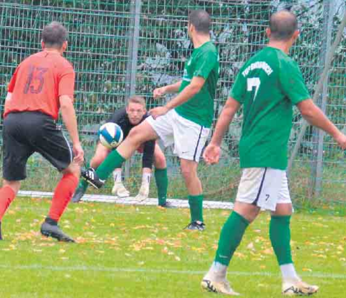
In der 2. Halbzeit drehte die Herren II des TuS Eudenbach nochmals so richtig auf

Das Auftaktspiel entscheidet die Herren II mit 5:2 für sich, die Herren I siegt im Anschluss mit 6:0