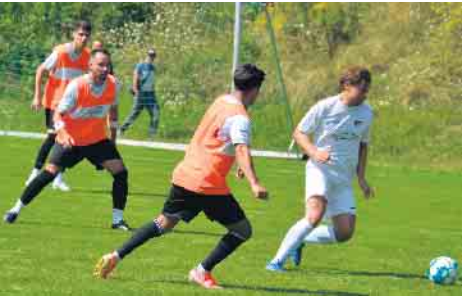
Mit zunehmender Spieldauer übernahm der SV Beuel 06 die Initiative

bereitungsphase empfing Eudenbach am vergangenen Sonntag den SV Beuel 06 II, ein Team aus der Kreisliga B, aus der Eudenbach in der letzten Saison absteigen musste. Die erste Halbzeit lief noch nach Maß. Eudenbach konnte dem Gegner durchaus Paroli bieten und führte zum Pausenpfiff mit 3:2. Die Zweiten 45 Minuten konnte man dann vergessen. Beuel konnte gleich viermal erfolgreich abschließen und führte am Ende deutlich mit 6:3. An diesem Sonntag kann sich der TuS Eudenbach in einem weiteren Freundschaftsspiel nochmals beweisen. Zu Gast ist der Oberkasseler FV II.