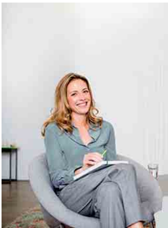
Persönliches Wachstum fördern mit einer Coaching-Ausbildung

ness-coach-ausbildung) ist genau auf diese Anforderungen zugeschnitten. Weiterbildungsinhalte wie Motivation und Selbstmotivation, Kommunikationstechniken, Stress- und Konfliktmanagement sowie Selbstfindung behandeln wichtige Themen, die für die persönliche Weiterentwicklung und die Fähigkeit, andere zu un-