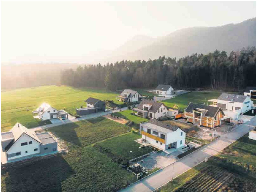
Wie kann man die Kosten für ein eigenes Haus senken? Zum Beispiel, indem man größere Entfernungen zur Stadt in Kauf nimmt.

Ein erster Schritt ist die ehrliche Bestandsaufnahme der finanziellen Situation. Dazu gehört, Einnahmen und Ausgaben gegenüberzustellen, vorhandenes Eigenkapital realistisch zu bewerten und Sparpotenziale zu identifizieren. Je flexibler man bei der Lage und der Größe von Haus oder Wohnung ist, desto besser lassen sich Kosten einsparen. Gerade bei begrenztem Budget lohnt es sich, umfassende Infos über Fördermöglichkeiten einzuholen. Staatliche Förderprogramme wie KfW-Kredite oder regio-