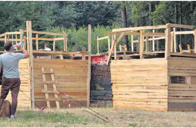
Der Bauspielplatz „BAEGI“ wurde von den Kids in Beschlag genommen

Stadtjugendring sorgt für abwechslungsreiche Sommerferien in Bad Honnef