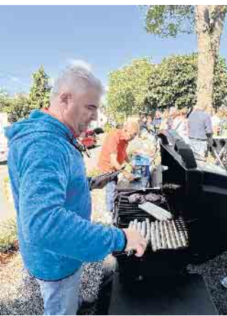
Auch an die Verpflegung wurde gedacht - das gleichzeitige Kapellenfest in Quirrenbach machte es möglich

gement bewirtschaften, pflegen und erhalten - um nur einige Beweggründe zu nennen. „Die Kapellen haben eine Bedeutung nicht nur für Menschen, die im Glauben beheimatet sind, sondern halten den Himmel offen, ohne dessen Leichtigkeit die Erdschwere überhand nehmen würde“, davon sind die Initiatoren dieser Kapellenwanderung überzeugt, „Sie sind anschauliche Zeichen dafür, dass ein Leben ohne eine Verortung, in dem, was Raum, Zeit und unsere sinnlicher Erfahrung übersteigt, nur schwer bewerkstelligt und durchgestanden werden kann.“ Auf einer Stempelkarte konnten all diejenigen, die sich auf den Weg gemacht hatten, an jeder besuchten Kapelle einen Stempel erhalten. An all den Kapellen, die je-