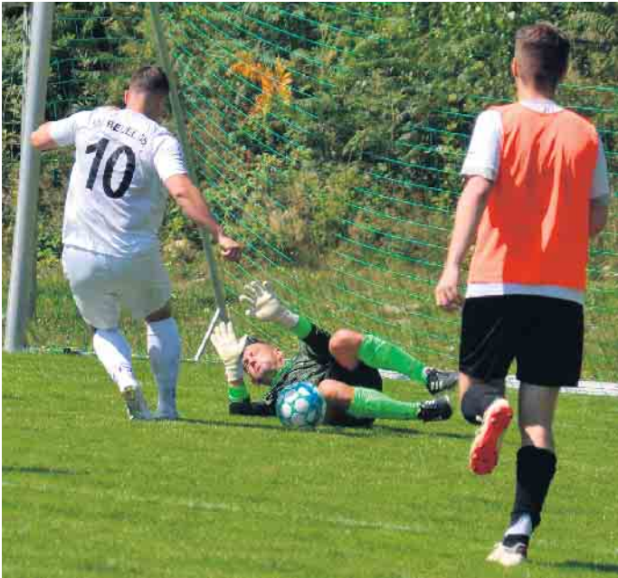
Die Halbzeitführung des TuS Eudenbach löste sich am Ende in Luft auf, der Gastgeber verlor deutlich mit 3:6