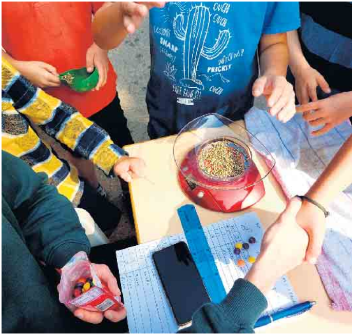
Kreativität war bei der Ferienmaßnahme stets gefordert