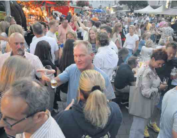
Zahlreiche Besucher fanden wieder den Weg in die Honnefer Innenstadt und genossen den Schlemmerabend

Honnef begrüßen können. Somit variiert unser Angebot von Abend zu Abend.“ Die JK-Agentur hat diese Schlemmer-Reihe zu einem echten Honnefer Magnet entwickelt.. Ob nach einem Einkaufsbummel oder einfach zum relaxen nach einer arbeitsreichen Woche, die angenehme Atmosphäre der Schlemmerabende bietet einem den passenden Einstieg in das Wochenende. Noch an zwei Terminen kann man diesen besonderen Abend besuchen. Am 29. August und am 26. September öffnen die Stände jeweils von 16 bis 22 Uhr.