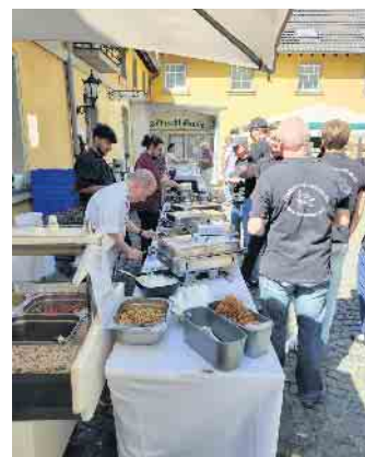
Für das kulinarische Angebot war auf dem Sommerfest bestens gesorgt

für eine besondere Gaumenfreude. Leckere Grillspezialitäten, Kaffee und Kuchen, mit schulischem Streusel und Mohnkuchen, und so manch kühnendes Getränk rundeten den Tag ab.