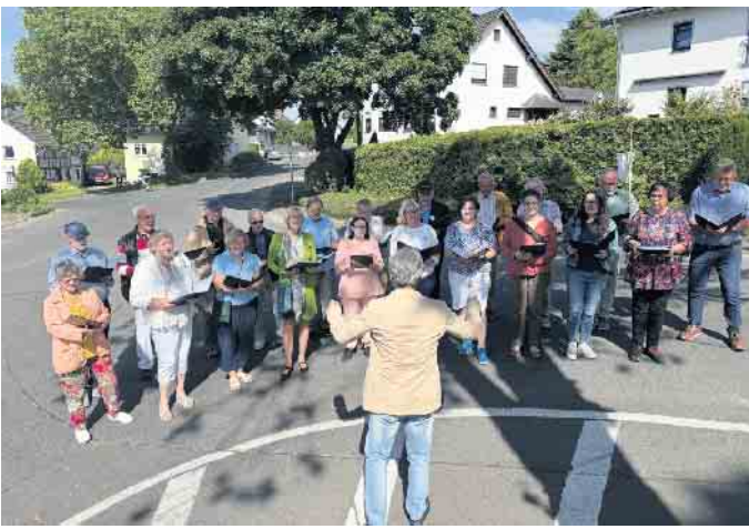
Die Wanderer wurden stets mit verschiedenen Einlagen begrüßt, wie hier mit einem Ständchen

gesetzt. Am Wegesrand lagen neben der Kapelle in Quirrenbach die Kapellen in Eisbach, Heisterbacherrott, Ittenbach, Pleiserhohn, Rauschendorf, Sandscheid, Thomasberg, Uthweiler, Vinxel und Wahlscheid, sowie das Heiligenhäuschen in Hartenberg. „Es gib viele Gründe, sich auf den Weg zu machen“, so die Pfarreiengemeinschaft Königswinter am Ölberg. Die herrliche Landschaft des Pleiser Hügellandes, die zu jeder Jahreszeit ihren besonderen Reiz hat, die Kapellenorte mit ihrer spürbaren Ausstrahlung, ein persönliches Anliegen, das mit auf den Weg genommen wird, die Solidarität mit den Kapellengemeinden, die ihre kleinen Gotteshäuser meist mit Hilfe von Ehrenamtlichen erbaut haben und gegenwärtig durch bürgerliches Enga-