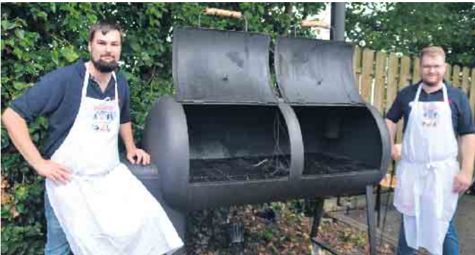
v.l. Chefkoch und Konstrukteur stellen mit Stolz ihren Smoker vor

Die Marke „Eigenbau“ lässt den Geschmackssinn jubeln