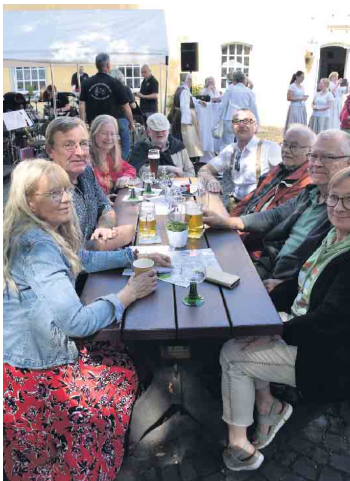
In geselliger Runde verbrachten die Gäste einige Stunden im Innenhof von Haus Schlesien

Einlagen und das Treffen mit alten bekannten von Nah und Fern im Vordergrund. Für die musikalische Unterhaltung sorgte zuerst der Musikzug Bergklänge aus dem Ort mit seinem beeindruckenden Repertoire, das von traditioneller Blasmusik bis zu modernem Bigbandsound reichte. Später servierte der Musikverein Rahms aus Neustadt (Wied) die Gäste mit unvergesslichen Klängen aus Filmen bis hin zu pulsierenden Rythmen moderner Pop-Hits und hielt mit einem Cocktail