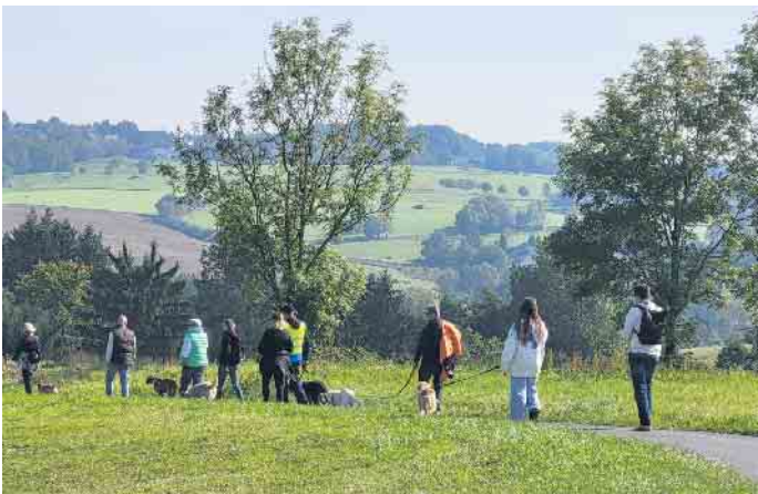
Himmliche Wanderung mit und ohne Hund

Zurück am Startpunkt erwarten die Gäste Kaffee, Kuchen, Waffeln und herzhafte Vesper am Tierfriedhof Bönnschenhof. https://www.tierbestattung-boennschenhof.de/willkommen/ Hier hat man dann Zeit für nette Gespräche mit anderen Tier- und Wanderfreunden. Wer möchte, lässt auch noch einen Pfotenabdruck von seinem Hund anfertigen oder stöbert am Handarbeitsstand. Wichtig: Die Teilnahme ist kostenlos und auf eigene Gefahr. Während der Wanderung gilt Leinenpflicht. Anmeldung unbedingt erforderlich bei: Hundewanderung@tierschutz-siebengebirge.de Die Veranstalter freuen sich auf ihre zwei- und vierbeinigen Gäste und auf einen wunderschönen Tag. Weitere Informationen zum Tier-