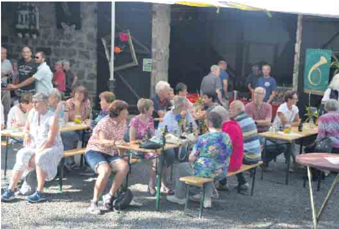
Zahlreiche Gäste waren der Einladung gefolgt und verbrachten einige gemütliche Stunden auf Hof Perlenhardt