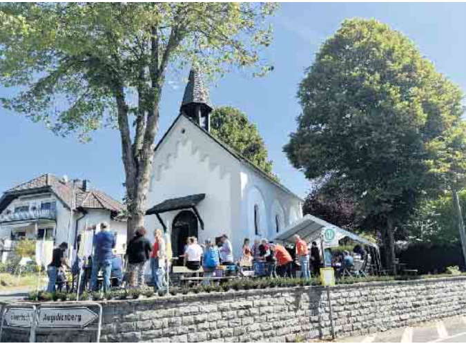
Zahlreiche Kapellen lagen auf dem Rundweg, wie hier in Quirrenbach

12 Kapellen konnten auf dem 42 km langen Rundweg durch das Pleiser Hügelland besucht werden