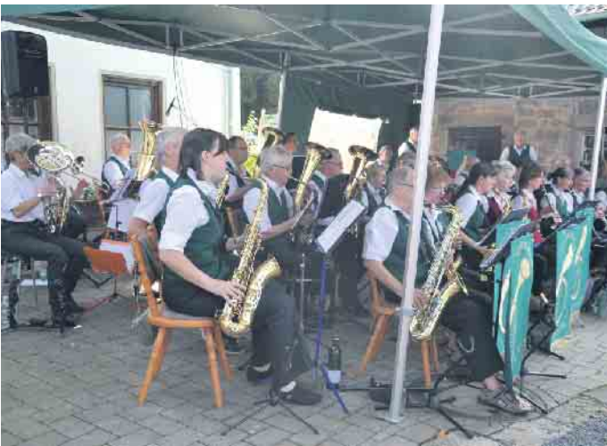
Das Ittenbacher Bläsercorps hatte zu diesem Hof-Konzert in einer besonderen Atmosphäre eingeladen

Auf dem Hof Perlenhardt erklangen die Töne und man verbrachte in gemütlicher Runde mehrere Stunden