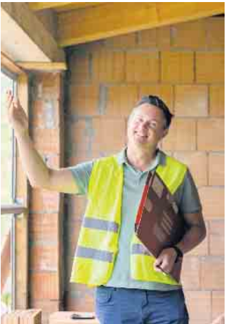
Unabhängige Informationen und Beratungen können dabei helfen, trotz hoher Baukosten einen gangbaren Weg in die eigenen vier Wände zu finden.

Unabhängige Beratung und Information durch Verbraucherschützer wie den BSB geben Orientierung und helfen dabei, die eigenen Möglichkeiten einzuschätzen. Unter www.bsb-ev.de - Menüpunkt Veranstaltungen finden Interessierte aktuelle Termine für Web-Seminare, Messen oder regionale Events. Überdies können Bauherrenberater die Verbraucher bei der Bewertung und dem Vergleich von Angeboten unterstützen und sie bei der Planung und Umsetzung von Haus- oder Wohnungsprojekten begleiten. (DJD)