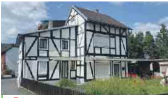
KÖNIGSWINTER-NIEDERDOLLENDORF Fachwerkhaus mit Anbau in gefragter und zentraler Wohnlage.

Bald in unserem Angebot. Jetzt vormerken lassen!