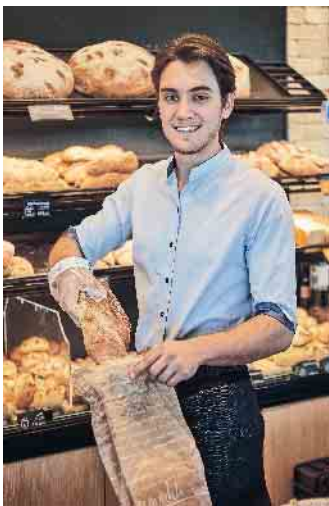
Ob Abitur oder Hauptschulabschluss, das Bäckerhandwerk steht jedem entsprechend seinen Qualifikationen offen.

jugend gewonnen. Sie brennt für das Handwerk und erfindet sich und ihren Beruf immer wieder neu: „In meinem Job kannst du kreativ sein und lernst immer wieder neue Dinge - ob im Ausland, bei Leistungswettbewerben oder in der Zusam-