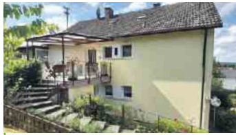
KÖNIGSWINTER-OBERDOLLENDORF 2-FH mit Anbau, insg. ca. 203 m² Wfl., ca. 96 m² Nfl., PKW-Doppelgarage + PKW-Stellplätze, 1.057 m² großes Gartengrst., Energieklasse: F, Endenergiebedarf: 191,9 kWh/(m²a), Gaszentralhgz. mit WW, Bj. Gebäude 1958, Bj. Hgz. 1997-2002, Kaufpreis: € 698.000,- + 2,00 % Käuferprovision.