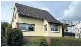
BAD HONNEF-AEGIDIENBERG EFH mit Anbau, große Dachterrasse mit Weitblick, ca. 129 m² Wfl., ca. 73 m² Nfl., 2 PKW-Garagen, ca. 800 m² angel. Grst., Energieklasse: H, Endenergiebedarf: 380,6 kWh/(m²a), Ölzentralhgz. mit WW, Bj. Gebäude 1958, Bj. Hgz. 1988, Kaufpreis: € 370.000,- + 3,57 % Käuferprovision.

Bald in unserem Angebot. Jetzt vormerken lassen!