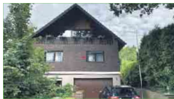
BAD HONNEF-AEGIDIENBERG Geräumige 4-Zimmer-Eigentumswohnung (Hochparterre) mit Terrasse und Gartenanteil, ca. 140 m² Wohnfläche, PKW-Stellplatz in der Doppelgarage. Energieausweis ist z.Zt. noch in Erstellung. Kaufpreis: € 295.000,- + 3,57 % Käuferprovision.