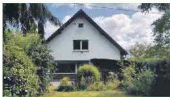
KÖNIGSWINTER-PLEISERHOHE EFH mit ca. 82 m² Wfl., ca. 120 m² Nfl., PKW-Garage, auf einem 915 m² großem Gartengrst., Energieklasse: G, Endenergiebedarf: 238,5 kWh/(m²a), Ölzentralhgz. mit WW, Bj. Gebäude 1960, Bj. Hgz. 2002 Kaufpreis: € 378.000,- + 2,85 % Käuferprovision.