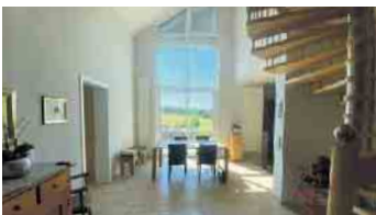
KASBACH-OHLENBERG Energetisch modernisiertes EFH, ca. 210 m² Wfl., PKW-Doppelgarage, 629 m² angel. Grundstück mit Teich, Energieklasse: D, Endenergieverbrauch 101 kWh/(m²a), Gaszentralhgz. mit WW, Bj. Gebäude 1999, Bj. Hgz. 2015, Kaufpreis: € 730.000,- + 3,57 % Käuferprovision.