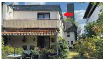
KÖNIGSWINTER-ITTENBACH Beidseitig angebautes EFH mit Ölbergblick, ca. 117 m² Wfl. + ca. 52 m² Nfl., auf einem 291 m² angel. Grst., Energieklasse: H, Endenergiebedarf: 347,9 kWh/(m²a), Gaszentralhgz. mit WW, Bj. Gebäude 1971, Bj. Hgz. 1998, Kaufpreis: € 288.500,- + 2,85 % Käuferprovision.