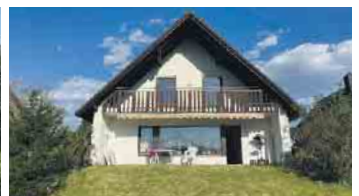
BAD HONNEF-TAL Freist. EFH in bevorzugter Wohnlage, ca. 138 m² Wohnfläche, ca. 70 m² Nutzfläche, PKW-Garage, 1.006 m² angel. Grst., Energieklasse: G, Endenergiebedarf: 238,2 kWh/(m²a), Gaszentralhgz. mit WW, Bj. Gebäude 1979, Bj. Hgz. 2006, Kaufpreis: € 648.000,- + 2,50 % Käuferprovision.

Abkürzungsverzeichnis: Baujahr = Bj., Heizung = Hgz., Monatlich = Mtl., Nebenkosten = NK, Nutzfläche = Nfl., Wohnfläche = Wfl., Erdgeschoss = EG, Kellergeschoss = KG, Zimmer = Zi., Grundstück = Grst., angelegt = angel., Baugrundstück = Baugr., gewerblich = gew., Warmwasserversorgung = WW, Einfamilienhaus = EFH, Zweifamilienhaus = 2-FH, Doppelhaushälfte = DHH, Eigentumswohnung = ETW, Freistehend = freist., Tiefgarage = TG, Wohnlage = Wohnl., insgesamt = insg.