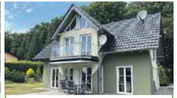
SANKT KATHARINEN Neuwertiges EFH, Weitblick, ca. 132 m² Wfl., ca. 11 m² Nfl., PKW-Doppelgarage, 854 m² angel. Grst., Energieklasse: A, Endenergieverbrauch: 48 kWh/(m²a), Erdwärmepumpe mit WW, Strom, Bj. Gebäude 2004, Bj. Hgz. 2017, Kaufpreis: € 468.000,- + 1,50 % Käuferprovision.