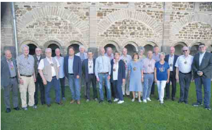
Das Ordenskapitel mit dem neuen Ritter vom Siebengebirge 2023 (m.) im Innenhof der Propstei