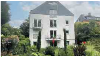
BAD HONNEF-KURVIERTEL Vermietete 2-Zi.-Eigentumswohnung im Sockelgeschoss, Terrasse, ca. 71 m² Wfl., Personenaufzug, PKW-Stellplatz, Energieklasse: E, Endenergieverbrauch: 136,20 kWh/(m²a), Gaszentralhgz. mit WW, Bj. Gebäude 1993, Bj. Hgz. 1993, Kaufpreis: € 255.000,- + 3,57 % Käuferprovision.