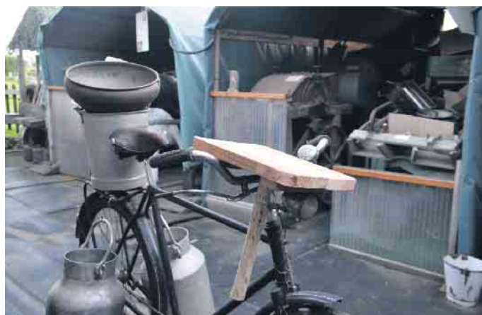
Sammlerstücke aus mehreren Jahrzehnten - die Sammlerscheune in Gratzfeld bietet einen Einblick in frühere Zeiten

Auf dem Außengelände gibt es die unterschiedlichsten landwirtschaftlichen Geräte zu sehen. Hier kann man nachvollziehen, wie schwer die Feldarbeit früher einmal war. In einer Telefonzelle stehen Telefone aller Epochen. Das ist nur ein kleiner Querschnitt durch die Vielzahl der in der Oberhauer Sammlerscheune ausgestellten Exponate. Zu Gast werden auch die Traktorenfreunde aus Oberpleis und Uckerath sein, die Veteranenfreunde Siebengebirge mit ihren Oldtimer-Motorrädern, ein Hochradfahrer, eine Garnspinnerin sowie ein Hufschmied. Für Speis und Trank ist ebenfalls gesorgt. So werden Waffeln auf einem alten Waffeleisen zubereitet. Ein lohnens-