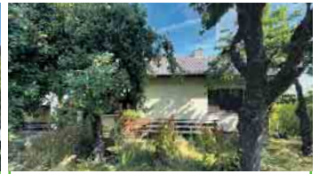
BAD HONNEF-AEGIDIENBERG Freist. EFH, zentrale Wohnl., ca. 114 m² Wfl. + ca. 38 m² Nfl., PKW-Garage, 499 m² Grst. mit Gartenhaus, Energieklasse: F, Endenergiebedarf: 164,6 kWh/(m²a), Ölzentralhgz., Bj. Gebäude 1964, Bj. Hgz. 2015, Kaufpreis: € 369.000,- + 2,85 % Käuferprovision.

Bald in unserem Angebot. Jetzt vormerken lassen!