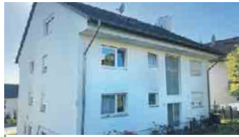
BAD HONNEF-SELHOF Solide vermietetes 7-Parteienhaus in schöner Aussichtslage.

Bald in unserem Angebot. Jetzt vormerken lassen!