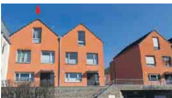
BAD HONNEF-RHÖNDORF Modernes Stadt-/Reihenhaus, ca. 168 m² Wfl., ca. 10 m² Nfl., große Terrasse + Balkon, PKW-Garagenstellplatz, Energieklasse: B, Endenergieverbrauch: 50 kWh/(m²a), Gaszentralhgz. mit WW, Bj. Gebäude 2008, Bj. Hgz. 2008, Kaufpreis: € 629.000,- + 2,50 % Käuferprovision.