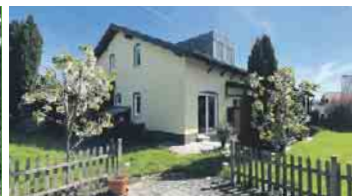
KÖNIGSWINTER-EUDENBACH EFH mit guter Aufteilung, ca. 131 m² Wfl., ca. 70 m² Nfl., PKW-Garage, Carport, 398 m² angel. Grst., 2 Terrassen, Energieklasse: E, Endenergieverbrauch: 156 kWh/(m²a), Gashgz. mit WW (Flüssiggas-Erdtank), Bj. Gebäude 2001, Bj. Hgz. 2001, Kaufpreis: € 449.000,- + 2,50 % Käuferprovision.