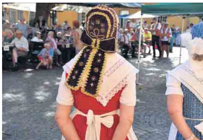
Auf dem Gelände des historischen Gutshofes warten zahlreiche Überraschungen auf die Gäste

Eierlaufen und Dosenwerfen. Außerdem kann im Park eine Auswahl prächtiger schlesischer Tauben bewundert werden. Das Museum bietet verschiedene Führungen für jeden Geschmack an: Um 11.30 Uhr durch die Dauerausstellung, um 13.30 Uhr für Kaffeeliebhaber durch die Sonderausstellung „Arabica und Muckefuck“ und um 15.30 Uhr „Auf den Spuren alkoholischer Erzeugnisse in Schlesien“, bei der es an entsprechenden Stellen die Möglichkeit zur Verkostung verschiedener Schnäpse und Biere gibt. Haus Schlesien freut sich, alte Bekannte und neue Gesichter begrüßen zu dürfen.