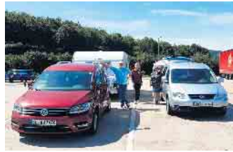
Zwei Caddygespanne auf der Anreise, Parkplatz Logebachtal

Zwei Caddys mit drei Caddyfamilien, eine Tagesgastfamilie hatte sich noch dem Treffen angeschlossen, stiegen 456 Treppenstufen hinab auf 70 Meter unter Tage. Es war eine tolle und sehr informative Höhlenführung. Anschließend ging es weiter nach Weilburg zum Schloss der Grafen von Weilburg und Nassau und in