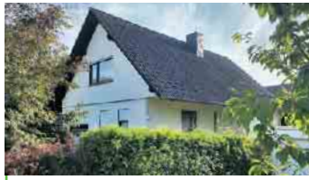
BAD HONNEF-TAL Zeitloses EFH in bevorzugter und familienfreundlicher Wohnlage, ca. 138 m² Wohnfläche, ca. 70 m² Nutzfläche, PKW-Garage, 542 m² pflegeleicht angelegtes Grst., Energieausweis ist z.Zt. noch in Erstellung. Kaufpreis: € 598.000,- + 2,50 % Käuferprovision.