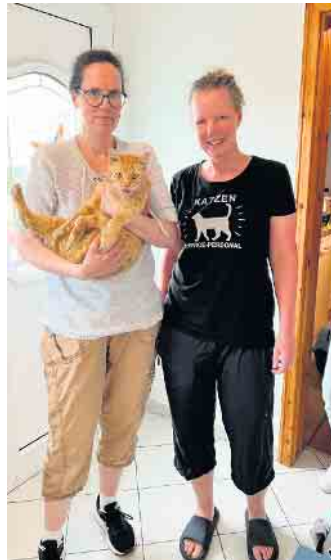
Kater Ron war fast 4 Jahre auf Abwegen - dann durfte ihn sein Frauchen wieder in die Arme schließen.

Man sah Ron die Beschwerden seiner langen Wandschaft an, aber bald wird er wieder zu Kräften kommen. Er ist ja wieder bei seinen Menschen, die alles für ihn tun.