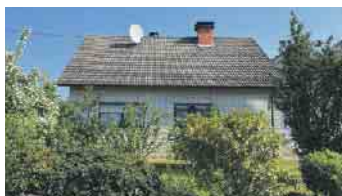
WINDHAGEN Vermietetes Wohnhaus, insg. ca. 158 m² Wfl., ca. 70 m² Nfl., Parkmöglichkeiten in der Einfahrt, 659 m² angel. Gartengrst., Energieklasse: H, Endenergiebedarf: 297,4 kWh/(m²a), Ölzentralhgz. mit WW, Bj. Gebäude 1968, Bj. Hgz. 1993, Kaufpreis: € 195.000,- + 3,57 % Käuferprovision.