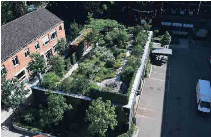
Auch Gärten sind auf Dächern möglich, es wird dann von einer intensiven Dachbegrünung gesprochen.

Laut des Berichts bringt das Dachdeckerhandwerk das nötige Fachwissen mit und arbeitet gewerkeübergreifend, etwa mit Elektrikern, Landschaftsbauern oder dem SHK-Handwerk. Genau solche Kompetenzen werden aktuell in der Aus- und Weiterbildung weiter gestärkt - mit neuen Inhalten, einer freiwilligen Lehrwoche Energietechnik und zusätzlichen Qualifikationen wie dem PV-Manager.