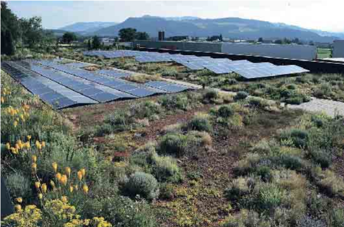
Die perfekte Kombi: Photovoltaik und Gründach.

Das Dachdeckerhandwerk ist bestens aufgestellt, wenn es um den Umgang mit den Folgen des Klimawandels geht. Das zeigt jetzt auch der Abschlussbericht des Bundesinstituts für Berufsbildung (BIBB), der die Rolle der beruflichen Bildung bei der Klimaanpassung untersucht. Unter den zahlreichen Ausbildungsberufen wird das Dachdeckerhandwerk besonders hervorgehoben - als einer von drei Berufen, die schon heute entscheidend zur Klimaanpassung beitragen.