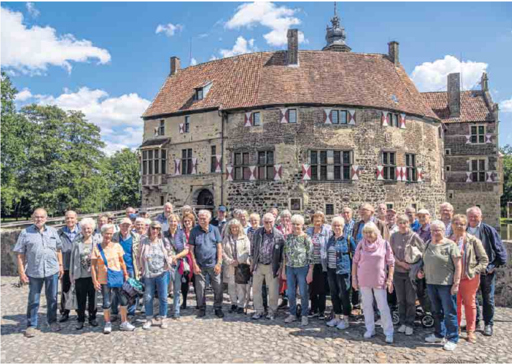
Burg Vischering.

Oberpleis (bg): Am 29. Juli begaben wir uns auf eine spannende Reise in das Herz Westfalens. Unser Ziel war die malerische Stadt Münster, gefolgt von einem besonderen Höhepunkt: der Burg Vischering in Lüdinghausen, deren beeindruckende Geschichte und Architektur wir im Rahmen einer Führung kennenlernen durften. Die Führungen begannen am imposanten St.-Paulus-Dom, der mit seinem romanisch-gotischen Stil beeindruckt. Von dort ging es weiter zum berühmten Prinzipalmarkt, dessen eindrucksvolle Giebelhäuser aus Sandstein und Bogengängen Münster einen einzigartigen Charme verleihen. Unsere Stadtführer erzählten von der bewegten Geschichte der Stadt, die eng mit dem Westfälischen Frieden von 1648 verknüpft ist. Münster war gemeinsam mit Osnabrück eine der beiden Friedensstädte, in denen der Dreißigjährige Krieg offiziell beendet wurde. Anschließend führte unser Weg zum historischen Rathaus, einem Symbol für Bürgersinn und Selbstverwaltung durch die Jahrhunderte.