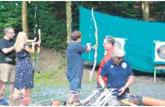
Wer das Luftgewehr nicht in Hand nahm konnte sich im Bogenschießen üben

Die Schießwettbewerbe standen in Fokus, auch wenn sich die Kinder über Bullenreiten, Bogenschießen und die rollende Waldschule freuen konnten