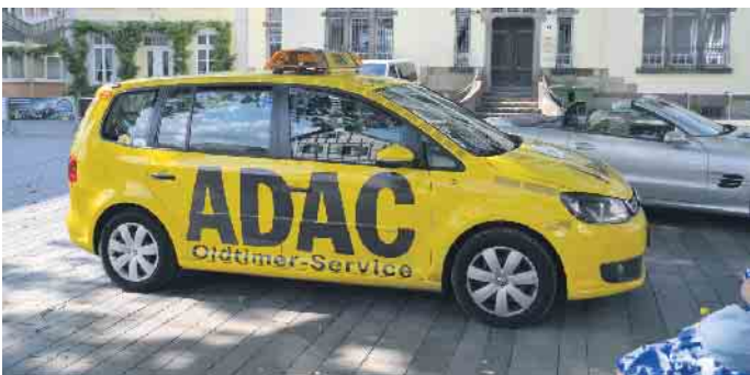
Der ADAC Oldtimer Service begleitete die Fahrzeuge und musste vereinzelt Pannenhilfe leisten