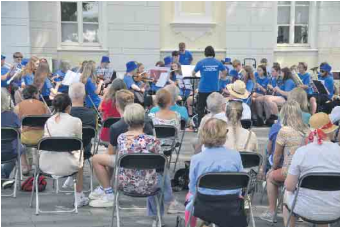
Die vorbereiteten Stuhlreihen auf dem Marktplatz füllten sich schnell

Partnerstadt Königswinters, packte ihre Instrumente auf dem Marktplatz der Altstadt aus. Nicht alle Jugendlichen waren pünktlich, denn in Ermangelung eines englischen Frühstücks lief der ein oder andere noch mit einer Pizza durch die Straßen. Doch all dies tat der Begeisterung der Zuhörer, die die vorbereiteten Stuhlreihen auf dem Marktplatz füllten, keinen Abbruch. Mit dem Konzert der britischen Frederick Gough School ging die Veranstaltungsreihe von Open-Air-Konzerten in der Altstadt von Königswinter anlässlich der 50-jährigen Städtepartnerschaft weiter. Alle zwei Jahre schickt die Schule aus dem englischen Scunthorpe 50 junge Musikerinnen und Musiker auf Tournee ins Ausland. Die Gemeinschaftsschule in Lincolnshire, die Schülerinnen und Schüler im Alter von 11 bis 16 Jahren aufnimmt, liegt in der Nähe von Cleethorpes.