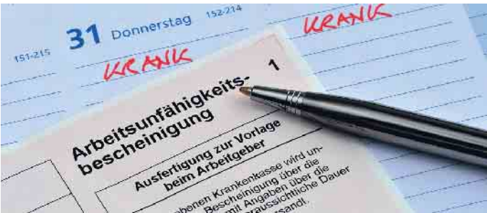
Arbeitnehmer erhalten auch weiterhin eine Arbeitsunfähigkeitsbescheinigung auf Papier.

bung unbedenklich, beispielsweise bei Knochenbrüchen. Entscheidend ist, dass sich Mitarbeiter während ihrer Arbeitsunfähigkeit nicht gesundheitsschädigend verhalten. Ansonsten können sie eine Abmahnung oder sogar die fristlose Kündigung riskieren. Weitere Rechtstipps unter www.roland-rechtsschutz.de (akz-o)