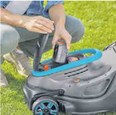
AKKU-RASENMÄHER POWERMAX 32/18V SOLO

info@baustoffe-klein.de www.baustoffe-klein.de Öffnungszeiten: Mo. - Fr. 8.00 - 18.30 Uhr Sa. 8.00 - 16.00 Uhr