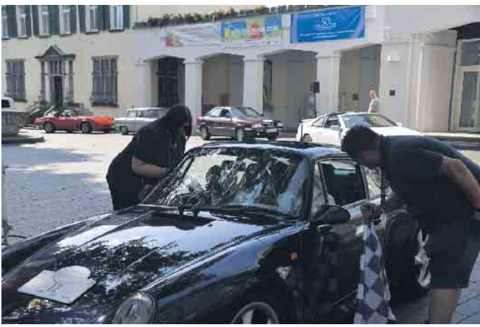
Die Youngtimertour endete an beiden Tagen auf dem Marktplatz der Königswinterer Altstadt

(bk) Königswinter. Es ist mittlerweile eine langjährige Tradition des ADAC Nordrhein, mit klassischen Fahrzeugen im Rahmen des Automobilwanderns unterwegs zu sein. „Die ADAC Rheinlandfahrt ist dabei nicht nur die erste der drei Veranstaltungen