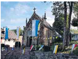
Die Anna-Kapelle mit ihren neugotischen Formen gibt dem Kirmestreiben den Namen