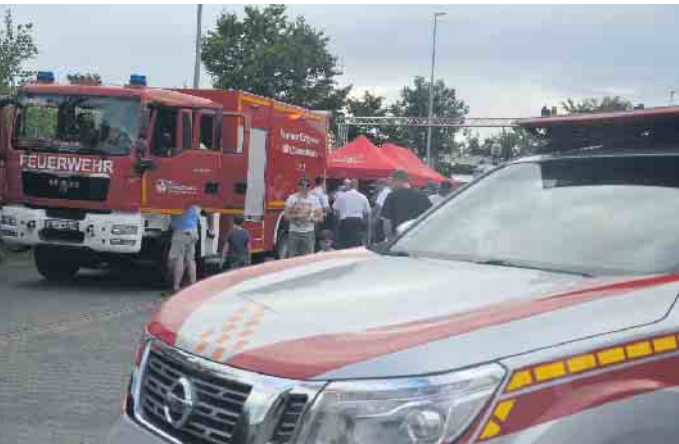
Die Fahrzeuge der Löscheinheit Bockeroth konnten besichtigt werden

bei der älteren Generation schon für Vorfreude auf die traditionelle bockeroth Feuerwehrestombola am späteren Abend. Zur Überleitung in den Partyabend rockte die Bockeroth Showtanzgruppe „Sternschnuppen“ die Bühne und im weiteren Verlauf des Abends sorgte DJ Alex für ausgelassene Partystimmung, die zu späterer Stunde in die „Brennbar“ übertragen wurde. Die Bockeroth