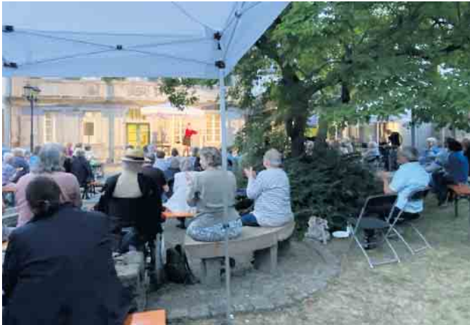
Ein unterhaltsames Kabarett-Programm beendete den Tag des Museumsfestes in der Altstadt

nie ihre jungen Zuhörerinnen und Zuhörer. Die Mitarbeiterinnen und Mitarbeiter des Museums boten Kurzführungen in der Dauerausstellung und in den aktuellen Sonderausstellungen „Ausgegrenzt. Verfolgt. Ermordet. Die Opfer der Nationalsozialisten im Siebengebirge“ und „Mensch und Tier. Geschichte einer Beziehung“ an. In kleinen Gruppen konnte darüber hinaus auch ein Blick in das Museumsdepot geworfen werden. Hier gaben die Mitarbeitenden des Museums Einblicke in den Museumsalltag. Auch die Museumsbibliothek des Heimatvereins in der ausgesuchte Archiv-Schätze präsentiert wurden, war für die Gäste geöffnet. Am Abend dann ein besonderes Highlight. „Mutter ist