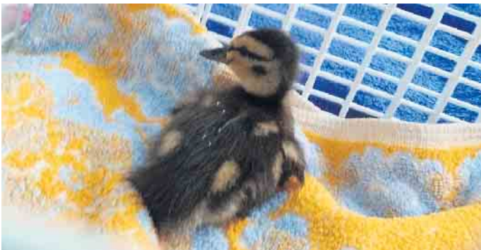
Dank aufmerksamer Menschen, konnte das kleine Entenküken gerettet werden.

lenkte das Küken Richtung Ufer. Dort holte der zweite Helfer es dann mit einem Kescher vorsichtig aus dem Wasser und sicherte es. Es war schon nach 22 Uhr und keine Aufangstation mehr erreichbar. Also musste improvisiert werden: Eine Wäschewanne, ein Heizkissen, warme Decken, Wasser und zerkleinerter Löwenzahn. In dieser kleinen Höhle der Geborgenheit kam das winzige Küken zur Ruhe - und schlief - stundenlang ganz dicht neben seinem Retter. Am nächsten Morgen wurde das Kleine zum Kooperationspartner des Tierschutz Siebengebirge, der Wildvogel-Pflegestation Kirchwald in der Eifel, gebracht. Dort gab es auch andere verwaiste Küken, die das kleine Entchen in ihrer Gruppe aufnahmen. Nach diesem glücklichen Ausgang bedankt sich der Verein bei allen