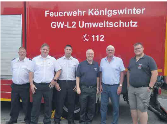
Landrat Sebastian Schuster (2.v.r.) besuchte die Bockeroth Wehr und dankte ihr für den stetigen Einsatz

(bk) Bockeroth. Am vergangenen Wochenende feierte die Löscheinheit Bockeroth das jährliche Feuerwehrfest. Der flammende Event-Fest wird schon seit vielen Jahren als „Tag der Feuerwehr“ begangen und startete mit Kaffee, Kuchen und jeder Menge Unterhaltung für die Kinder. Neben zahllosen Spielgeräten zog die Hüpfburg in Form eines Feuerwehrfahrzeuges die kleineren Feuerwehrfans in ihren Bann. Im Laufe des Nachmittags stand mit der Showübung der Jugendfeuerwehr das erste Highlight auf dem Programm. In einem Löschangriff musste eine Feuertonne gelöscht werden. Diese Aufgabe bewältigten die 9 Mädchen und Jungen mit Bravour und begeisterten das Publikum. Im Anschluss an diese heiße „Action“ eroberten viele der jüngeren und jung gebliebenen Gäste die Feuerwehrfahrzeuge und ließen sich Details der Ausrüstung erklären. Eine Kindertombola, bei der jedes Los ein Gewinn, sorgte für große Augen bei den jüngeren Festbesuchern und