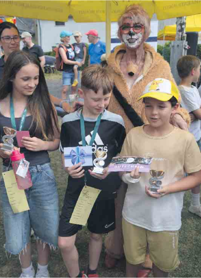
Zahlreiche Kids erhielten auf dem Kinderfest ihre Preise

Der Bürgerverein Berghausen hatte zum Kinderspektakel auf den Dorfplatz eingeladen, der Tag endete am Abend mit einem Dämmerstopp