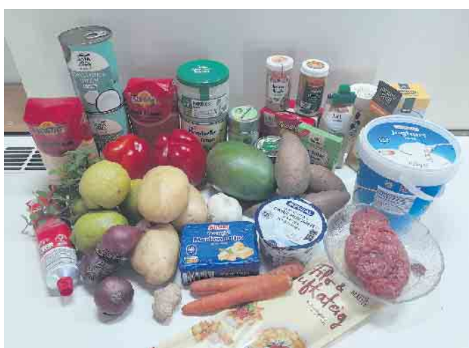
Aus frischen Zutaten indisch kochen

Das gemeinsame Essen, mit Hintergrundinformationen zur indischen Küche und den zubereiteten Gerichten auf der Terrasse war dann der wundervolle Teil des Kochabends mit einer leichten Brie- und bei angenehmen 29 Grad. Auch der nächste gemeinsame Kochabend am 5. August ist wieder ein Sommerkochabend. Wir treffen uns ab 18 Uhr zum grillen