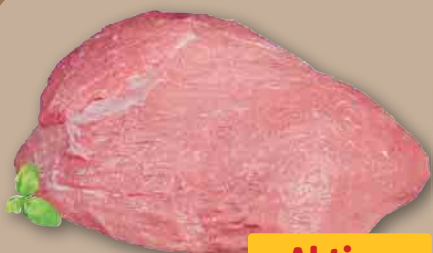
Kalbs-Hüfte je 100 g