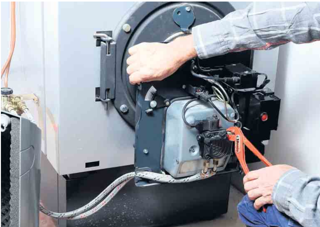
Viele Reparaturen können durch regelmäßige Heizungswartung vermeiden werden.

Die Heizungswartung wird schnell vergessen. Dabei beugt sie hohen Kosten vor und schützt vor einem Ausfall im Winter. Wer es in der kalten Jahreszeit warm haben möchte, sollte daher seine Heizung regelmäßig vom Fachmann warten lassen. Doch wie oft sollte eine Heizung überprüft werden, welche Kosten kommen auf Sie zu und was gilt es zu beachten? Wenn der Winter vor der Tür steht und draußen die Temperaturen sinken, mag man es drinnen am liebsten muckelig warm. Aber egal ob Wärmepumpe, Gas-, Öl- oder Pelletheizung: Damit im Winter die heimische Wärmequelle nicht ausfällt, ist es wichtig, die Heizungsanlage regelmäßig warten und reinigen zu lassen. Tatsächlich ist die Wartung der Heizungsanlage sogar gesetzlich vorgeschrieben. Allerdings schreibt das Gebäudeenergiegesetz nicht vor, wie oft die Überprüfung und Reinigung der Heizung gesehen muss. Genauso wenig wird diese Vorschrift kontrolliert. Trotzdem sollte man bestimmte Wartungs- und Reinigungsintervalle einhalten. Denn bei der Garantie der Heizungshersteller sieht es anders aus. Wie oft sollte ich meine Heizung warten? Um den Garantieanspruch nicht zu verlieren, sollte die Heizungsanlage mindestens einmal im Jahr gewartet werden. Auch nach Ablauf der Garantie ist die regelmäßige Kon-