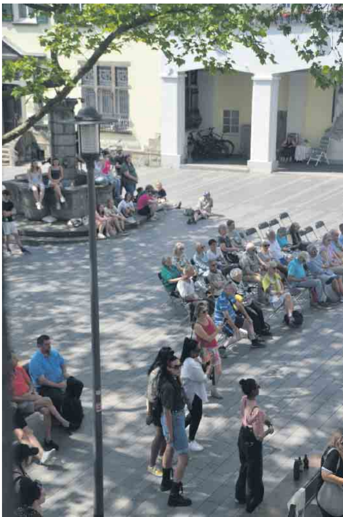
Zahlreiche Passanten legten bei ihrem Gang durch die Altstadt eine Pause ein und lauschten den Klängen

tionellen Marsch bis zum allseits beliebten „Blumentanz“ eine Vielfalt von Musikstücken.