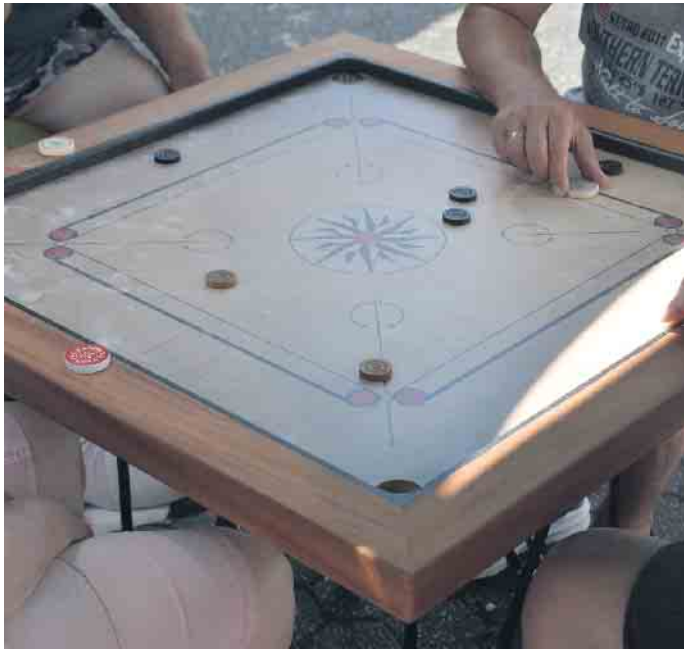
Das Brett, das für den Carrom-Club Siebengebirge die Welt bedeutet