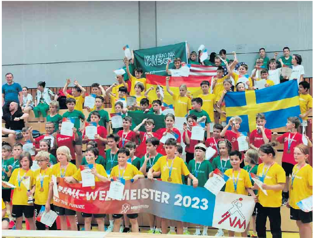
Ein kunterbuntes Bild bei der E-Jugend Mini-WM.

(bk) Im Handballverband Mittelrhein stand nach vielen Jahren wieder eine Weltmeisterschaft auf dem Programm. Genauer gesagt: die E-Jugend Mini WM, die deutschlandweit im Mai und Juni in allen Verbänden gespielt wurde. Da waren die Grün-Blauen von der HSG Siebengebirge mit von der Partie. Und als „Team Algerien“ passte die Grundfarbe der Landesflagge auch bestens zu den Vereinsfarben. In der Vorrunde am 13. Mai in Niederpleis holte sich die HSG mit Erfolgen gegen Deutschland und Libyen sowie einem Remis gegen Tunesien den Gruppensieg. Die Hauptrunde der Weltmeisterschaft fand dann am 4. Juni bei bestem Sommerwetter passenderweise in der gut temperierten Oberpleiser Sunshine Arena statt. Hier konnten die Grün-Blauen als einziges Team ohne Niederlage nach den Begegnungen gegen die USA und Tunesien den Einzug in die Finalrunde sichern. Am Sonntag, 18. Juni, war Eschweiler der Ort des Geschehens, wo der WM-Titel der E-Jugend ausgespielt werden sollte. Dort konnten sich die Siebengebirgler im Viertelfinale gegen Spa-