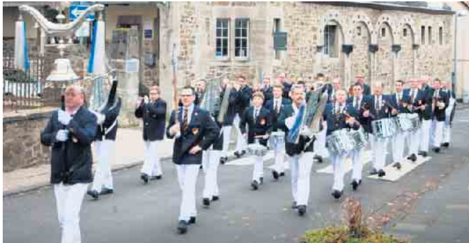
Stets gern gesehen in Bad Honnef und der Region - der Spielmannszug TV Eiche