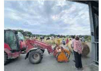
Zu Besuch im Gut Frankenforst

Die SPD Königswinter besucht im Rahmen ihrer „SPD vor Ort“-Reihe verschiedene Betriebe in Königswinter. Die Termine sind offen für alle interessierten Menschen aus Königswinter. Bei Interesse an einer künftigen Teilnahme, schreiben Sie gerne an info@spd-