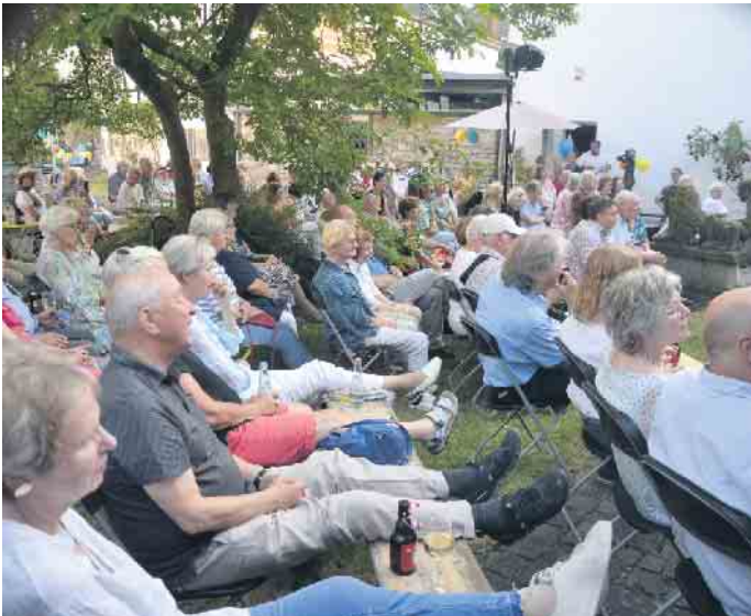
Zahlreiche Gäste lauschten dem humorvollen Vortrag des Kabarettisten

Conrad Beikircher hielt die Gäste im Siebengebirgsmuseum mit seinen Anekdoten bei bester Laune