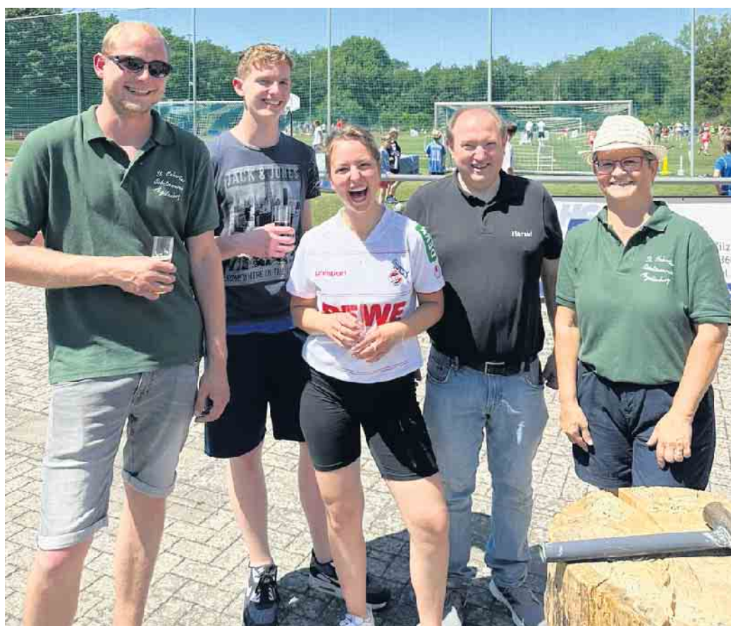
Sie hatten die Nase vorn beim Dreikampf der Ortsvereine.