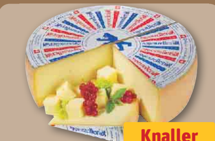
Appenzeller mild-würzig Schweizer Hartkäse, mind. 48% Fett i.Tr., je 100 g