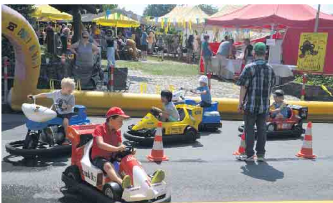
Auf dem Mini-Autoscooter wurden spannende Rennen gefahren.

HER MIT DER KOHLE WERDE JETZT AUSTRÄGER/*/IN EIN INTERESSANTER NEBENJOB FÜR JUNG UND ALT!