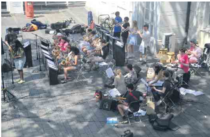
Junge Menschen aus England musizierten auf dem Marktplatz der Altstadt

Altstadt zu hören. Diesmal spielte in der Mittagszeit die Brass Band der Londoner Royal Holloway University. Das 2019 von Musikstudentinnen und -studenten gegründete Orchester hat schon mehrfach erfolgreich an Musikwettbewerben teilgenommen und tritt in Königswinter zusammen mit dem Jane Holloway Chor auf. Zu dem Blechbläser-Showcase der Londoner Royal Holloway University gehören aus dem gesamten Campus vor, darunter: eine Eröffnungstrompetenfanfare von „La Peri“; ein klassisches Waldhornensemble, bestehend aus einigen der Orchesterhornisten; Bear’s Brass, ein Oktett, das Musik aus Jurassic Park und den beliebten Klassiker „It’s Not Unusual“ bietet, und die neu gegründete, erste Royal Holloway Brass Band. Diese Formation unter der Leitung