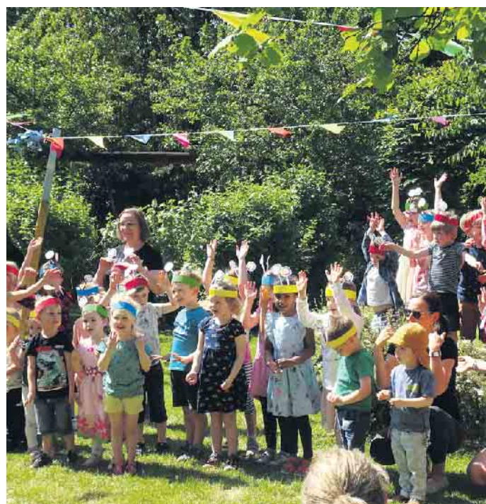
Sandkasten-Kids in Feierlaune: Die Kinder der Elterninitiative eröffnen das Sommerfest mit einer stimmungsvollen Aufführung.