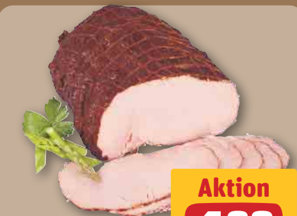
Tarczynski Poln. Kesselschinken je 100 g