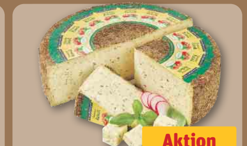
Käseebellen Sommer Rebel Schnittkäse, mind. 50% Fett i.Tr., je 100 g