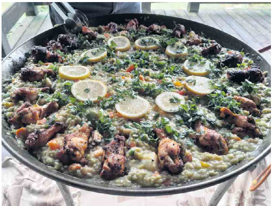
Lecker war sie: die fertige selbstgemachte Paella.