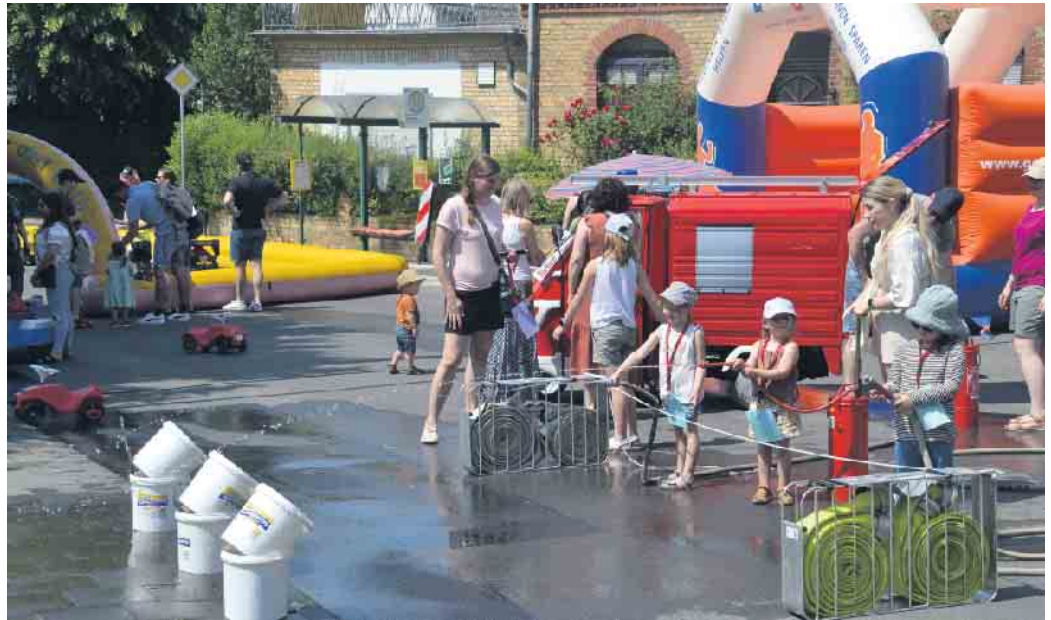
Bei sommerlichen Temperaturen sorgte die Freiwillige Feuerwehr für eine Abkühlung.

(bk) Die Berghausener Straße war auf Höhe des Dorfplatzes gesperrt. Die Straße gehörte, wie auch der anliegende Dorfplatz, den Jungen und Mädchen aus dem Ort und der Region. Das mittlerweile traditionelle Kinderspektakel lockte zahlreiche kleine Besucher und Besucherinnen an. Über 80 Kinder nahmen an der Olympiade teil, die in zwei Altersklassen gestartete wurde. Am Ende warteten Pokale und Gutscheine für die Eisdiele, die Buchhandlung und für Coppeneuer auf die Gewinner*innen. Große Begeisterung löste erneut der Mini-Autoscooter für Kinder von 3 bis 10 Jahren aus. Außerdem sorgte die Feuerwehr mit ihrem Löschzug aus Oberpleis bei traumhaftem Wetter wieder für eine interessante und zudem erfrischende Unterhaltung. Natürlich war auch das kulinarische Angebot auf die jungen Gäste abgestimmt. Chicken Nuggets und Pommes, Muffins und frische Waffeln standen auf der Speisekarte. „Ohne die Unter-