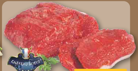
Roastbeef vom Jungbullen, am Stück oder in Scheiben, Haltungsform 3, je 100 g