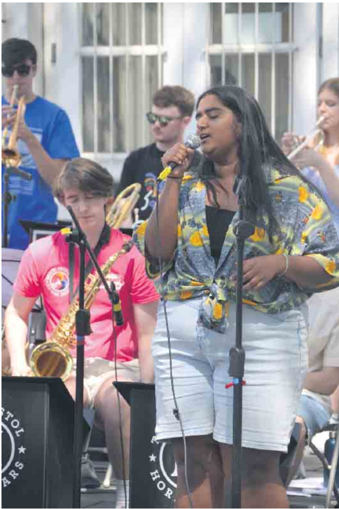
Lebensfreude pur - die jungen Musiker*innen begeisterten die Zuhörer

Mit der Bristol University Jazz Society und der Brass Band der Londoner Royal Holloway University stellten sich jugendliche Musikerinnen und Musiker im Siebengebirge vor