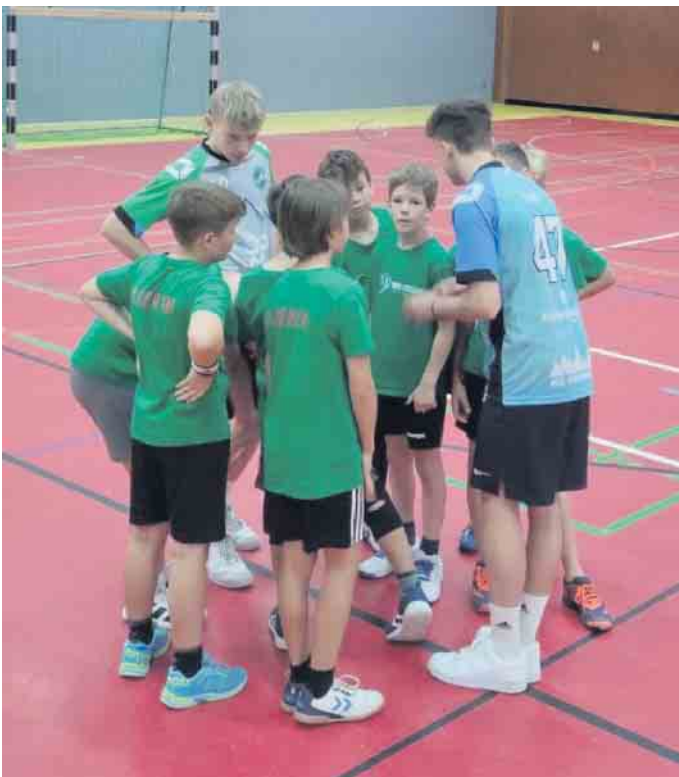
Teambesprechung bei der HSG - die Jugendmannschaft erreichte das Halbfinale

Partie ging deutlich mit 4:10 an Dänemark (HC Eynatten aus Belgien). Aber der vierte Platz von insgesamt 32 Teams aus dem ganzen HVM-Gebiet war für die E-Junioren aus dem Siebengebirge ein toller Erfolg und ein besonderes Erlebnis in der Vorbereitung auf die kommende Saison 2023/2024.