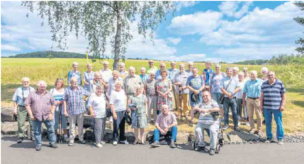
Die Teilnehmenden an der Birkenhof-Brennerei

Regelmäßig montags um 15 Uhr trifft sich die Gruppe im Pfarrheim Oberpleis, Königswinterer Str.1. Es gibt immer ein abwechslungsreiches Programm. Interessenten sind sehr gerne