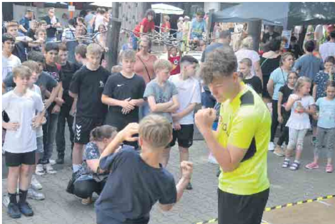
„Action“ auch auf dem Schulhof der Gesamtschule

Zukunft beschäftigten - von alternativen Antrieben für Fahrzeuge oder selbstgemachten Pflegeprodukten aus natürlichen Stoffen über nachhaltige Ernährung und gesunden Sport bis hin zur Wasserversorgung. In 22 Klassenräumen, auf dem Schulhof und dem Technikhof wurden die Ergebnis-