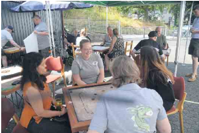
Open Air Carrom - eine ganz besondere Trainingsstunde