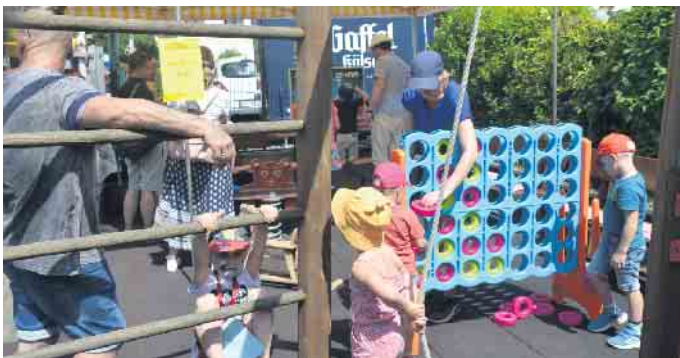
Spiel und Spaß für die jungen Besucher, die zahlreich zum traditionellen Kinderspektakel gekommen waren.

allem der Tombola zu Gute kamen, waren von den örtlichen Firmen und Geschäften bereit gestellt worden. Es war ein Fest, das bei allen Gästen für fröhliche Gesichter sorgte.