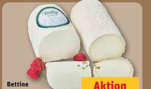
Bettine Ziegenkäse holl. Frisch- oder Weichkäse, versch. Sorten, je 100 g