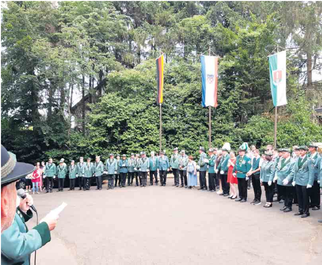
Vor dem Schützenhaus wurden die befreundeten Vereine begrüßt.