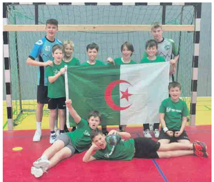
Die Grün-Blauen von der HSG Siebengebirge waren als „Team Algerien“ beim Turnier dabei