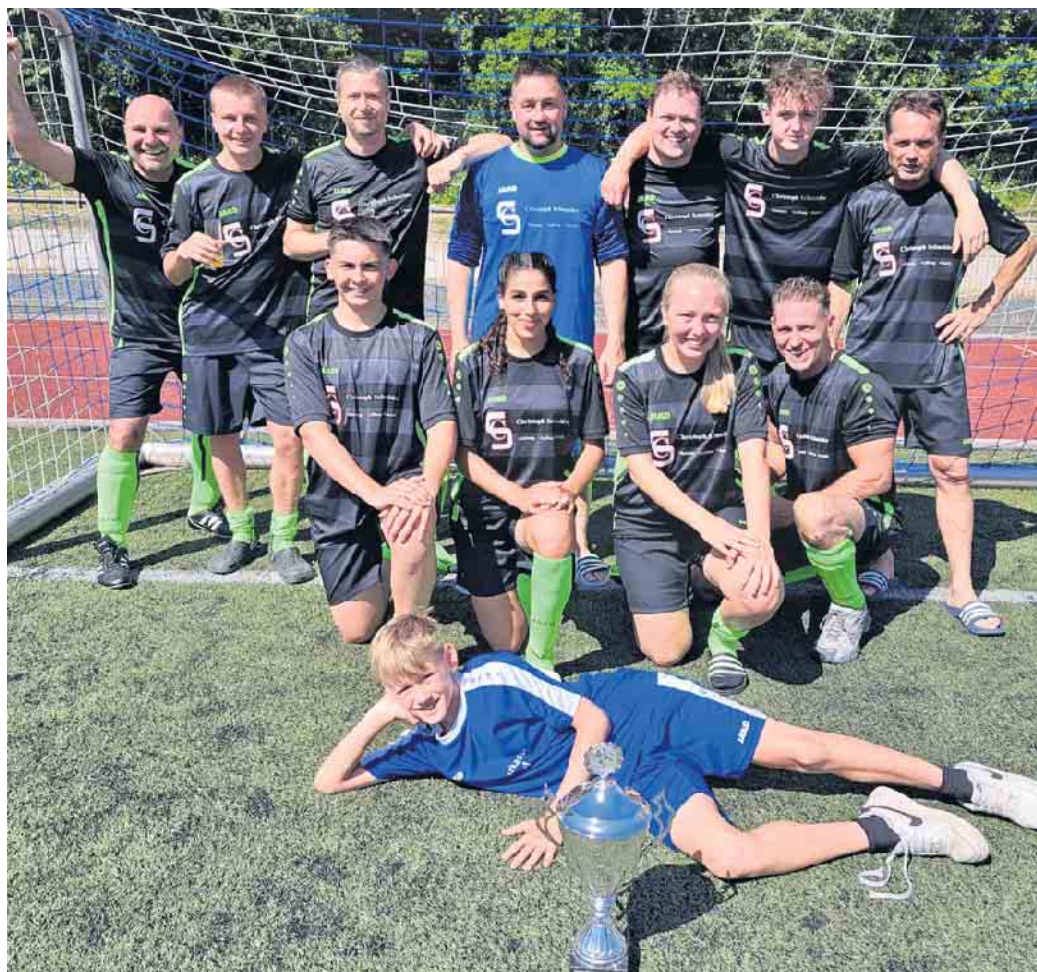
Die Mannschaft aus Himberg siegte beim Turnier der Ortsmannschaften.