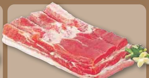
Schweine-Bauch ohne Knochen, am Stück, Haltungsform 2, je 1 kg