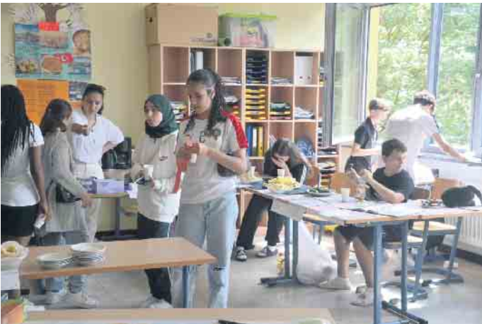
In den Klassenzimmern wurden die Ergebnisse der Projekte präsentiert.

Die Gesamtschule Oberpleis hatte zum Ende des Schuljahres zu einem Schulfest eingeladen und präsentierte dabei zahlreiche Projekte