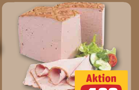
Neuburger östr. Spezialität, je 100 g