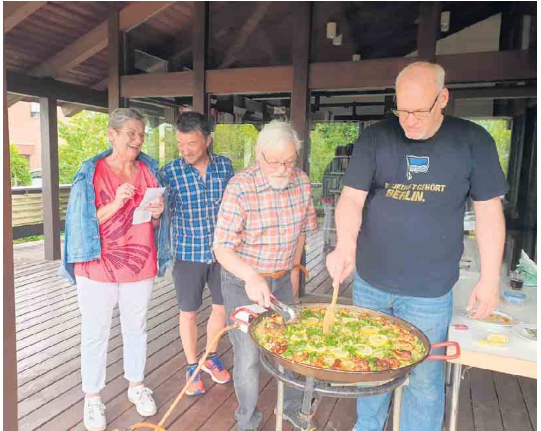
Gemeinsam kochen - essen - trinken - reden

Und auch im Jahr 2024 wird weiter einmal monatlich im Gemeindehaus Oberpleis gemeinsam gekocht werden. Wenn Sie auch einmal einen Kochabend kulinarisch mitgestalten wollen, dann melden Sie sich doch bei kai.zielke@ekir.de . Sie müssen nicht alles alleine organisieren, Hand in Hand geht es viel einfacher.