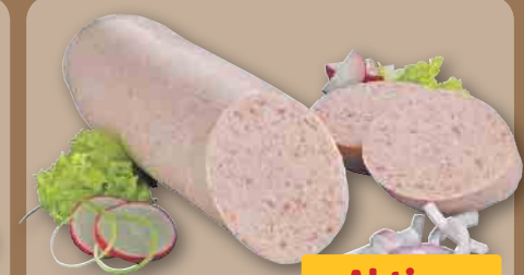
Wiltmann Zwiebelwurst je 100 g