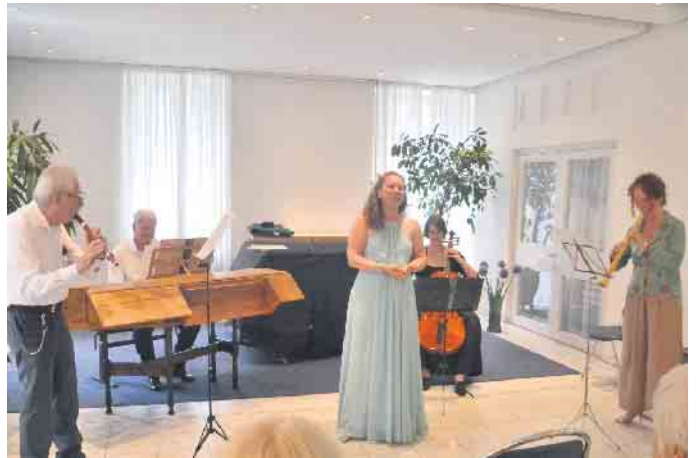
Ein Klangvergnügen zu dem Motto „Das Leben ist ein Traum“