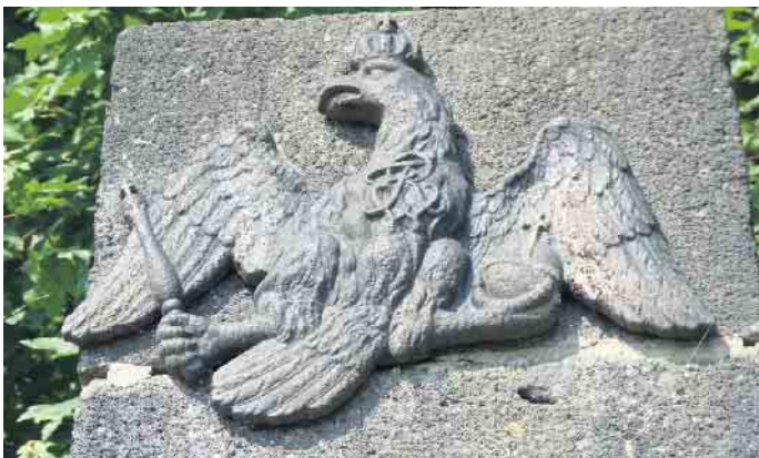
„Fliegender Adler“. Der aus Basalt gefertigte preußische Meilenstein befindet sich gegenüber der Einmündung der Straße von Unkelbach nach Remagen auf die B 9.

Eine historische Wanderung - mit Bildern - zu materiellen Zeugnissen einer prägenden Zeit von Karl-Heinz Zuber