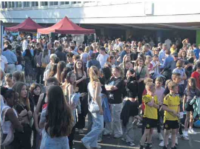
Die Schülerinnen und Schüler konnten sich bei der SIBI-Sommernacht über zahlreiche Gäste freuen

Endlich war es wieder so weit - die traditionelle Sommernacht am Siebengebirgsgymnasium fand wieder in gewohnter und geliebter Form statt