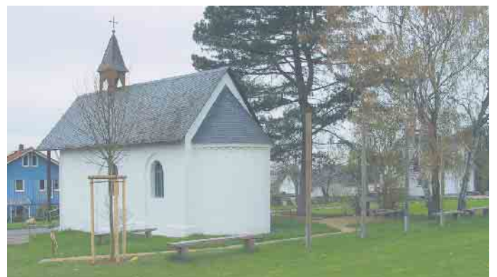
Die Eisbacher Marienkapelle ist oftmals ein Ort der Kunst und Kultur

Ein Hund ist nicht nur der beste Freund des Menschen, er kann auch zu dessen Retter werden. Mantrailer werden dazu ausgebildet, vermisste Menschen aufzuspüren. In Rettungshundestaffeln als auch in Hundeschulen oder Hobbygruppen wird diese Ausbildung angeboten. Anschließend gibt es wie immer bei einem Getränk Gelegenheit, den Abend nachklingen zu lassen. Der Eintritt ist frei, um Spenden wird gebeten.