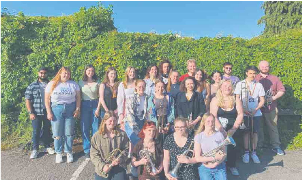
Die Brass Band der Londoner Royal Holloway University zu Besuch in Königswinter.

(bk) Königswinter. Am Donnerstag, 15. Juni tritt um 14 Uhr die Bristol University Jazz Society auf dem Marktplatz in der Altstadt auf und präsentiert Musik von Stevie Wonder, Count Basie, Michael Bublé, Elton John und anderen. Am Samstag, 17. Juni folgt mit einem Mittagskonzert um 12 Uhr die Brass Band der Londoner Royal Holloway University. Das 2019 von Musikstudentinnen und -studenten gegründete Orchester hat schon mehrfach erfolgreich an Musikwettbewerben teilgenommen und tritt in Königswinter zusammen mit dem Jane Holloway Chor auf. Der Eintritt zu beiden Konzerten ist frei. Bei schlechtem Wetter müssen die Veranstaltungen ausfallen.