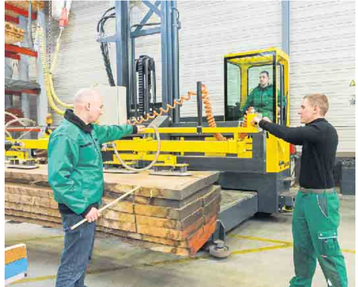
Ob im kaufmännischen Bereich, in der Verarbeitung oder der Logistik: Der Holzfachhandel bietet attraktive Ausbildungs- und Berufsperspektiven.

Wer gerne selbst den Werkstoff in die Hand nimmt, findet etwa mit einer Ausbildung als Holzbearbeitungsmechaniker oder -mechanikerin das passende Angebot. Doch nicht nur kaufmännische und technische Berufe bildet der Holzfachhandel vor Ort aus. Für effiziente Prozesse und eine zuverlässige, termingerechte Lieferung der Produkte an die Kunden sind Fachkräfte für Lagerlogistik verantwortlich. Sie begleiten das Holz quasi über den gesamten Weg von der Eingangskontrolle über die Einlagerung bis zur Bereitstellung. Berufskraftfahrer sind dann für den Transport direkt auf die Baustelle verantwortlich. Auch diesen Ausbildungsberuf bieten zahlreiche örtliche Fachhandelsunternehmen an. Unter www.holzvomfach.de/ausbildung etwa gibt es weitere Informationen, Einblicke in die Erfahrungen anderer Auszubildender und Ansprechpartner in den Unternehmen. Mit einer PLZ-Suche können Schulabgänger offene Stellen in der eigenen Region finden. (djd)