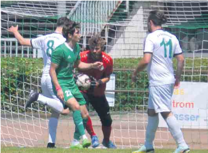
Im Spiel der HFV-Reserve wurde es vor dem Tor des Gastgeber ein über das andere Mal gefährlich

ber chancenlos und kassierte weitere drei Tore, so dass am Ende mit 0:4 eine weitere Niederlage zu Buche schlug. Der Herren I des HFV erging es nicht besser. In der ersten Halbzeit lag man mit 0:2 zurück, in den zweiten 45 Minuten erhöhte der 1. FC Spich den Vorsprung auf vier Tore. Honnef konnte die Defensive der Gäste zu keinem Zeitpunkt ernsthaft in Gefahr bringen. Beide Teams müssen zum Saisonabschluss nochmals auswärts antreten. An diesem Wochenende spielt die HFV-Reserve gegen den Tabellenführer der Kreisliga B, den 1. FC Spich II, die Herren I ist beim Tabellenvierten der Landesliga, dem VfL Alfter zu Gast.