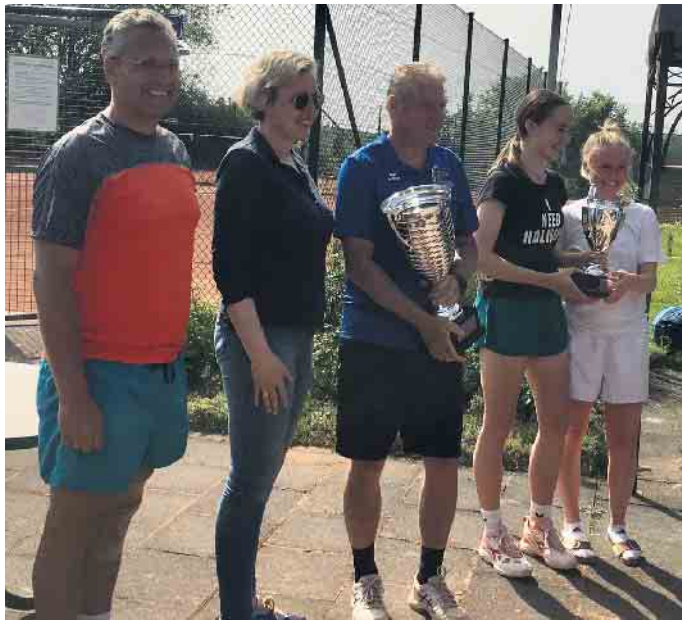
Die Finalisten des Turniers um den Bürgermeisterpokal 2023 mit der stellvertretenden Bürgermeisterin Katja Kramer-DiBmann

Zahlreiche Zuschauer erfreuten sich am Pfingstmontag beim Finalspiel um den Bürgermeisterpokal im Mix-Wettbewerb an erstklassigem Tennis.