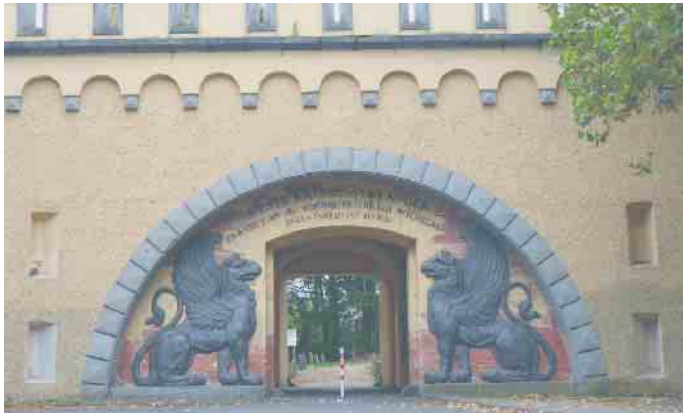
„Löwentor“ der ehemaligen preußischen Feste Alexander in Koblenz (Sitz des preußischen Generalkommandos)