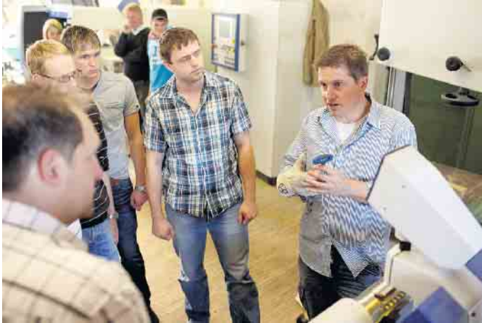
Die Azubis im Holzfachhandel erhalten eine fundierte Ausbildung mit hohem Praxisbezug.

Vielfältige Ausbildungs- und Karrierechancen im örtlichen Fachhandel