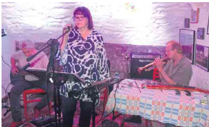
Eine stets besondere Atmosphäre herrscht bei den Veranstaltungen im Gewölbekeller der Löstigen Geselle

ein außergewöhnlicher Abend mit experimentellen Klängen geboten. Zum Abschluss des Frühjahrs- und Sommerprogramms gibt es noch einen absoluten Höhepunkt für alle Bluegrass-Freunde. Im Weinhaus Broel in Rhöndorf veranstaltet der Zeughaus Kleinkunstkeller in Zusammenarbeit mit Folk im Feuerschlösschen ein Konzert mit „Cole Quest and The City Pickers“, die am 04. Juli 2023 während ihrer Deutschlandtournee einen Stopp in Bad Honnef einlegen werden. Cole Quest ist der Enkel von Folk-Ikone Woody Guthrie.