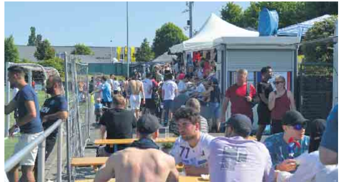
Bei herrlichen Temperaturen gönnten sich die spielfreien Mannschaften ein Bad in der Sonne

TuS 05 Oberpleis hatte zum heiteren Kicken in die Basalt-Arena eingeladen