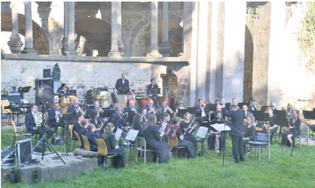
Open Air hieß es beim Auftakt-Konzert der Kachelsteiner Kulturtage