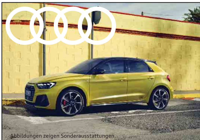
Abbildungen zeigen Sonderausstattungen.

achten. Während die Kinder auf Tour sind, haben die Eltern die Möglichkeit, das Siebengebirgsmuseum zu besuchen und die Altstadt Königswinters zu erkunden. In Einzelfällen kann ein Elternteil die Gruppe begleiten. Das Angebot ist nicht barrierefrei. Anmeldung: ausschließlich via Anmeldeportal auf der Website www.naturparke24.de