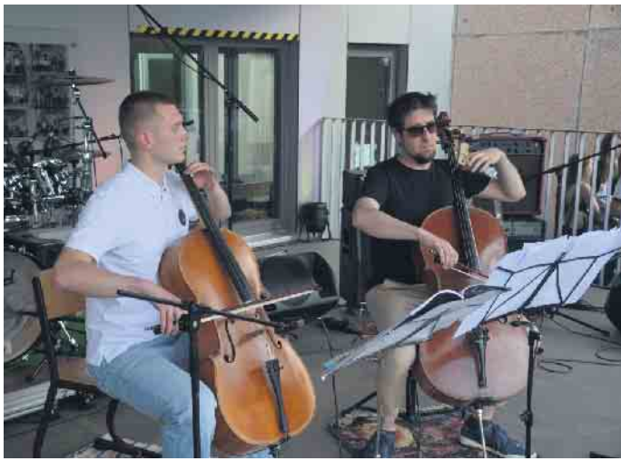
Auf der Bühne wurde ein musikalisches Programm geboten

die Bauern bewegt. Ein philosophisches Café lud zum Verweilen ein. Auf der Bühne konnten die Gäste verschiedene Tanzaufführungen der Musical-AG, eine Quiz-Show und vieles mehr miterleben. Die IVK-Klassen verwöhnten Jung und alt mit vielfältigen Köstlichkeiten. Ein Info-Stand bot einen Einblick in den Zero-Hunger-Run. Bei den Charity-Läufen der Welthungerhilfe - ob live oder virtuell - gehen Läuferinnen und Läufer für eine Welt ohne Hunger an den Start. Seit 2016 sind bereits über 18.000 Teilnehmer*innen für den guten Zweck gelaufen. Und die Bewegung wächst. Ein Highlight war die Begrüßung der neuen Fünftklässler, die sich bei dieser Sommernacht bereits ei-