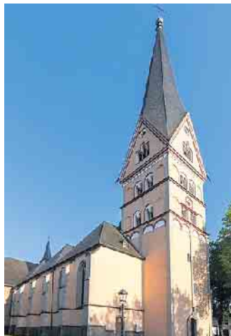
Die heutige Kirche mit dem Patrozinium des heiligen Johannes des Täufers prägt die Innenstadt von Bad Honnef

(bk) Bad Honnef. Zu zwei Führungen sind Interessierte am 10. Juni eingeladen. „Wir gehen auf Entdeckungsreise“ so lautet das Motto der Kinderführung, die an diesem Tag um 16 Uhr stattfindet. Es schließt sich eine Führung für Erwachsene um 16:30 Uhr an. „Ein Rundgang durch 1800 Jahre“ so lautet hier das Thema. Der Eintritt ist frei. Der Treffpunkt ist im Inneren der Kirche. Am 24. Juni um 16 Uhr lautet das Thema einer weiteren Führung „Prophet, Vorläufer oder wer ist das?“ Hier trifft man sich unter dem Sterngewölbe. Der Eintritt ist frei, die Führung dauert ca. 45 Minuten.