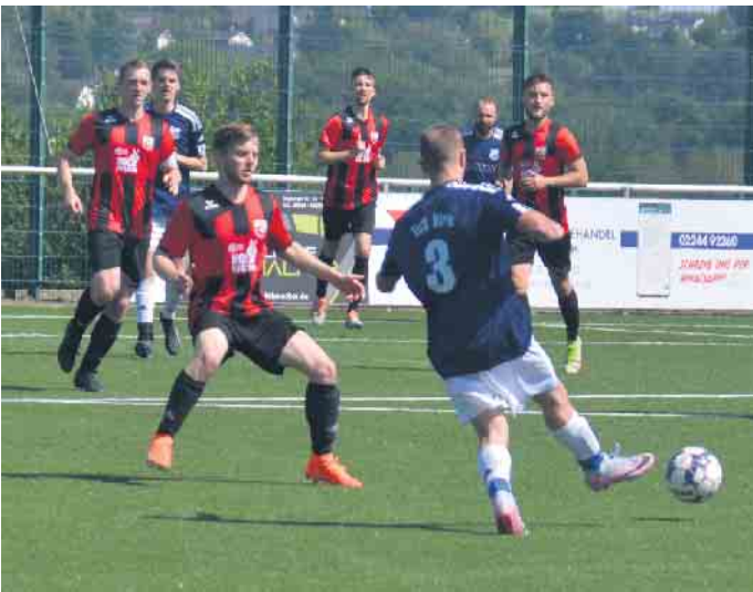
Die Herren III des TuS 05 konnte alle Angriffe der Gäste erfolgreich abwehren

Die dritte Mannschaft des TuS 05 Oberpleis gewinnt knapp mit 1:0 gegen TuS Birk II