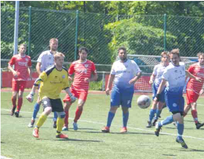
Im ersten Sonntagsspiel waren die Sportfreunde aufgrund ihrer zahlenmäßigen Unterlegenheit kaum ein ernsthafter Gegner

Punkte waren hier überaus wichtig. Doch gegen die Reserve des TuS Mondorf blieb diese Hoffnung unerfüllt. Mit 0:3 musste sich der Gastgeber geschlagen geben. Im Hinspiel konnten die SF Aegidienberg noch einen 2:1-Sieg sichern und damit die drei Punkte aus Mondorf mitnehmen. Zudem hagelte es in der Schlussphase gelbe und gelb-rote Karten für den Gastgeber. Erst zückte der Unparteiische vier gelbe Karten und kurz vor dem Abpfiff nochmals zwei gelb-rote Karten gegen die Sportfreunde. Bleibt nun abzuwarten, wie sich der SFA im Auswärtsspiel an diesem Wochenende schlägt. Er spielt gegen den Tabellenvorletzten, den SV Fortuna Müllekoven.