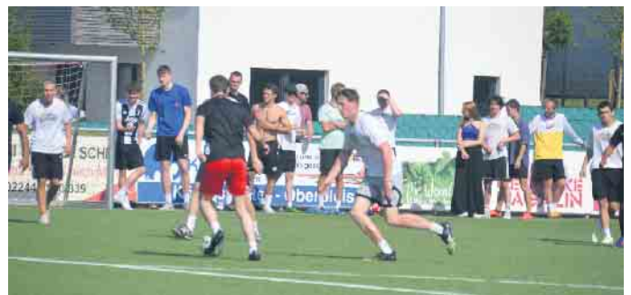
Es wurde quer auf jeweils zwei Feldern parallel gespielt, so bekamen die Zuschauer immer gleich zwei Partien zu sehen

bestand. Die sommerlichen Temperaturen taten im Laufe des Turniers ihr übriges hinzu und so stieg die Heiterkeit im Laufe der Veranstaltung von Spiel zu Spiel. Bereits gegen 10.30 Uhr startete das erste Spiel. Fünf Stunden später traten die Spitzenteams in der Finalrunde an. Wie es bei einem hochkarätigen Fußballturnier üblich, wurden Achtel-, Viertel- und Halbfinale ausgespielt. Am Ende standen sich der FC Bierkapitän und Harz am Ball im Spiel um Platz 3 gegenüber, wobei sich das beharzte Team durchsetzen konnte. Im alles entscheidenden Endspiel liefen der FC Steilhafen und die Galiaten 2.0 auf. Wie bereits im Spiel um Platz 3 fiel die Entscheidung hier auch erst im Elfmeterschießen. Mit 4:2 setzten sich die Galiaten 2:0 durch und ließen sich von der Zuschauerschar gebührend feiern. Ein feucht-fröhliches sportlich anspruchsvolles Turnier, dass nicht nur die Kondition sondern auch die Trinkfestigkeit auf die Probe stellte, fand mit dem sich anschließenden geselligen Beisammensein ein tolles Ende.