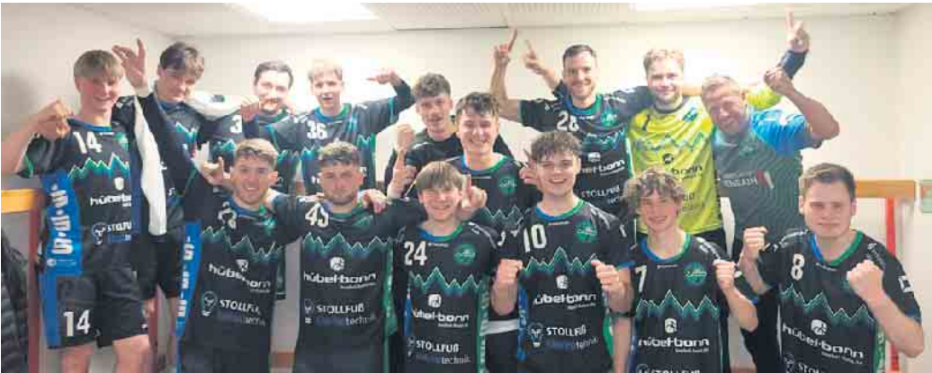
Das Landesliga-Team hat mit dem Sieg gegen Merkstein das Saisonziel perfekt gemacht

(bk) Oberpleis. Am vergangenen Samstag empfing die Reserve der HSG Siebengebirge im vorletzten Heimspiel der Landesliga-Saison 2023/2024 den Tabellennachbarn HSG Merkstein. Man hatte sich im Lager der Gastgeber aufgrund der Niederlage vom vergangenen Wochenende und der Hinspielniederlage bei den Merksteinern einiges vorgenommen. Darüber hinaus wollten die Königswinterer Handballer ihre starke Heimserie ausbauen und im Kalenderjahr 2024 weiterhin ohne Punktverlust am Oberpleiser Sonnenhügel bleiben. Doch leider wurde die Anfangsphase von den Grün-Blauen völlig verschlafen. Als HSG-Trainer Markus van Zuilekom gezwungen war, seine erste Auszeit zu nehmen, lagen die Hausherren bereits mit 2:6 zurück. Eine Umstellung in der Abwehr und einige personelle Veränderungen zeigten ihre Wirkung, wodurch die Hausherren nun deutlich besser im Spiel waren. Aus einem 2:6 Rückstand erspielte sich die junge HSG-Reserve eine 13:7