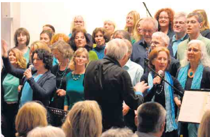
Zahlreiche Solo-Stimmen rundeten dieses Konzert ab