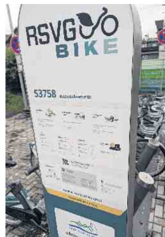
Die Errichtung von Leihrad-Stationen und Ladeinfrastruktur für Pedelecs gehört zu dem Aktionsprogramm

gen der überregionalen Netzplanung mit dem Kreis und dem Land im Austausch. Unterstützt wird diese Arbeit zudem durch eine intensive Fördermittelakquise, denn die Radmobilität leistet sowohl für die Mobilitätswende als auch für den Klimaschutz einen wichtigen Beitrag. Das Aktionsprogramm der Stadt Königswinter zielt darauf ab, die Bedingungen für den Radverkehr in der Stadt zu fördern und zu verbessern und umfasst eine Vielzahl von Maßnahmen. Die Stadt plant und führt verschiedene Bauprojekte durch, um die Infrastruktur für den Radverkehr zu verbessern. Dies umfasst z.B. den Ausbau und die Reparatur von Fahrradwegen oder auch die Errichtung von Abstellanlagen für Fahrräder.