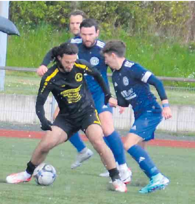
Umutspor machte den Sportfreunden das Laben schwer

ging es in die Halbzeitpause. Bevor ein weiteres Tor fiel zückte Schiedsrichter Peter Alexander Bachnik die Gelb-Rote Karte gegen einen Spieler der Gäste. Doch auch in Unterzahl blieben sie gefährlich. Mit seinem zweiten Treffer in diesem Spiel baute Mampuya die Führung von Umutspor in der 59. Minute auf 3:1 aus. Nur drei Minuten später gelang Tbias Clever der Anschlusstreffer zum 2:3. Marek Kalkan stellte für die Troisdorfer der alten Vorsprung wieder her und traf in der 77. Minute zum 4:2. In der 83. Minute der erneute Anschlusstreffer für die Sportfreunde. Max Mockenhaupt traf zum 3:4. Mit seinem dritten Tor in diesem Spiel erzielte Mampuya das 5:3 für die Gäste. Durch Ken Koten kamen die Aegidienberger wieder heran. In der 90. Minute stand es 4:5. Es ging in die Nachspielzeit und hier entschied sich letztendlich das Spiel. Nach zwei Toren durch Kalkan in der 93. und 97. Minute zum 7:4 war das Spiel gelaufen. Trotz Über-