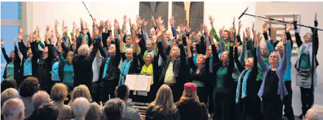
Der Gospelchor'n Joy - Lebensfreude - Klangverliebtheit und eine besondere Ausstrahlung