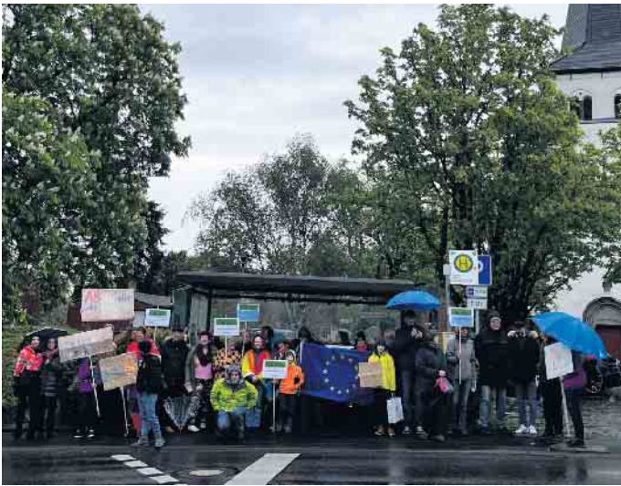
Der Regen hielt sie nicht ab: Wie hier in Stieldorf versammelten sich am vergangenen Freitag auch in Eudenbach, Ittenbach und Niederdollendorf zahlreiche Bürgerinnen und Bürger, um für Menschenrechte und Demokratie Flagge zu zeigen