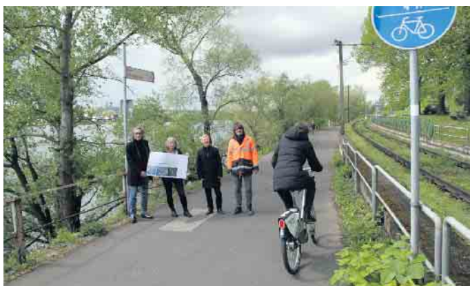
Der alte Rheinradweg zwischen Bad Honnef und Königswinter ist in die Jahre gekommen und wird nun komplett neu gebaut.

Wirtschaft und Klimaschutz sowohl die Bedeutung des Weges als auch die baulichen und finanziellen Herausforderungen geteilt hat“, betont Bürgermeister Otto Neuhoﬀ: „Im Rahmen der nationalen Klimaschutz-Initiative wird der Neubau des Radwegs als Teil unseres Projektes „Unterwegs nach Rad Honnef“ öffentlich gefördert.“ Die Sanierungskosten betragen aufgrund der technischen und organisatorischen Herausforderungen rund 1.964.000 Millionen Euro. 1.172.745 Euro werden über Fördermittel finanziert. Sofern nicht zu viele Hochwasser den Baufortschritt gefährden, ist die Eröffnung des Weges im Januar 2025 geplant.