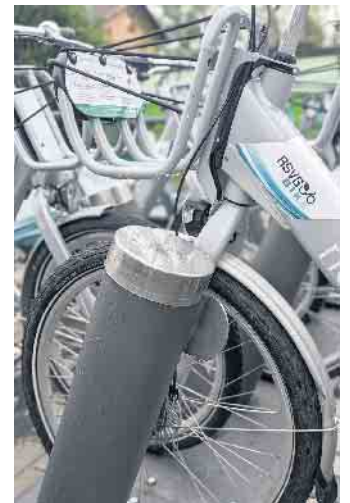
Die Stadt Königswinter freut sich über eine rege Nutzung der E-Bikes

Die Anzahl der Stationen soll über die bisher eingerichteten fünf Stationen hinaus erhöht werden. Die Verwaltung prüft derzeit mögliche weitere Stationen am Bahnhof Longenburg sowie im Bereich Sea-Life/Fähre und an der Fähre Niederdollendorf.