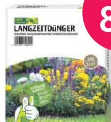
LANGZEITDÜNGER grün erleben | langanhaltende Nährstoffversorgung | 1 kg

*Angebote gültig 26.04.–02.05.2024, solange der Vorrat reicht. Pflanzen Breuer e.K. HENNEF Emil-Langen-Straße 6 . Tel.: 0 22 42/91 55 40 Pflanzen Breuer e.K. SANKT AUGUSTIN Am Apfelbäumchen 1 . Tel.: 0 22 41/31 57 77 Mo.–Fr. 9:00–19:00 Uhr . Sa. 9:00–18:00 Uhr . So. + Feiertage 11:00–16:00 Uhr** (**Kein Verkauf von Möbeln/Geräten.) www.pflanzen-breuer.de