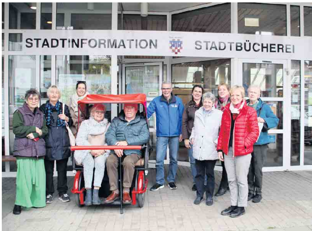
Die ehrenamtlichen Mitarbeiterinnen und Mitarbeiter der Stadtinformation testeten die Fahrradrickscha des Vereins „Radeln ohne Alter“.

Wer die Stadt, ihre Sehenswürdigkeiten und die Historie entdecken will, erhält hierzu umfangreiche Informationen in der Stadtinformation im Rathaus. Deren ehrenamtliche Mitarbeiterinnen und Mitarbeiter hatten nun die Gelegenheit, das besondere Angebot der Fahrradrickscha kennen zu lernen.