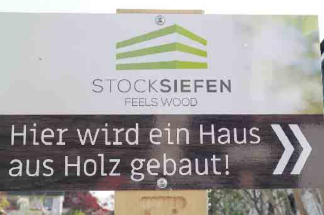
Wegweiser führten ans Ziel

bereits in der Produktionshalle vorgefertigt werden. Sie werden dann auf der Baustelle nur noch zusammengefügt. Eine Zeiterparnis die auch Geld spart. Nach Aussage der Fachleute hat sich auch der Holzpreis, der über mehrere Monate in die Höhe geschossen war, wieder stabilisiert und ist wieder ein auf normales Niveau gesunken. Außerdem sind Einsparmöglichkeiten durch Eigenleistungen möglich. Gerne berät die Firma Stocksiefen zukünftige „Häuslebauer“ über Einsparpotentiale. Bei Beratung und Besichtigung vereinbaren Sie unter 0228 - 3388 380 bzw. kontakt@feelswood.de einen Termin.