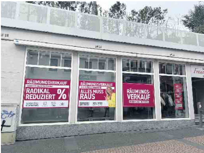
Bald heißt es „Es war einmal“ - das Frauenzimmer schließt seine Türen

auf den sozialen Medien abonniert werden oder sprechen Sie uns gerne persönlich an. Wir freuen uns auf die Kundschaft“, so Faller. In Oberpleis kann man zudem kostenlos in der darunter liegenden Tiefgarage parken. Nun muss in Bad Honnef alles bis Ende Juni raus. Deshalb gibt es dort satte Rabatte und viel Neues aus der aktuellen Sommerkollektion. Das Team freut sich auf die Kundschaft in der Filiale „Das Frauenzimmer“ in Bad Honnef, Markt 12. Kontakt kann unter der Rufnummer 02224-1222244 aufgenommen werden.