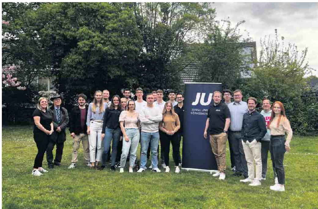
Mitgliederversammlung der JU Königswinter