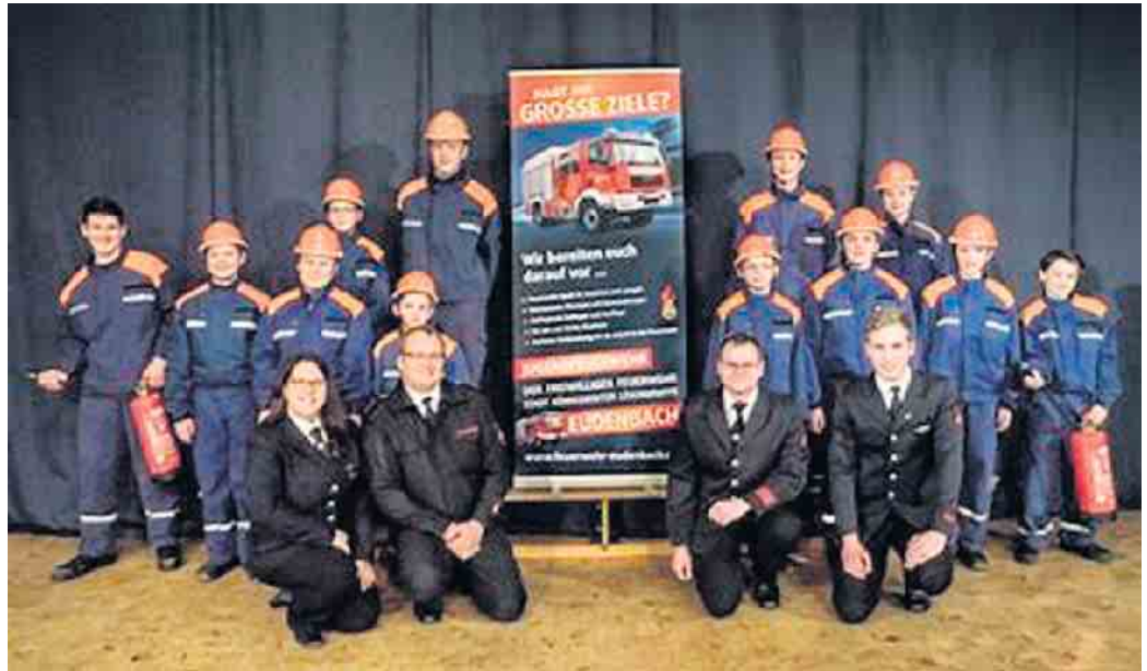
Die Jugend ist fester Bestandteil der Eudenbacher Feuerwehr.

(bk) Eudenbach. Die Freiwillige Feuerwehr Stadt Königswinter LG Eudenbach lädt wie jedes Jahr zum Schnuppernachmittag ein, der diesmal am 6. Mai stattfindet. Der Musikzug stellt sich gemeinsam mit der Jugendfeuerwehr interessierten Besucher*innen vor und ermöglicht das Schnuppern an Instrument und Strahlrohr. Dazu öffnet das Feuerwehrhaus in Eudenbach von 15 bis 17 Uhr seine Türen. Die Veranstaltung wird um 15 Uhr durch das Jugendorchester des Musikzuges eröffnet, welches einen Einblick in seine Probenarbeit geben wird. Um ca. 16 Uhr zeigt dann die Jugendfeuerwehr in einer spannenden Show-Übung ihr Können. Alle Interessenten haben die Möglichkeit, Instrumente kennenzulernen und direkt vor Ort auszuprobieren. Aus jedem Register stehen Musiker*innen beratend zur Seite und unterstützen bei Handhabung und Auswahl des richtigen Instrumentes. Außerdem werden Lehrer*innen und