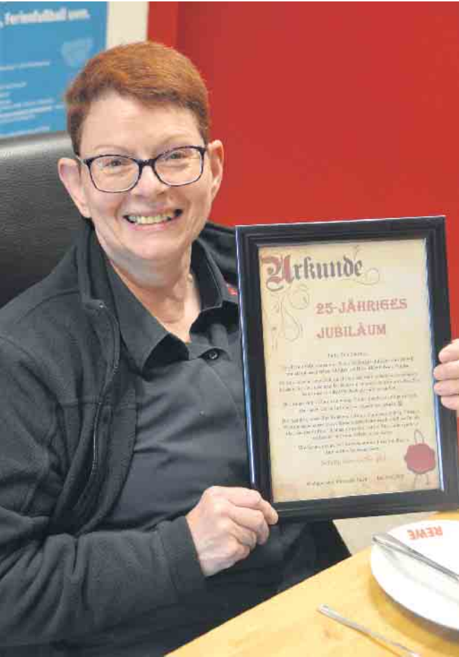
Eine Urkunde drückte den Dank der Marktleitung aus