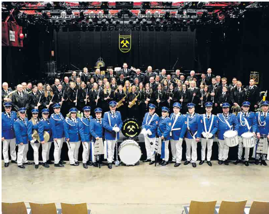
Beide Kapellen stellten sich zum Gruppenbild.