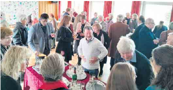
Es war viel los beim anschließenden Empfang im Gemeindehaus