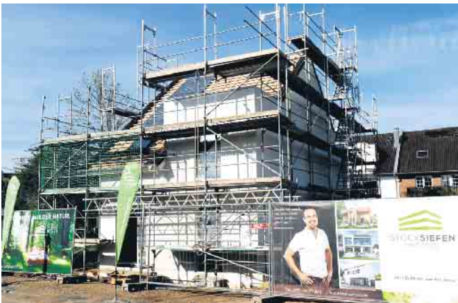
Das Besichtigungs-Objekt in Troisdorf-Bergheim