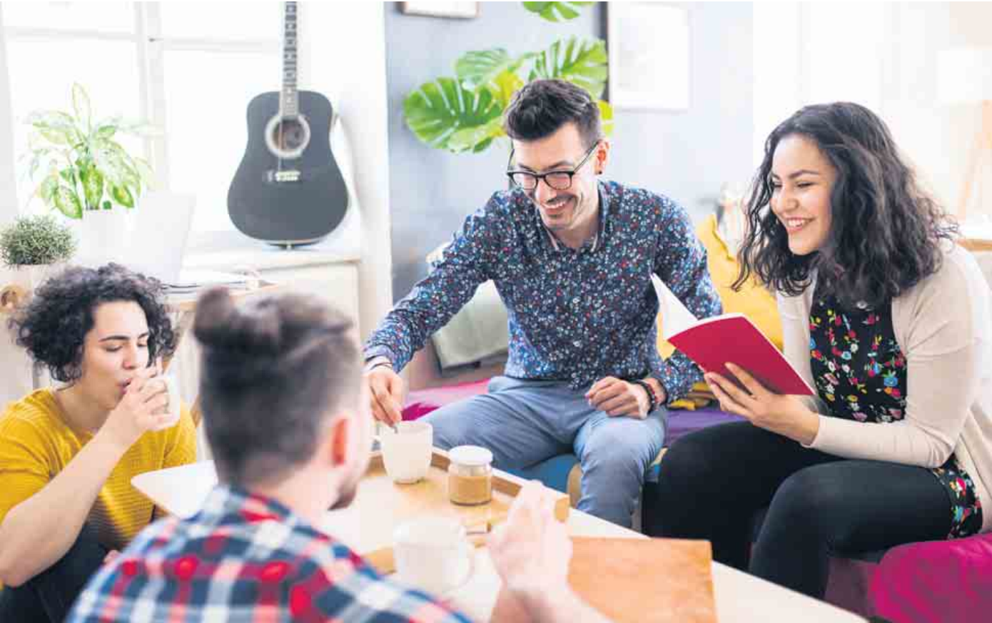
So geht's: Wohneigentum mit netten Leuten vorausschauend planen und kreativ gestalten

Die Immobilienpreise in den Städten steigen auch in CoronaZeiten weiter. Wer seinen Traum von den eigenen vier Wänden realisieren möchte, braucht neue Ideen. Zum Beispiel: Freunde tun sich für einen Immobilienkauf zusammen und teilen die Anschaffungskosten. Ein solches Projekt braucht allerdings klare vertragliche Regelungen. Mit befreundeten Familien in ei-