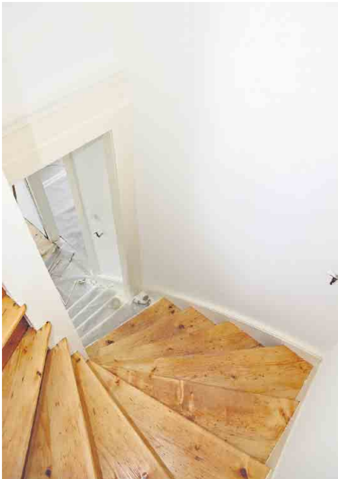
Experten und deren Gutachten helfen dabei, den Zustand einer älteren Immobilie und den Aufwand für ihre Sanierung zu planen.

verschaffen sich Kaufinteressenten mehr Sicherheit. Dazu bekommen sie eine solide Grundlage für die Einschätzung der zu erwartenden Sanierungs- und Modernisierungskosten. Seriöse Verkäufer oder Makler werden einer solchen Begehung zustimmen. Wenn nicht, rät BSB-Sprecher Stange zu Vorsicht, da der Anbieter möglicherweise bewusst Schwächen des Gebäudes verbergen möchte. (djd)