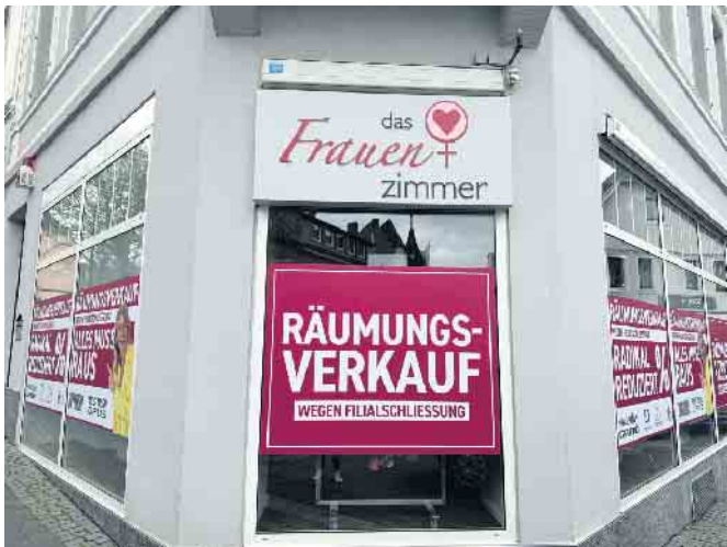
Das Frauenzimmer in Bad Honnef lädt zum Räumungsverkauf ein

wunderschöne Zeit in Bad Honnef. Danke an alle Kunden für Ihre Treue und lieben Worte. Ich hoffe, Sie kommen uns alle in Oberpleis im Frauenzimmer besuchen.“ Dort ist das Inhabergeführte Modehaus an der Dollendorfer Straße für die Kunden*innen durch ein engagiertes Team mit Leidenschaft und Überzeugung seit über 21 Jahren tätig. Hier findet man aktuelle Trends, ausgesuchte Marken und vor allem eine persönliche Beratung durch erfahrene Mitarbeiter*innen. „Für aktuelle Infos, Neuheiten und Angebote können gerne unsere Kanäle