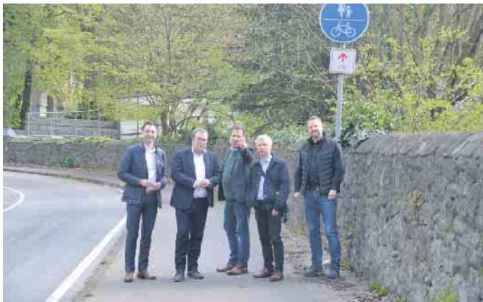
Im Beisein der Landtagsabgeordneten aus der Region wurde über die Fahrradwegesituation diskutiert