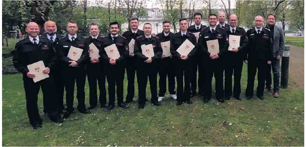
Stiftungsfest der Feuerwehr in Niederdollendorf