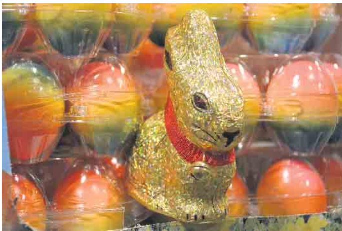
In der Nähe der Ostereier fühlen sich die goldenen Hasen besonders wohl