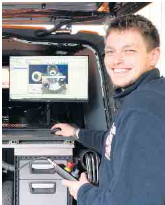
Nach einer erfolgreichen Ausbildung bieten sich vielfältige Weiterbildungs- und Karrieremöglichkeiten.