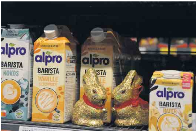
Viele Verstecke bieten den Osterhasen in der Regalen einen Unterschlupf - die Suche wird sicherlich nicht einfach

lung verschiedenste Artikel, die sonst nur in Biofachgeschäften zu finden sind. An der Servicetheke eine große Auswahl an verschiedensten Fleisch-, Käse-, Wurstsorten, serviert durch hochqualifizierte Mitarbeiter. Die Kühltheke hält eine riesige Auswahl an verschiedenen Fleisch-, Wurst-, Käse-, und Buttersorten, sowie ein breites Joghurtsortiment, darunter sehr viele Landliebe Variationen und auch Quark- und Milchsorten vor. In der Weinabteilung bietet der REWE-Markt neben zahlreichen deutschen Weinen eine große Auswahl an Weinen aus verschiedenen Ländern, wie zum Beispiel