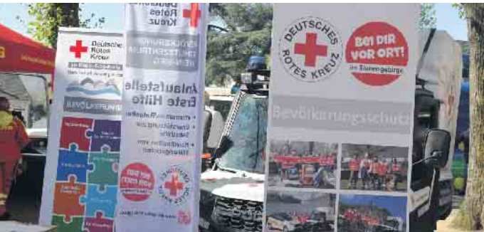
Auch das Deutsche Rote Kreuz präsentierte sich in Bad Honnef