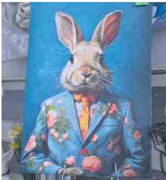
Der Osterhase lässt im Baumarkt Klein herzlich grüßen und lädt ein, das umfassende Sortiment kennen zu lernen