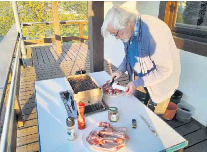
Grillen der Lammkoteletts - klein aber fein!

Zum 43. Mal wurde im Evangelischen GKirchengemeinde Siebengebirge, Bereich Oberpleis, gemeimnsam gekocht