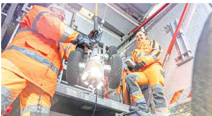
Hightech im Kanal: Ferngesteuerte Kameraroboter liefern scharfe Bilder, die anschließend mit KI-Unterstützung ausgewertet werden.