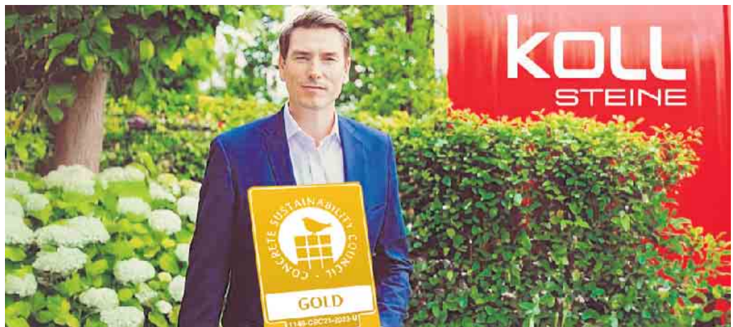
Ausgezeichnet für verantwortungsbewusste Produktion: KOLL Steine erhält Gold-Zertifikat