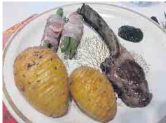
Leckeres Essen mit kulinarischem Neuland: Minzsauce

schmeckte es hervorragend, auch die britische Minzsauce, die für fast alle eine kulinarische Premiere gewesen ist. Weiter geht es am 7. Mai ab 19 Uhr mit dem dann 44. Kochabend zum Thema: Ein kulinarischer Besuch in Tirol mit Käseespätzle, Kaspressknödel und Kaiserschmarrn. Sie möchten dabei sein? Dann bitte unter kai.zielke@ekir.de anmelden. Für maximal zehn Teilnehmende haben wird Platz in der Oberpleiser Küche.