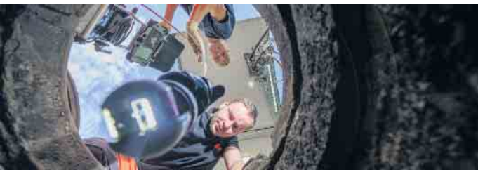
Gefragte Experten: Umwelttechnologen für Rohrleitungsnetze und Industrieanlagen kümmern sich um intakte Abwassersysteme.

das sind gut 15 Erdumrundungen, misst die Kanalisation allein in Deutschland. Zusammen mit rund 10.000 Kläranlagen sowie unzähligen Schächten und Anschlüssen zählt dieses Netz zu den wichtigsten Infrastrukturen des Landes. Verantwortlich für den ein-