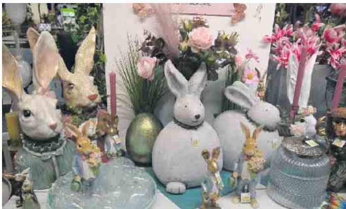
Osterhasen in vielen Formen und Farben warten darauf, ihr Zuhause verschönern zu können