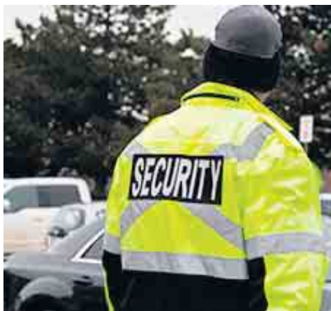
Revier-, Kontroll- und Streifendienste werden von KTD Night & Day angeboten.

auf den Weg zum Objekt und führt dort eine Kontrolle durch. Bei Einbruch wird das Objekt gesichert, die Polizei alarmiert und nach Rücksprache mit dem Eigentümer weitere Maßnahmen, wie eine Notverglasung, eingeleitet. Ein 30-jähriges Unternehmensjubiläum ruft nach einer entsprechenden Jubiläumsfeier. „Wir haben unsere Möglichkeiten, gemeinsam mit unseren Mitarbeitern zu feiern, abgewägt“, so die Jungheims, „Aufgrund unseres 24-Stunden-Service ist eine gemeinsame Feier nahezu ausgeschlossen, da alle niemals vollständig verfügbar sind und wir niemanden, der gerade im Einsatz ist, ausschließen wollen. Wir werden jedoch einen Weg finden, um für die großartige Verbundenheit zu KTD unseren Mitarbeitern über all die Jahre, Danke sagen zu können. Es wird noch eine Überraschung für das Team geben - wir arbeiten daran.“