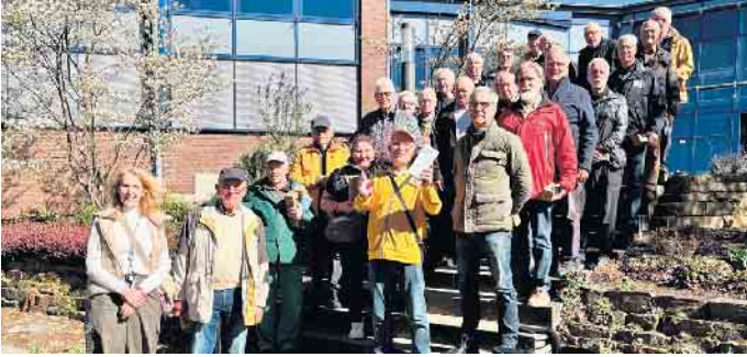
Gute Stimmung bei allen Teilnehmern

Montagstreff zu Besuch beim Wahnbachtalsperrenverband