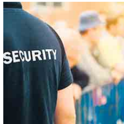
Auch bei Veranstaltungen und im Eventschutz kommen die Mitarbeiter von KTD Day & Night zum Einsatz.