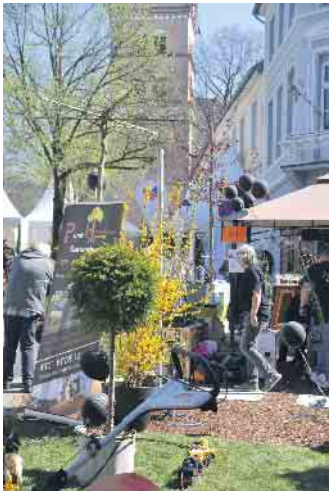
Zur Eröffnung des Frühlingsmarktes hatten sich bereits zahlreiche Gäste eingefunden