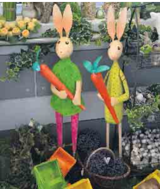
„Wir warten darauf, einen Liebhaber oder eine Liebhaberin zu finden“ - so geht es manchem Ausstellungstück des Baumarktes in Oberpleis

(bk) Oberpleis. Die passende Dekoration findet an Ostern nicht nur auf dem Esstisch, sondern auch im Eingangsbereich oder an anderen Stellen im Haus Platz. Entdecken sie die vielfältige Auswahl an Osterdekorationen im Baumarkt Klein. Das Sortiment umfasst lebendige Osterartikel in verschiedenen Farben und Formen, von klassischen Osterhasen bis hin zu modern gestalteten Ostereiern. Diese Dekorationen sind ideal, um das perfekte Osterambiente für Wohnzimmer, Küche oder Garten zu realisieren. So eignen sich Deko-Eier hervorragend für die Gestaltung von Osterkränzen, als Teil von Tischdekorationen oder einfach zum Verstecken im Garten. Jedes Ei ist ein klei-