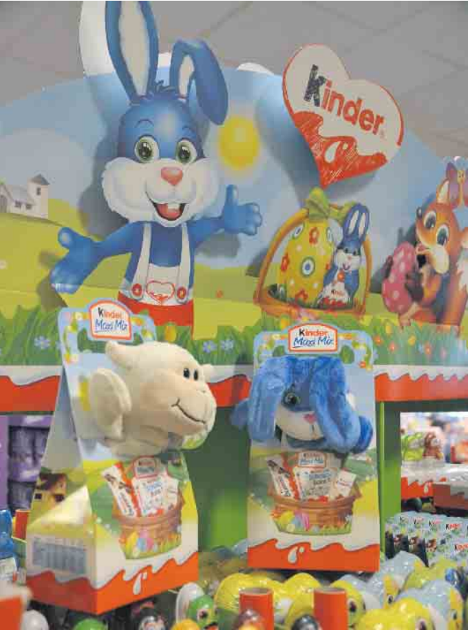
Der REWE-Markt in Thomasberg lädt an Ostersonntag zur Hasensuche ein