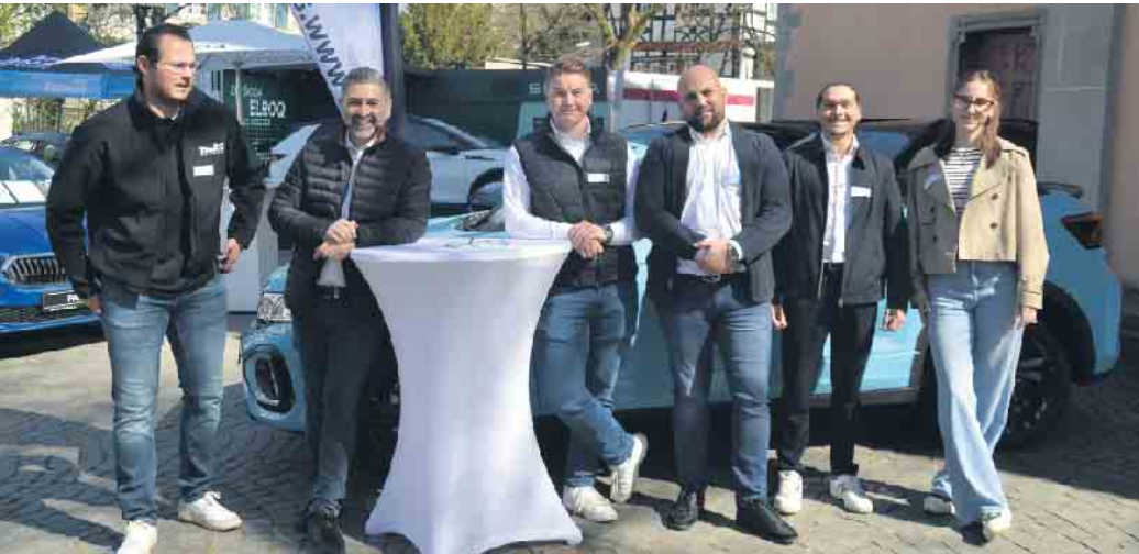
Auch die Firmengruppe Auto Thomas stellte ihre Fahrzeuge auf dem Marktgelände aus

In der Bad Honnefer Fußgängerzone und dem Bereich rund um den Kirchplatz spielte sich ein reges Markttreiben ab