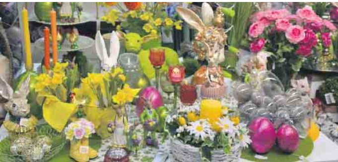
Ein bunter Tisch mit allerlei Anregungen für den passenden Osterschmuck

Der Baumarkt Klein in Oberpleis lädt ein, in der Osterausstellung zu stöbern