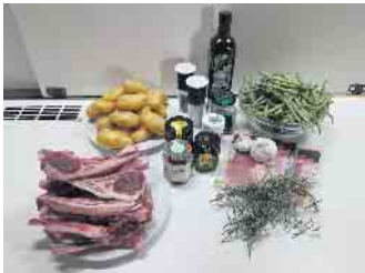
Kochen aus frischen Zutaten

dem Ofen, Bohnen im Speckmantel, britische Minzsauce und natürlich wieder mit der selbstgemachten Roten Grütze als Nachtisch. Zeitlich ausschlaggebender Faktor waren die Fächerkartoffeln, die 45 Minuten im Ofen garen mussten. Aber die Zusammenarbeit aller Kochbereiche lief hervorragend. Auf der Terrasse wurden die Lammkoteletts gegrillt oder in der Pfanne in der Küche gebraten, die Fächerkartoffeln garten im Ofen und die Bohnen konnten nebenbei gekocht und dann noch mit dem Sprek angebraten werden. Nach etwa einer Stunde gab es ein tolles gemeinsames Essen. Allen acht Teilnehmenden