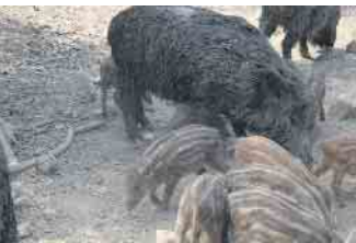
Im Frühling bekommen Wildtiere und Wildvögel ihren Nachwuchs.

Tierschutz Siebengebirge appelliert an Hundehalter, Auto- und Motorradfahrer