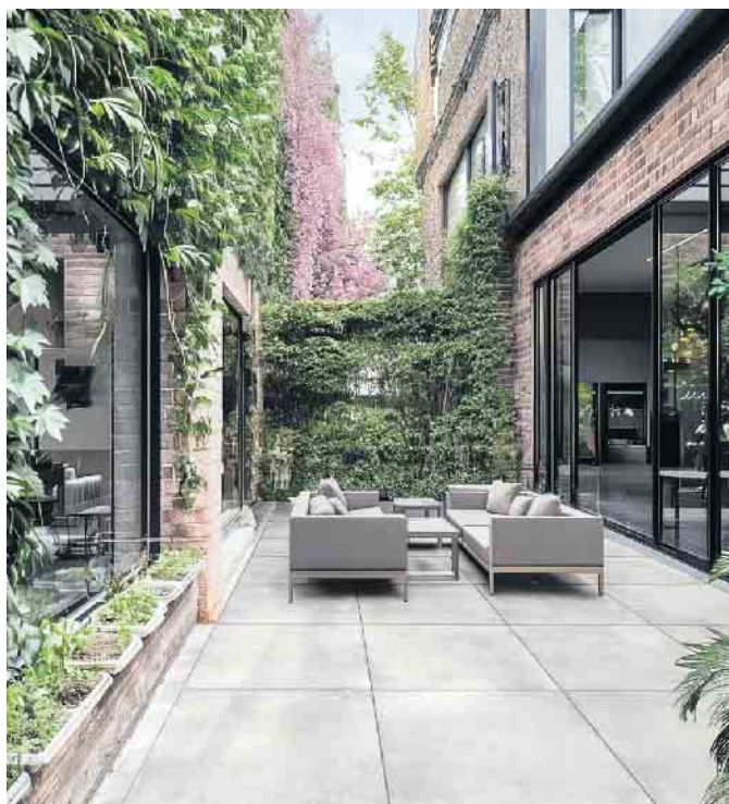
Verleihen dem Außenbereich urbanen Chic: PUREA®-Platten im Format 90x90 cm in Concrete Grey