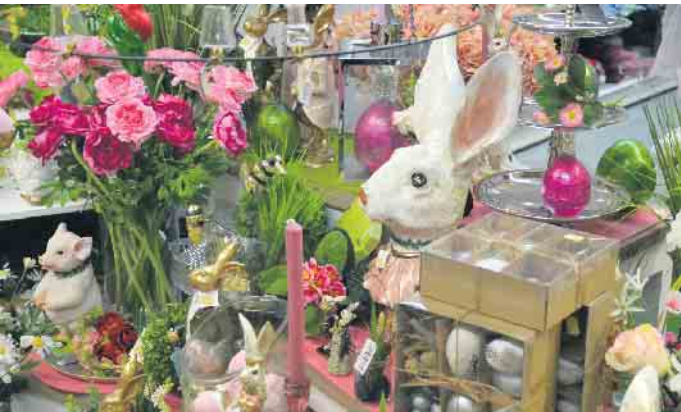
Bunte Farben gehören zu jedem Osterfest, die Ausstellung in der Brückenviese in Oberpleis gibt Anregungen für die Gestaltung von Haus und Garten

Ergänzung zu jedem Osterfest dar. Ob als zentrales Element des Osterbrunches, als freundlicher Empfang an der Haustüre oder als verspielte Dekoration im Kinderzimmer - die Osterhasen und vieles mehr bringen Frühlingsstimmung und Festlichkeit in jedes Zuhause. Die Aufzählung der ausgestellten Osterartikel im Baumarkt in Oberpleis, In der Brückenviese 9 - 13, könnte noch weitere Zeilen füllen. Ein Tipp - einfach einmal vorbei schauen und sich von dem umfassenden Ostersortiment überraschen lassen.