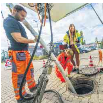
Der Einsatz der Kanaltechnik erfordert umfassende Fachkenntnisse, die während der dreijährigen Berufsausbildung vermittelt werden.

bundesweit mit einer fundierten dreijährigen Ausbildung möglich. Mit einem „Kanalreiniger“ von früher hat der heutige Beruf nichts mehr zu tun: Die Umwelttechnologen untersuchen Rohre und Kanäle mit hochauflösenden Kameras und KI-Unterstützung, legen 3D-Pläne an, dirigieren Roboter durch das Netz und bedienen millionenteure Spül- und Saugfahrzeuge. Auf diese Weise sorgen sie dafür, dass Kanäle, Schächte und Anschlüsse stets intakt sind. Ebenso helfen sie bei Abfluss-Problemen in privaten Haushalten und schützen mit ihrer Arbeit die Umwelt. Hightech in Form ferngesteuerter Gerätschaften kommt beispielsweise auch bei Ausbesserungsarbeiten zum Einsatz.