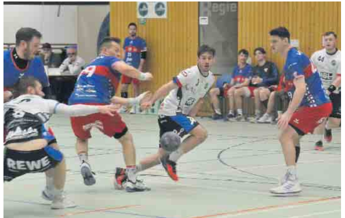
Auch wenn das gegnerische Tor anvisiert war, nicht jeder Wurf des Gastgebers führte zum Erfolg

(bk) Oberpleis. Vor dem Osterwochenende war der MTV Köln 1850 zu Gast in der Sunshine-Arena. Mit einem Sieg wollten die Grün-Blauen am 1. April wieder in die Erfolgsspur zurückkehren, um den Traum vom Klassenerhalt noch zu ermöglichen. Der MTV Köln war nach dem TuS Königsdorf die nächste Mannschaft aus der oberen Tabellenhälfte und hat somit schon lange nichts mehr mit dem Abstiegskampf zu tun. Der MTV spielte bislang eine starke Rückrunde und musste sich nur dem Tabellenführer und Aufsteiger BTB Aachen 2 geschlagen geben. Im Hinspiel hatten die Grün-Blauen die Kölner am Rande der Niederlage, mussten sich aber am Ende doch mit 20:22 geschlagen geben. Diesmal wollte man es besser machen und zwei wichtige Punkte im Siebengebirge behalten. „An das Hinspiel kann ich