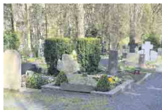
Die Grabsteine, wie hier auf dem Friedhof in Oberpleis, werden auf ihre Standfestigkeit hin, überprüft