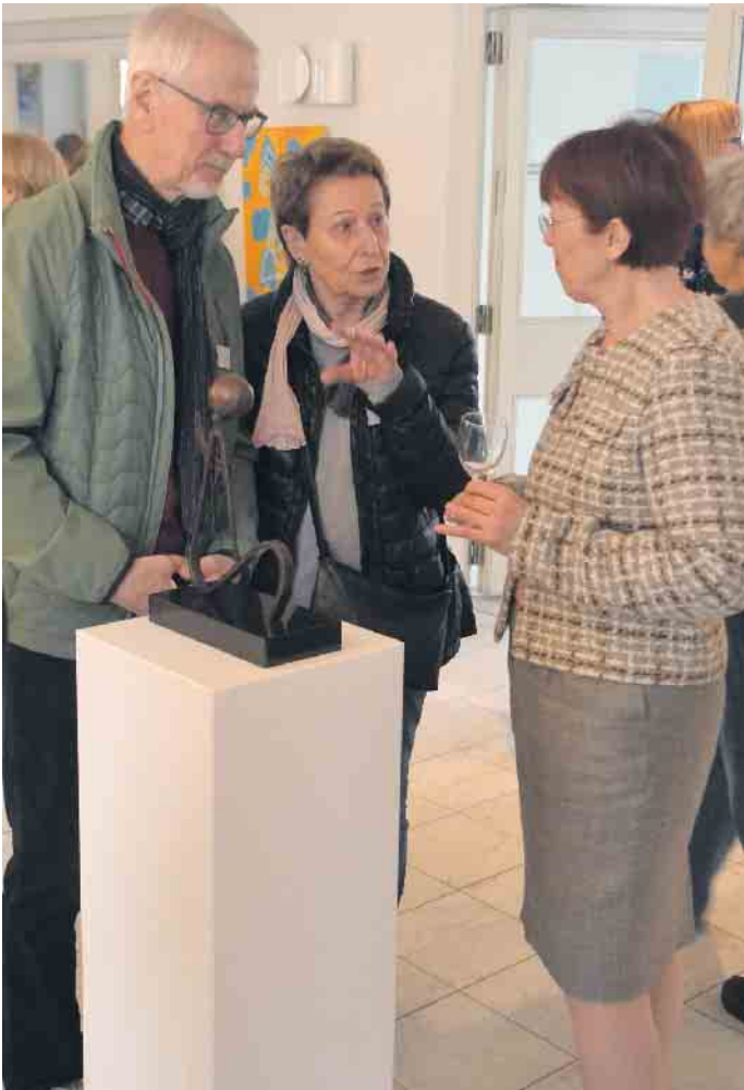
Die Kunstschaffenden standen auf der Vernissage zu Gesprächen über ihr Wirken zur Verfügung

Die Künstler*innen haben sich in jedem Werk jeweils auf eine Interpretation des Schwerelosen konzentriert. Schwerelosigkeit im All ist genauso vertreten wie Darstellungen von Leichtigkeit, schwebenden Dingen und das Loswerden von Schwere. Viele Bilder und Objekte erzählen ihre eigenen Geschichten.