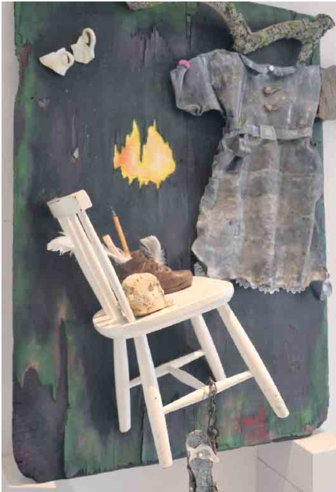
Zahlreiche Werke zu dem Thema „Schwerelos“ sind in Haus Bachem zu sehen

(bk) Königswinter. Die Gemeinschaft Königswinterer Künstler und Künstlerinnen (GKK) zeigt wieder eine Ausstellung im Haus Bachem in der königswinterer Altstadt. Das Thema lautet diesmal „schwerelos“. Zu sehen sind Werke von 15 Künstlern und Künstlerinnen in Form von Malerei und Objekten.