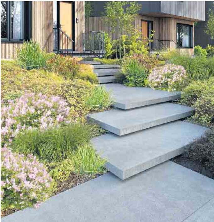
EXEO®-Elemente eignen sich nicht nur als Terrassenbelag, sondern auch für die Gestaltung von Hauseingängen und Stufenanlagen.