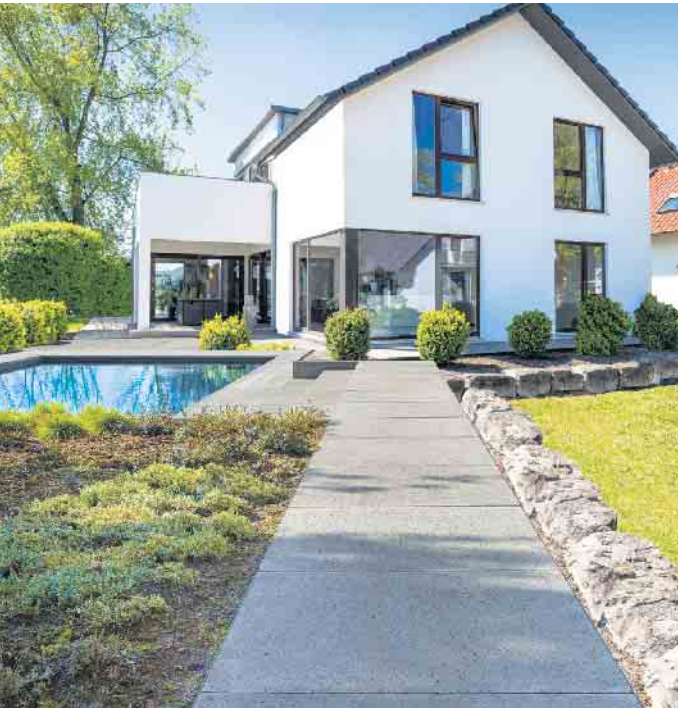
EXEO®-Platten im Megaformat können direkt im Splittbett verlegt werden. Die großzügigen Flächen punkten mit einem geringen Fugen- anteil.

einfach und kostengünstig direkt im Splittbett verlegt werden. Der geringe Fugenanteil der Flächen sorgt on top dafür, dass sogar klei- ne Terrassen einen offenen, groß- zügigen Charakter erhalten. Wei- tere Informationen zu den design- starken EXEO®-Elementen und den vielseitigen Gestaltungsmög- lichkeiten erhalten Interessierte unter www.koll-steine.de/exeo-platten .