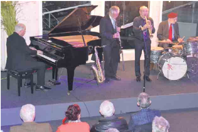
„The International Trio“ trat nach 2019 erneut bei Coppeneur auf

Es steht für dieses Jahr bei Coppeneur ein neues Musikkonzept für die Konzertreihe „Klassik zu Gast bei Coppeneur“ auf dem Pro-