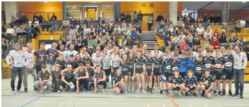
Die Mannschaften der HSG Siebengebirge setzten vor dem Oberliga-Spiel ein Zeichen gegen Rassismus