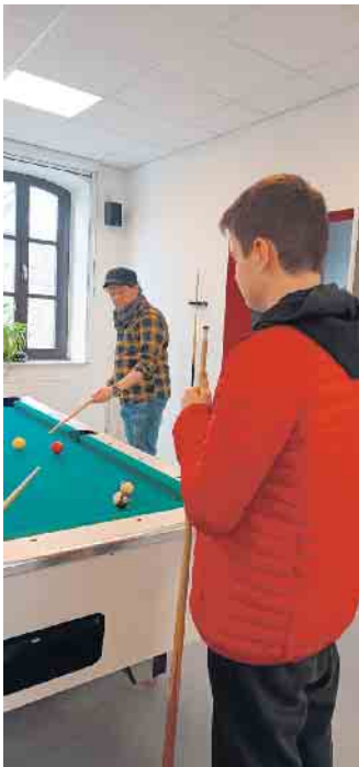
Auch der Billardtisch begeisterte die Jugendlichen

sche Sprache zu erlernen“, so die Pädagogin, „Ein solches Freizeitangebot, wie hier im Haus der Jugend, kann für diesen Prozess nur förderlich sein. Die Jugendlichen kommen mit deutschsprachigen Jungen und Mädchen in Kontakt und können ihr Erlerntes praxisorientiert vertiefen. Darüber hinaus können hier Freundschaften entstehen, die den Integrationsprozess stärken.“