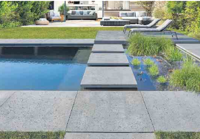
Passen optimal in moderne, puristische Outdoor-Bereiche: EXEO®-Elemente in designstarker Basaltlava-Optik.

Megaformate in Basaltlava-Optik sind im Außenbereich vielseitig einsetzbar