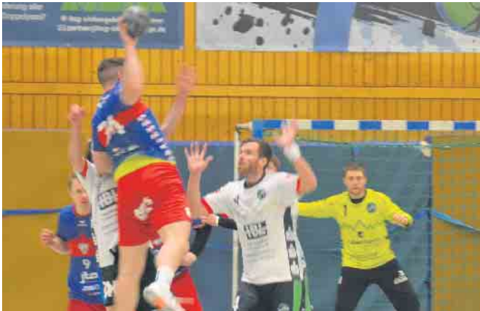
Die MTV-Reserve überspielte die Abwehr der HSG ein über das andere Mal

HSG-Reserve verliert das „Duell der Zweiten“ gegen MTV Köln 1850