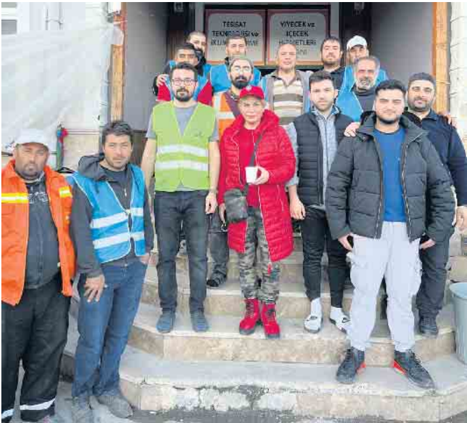
Ein starkes Team - die Helfer und Helferinnen nehmen sich der Erdbebenbeschädigten in der Türkei und Syrien an