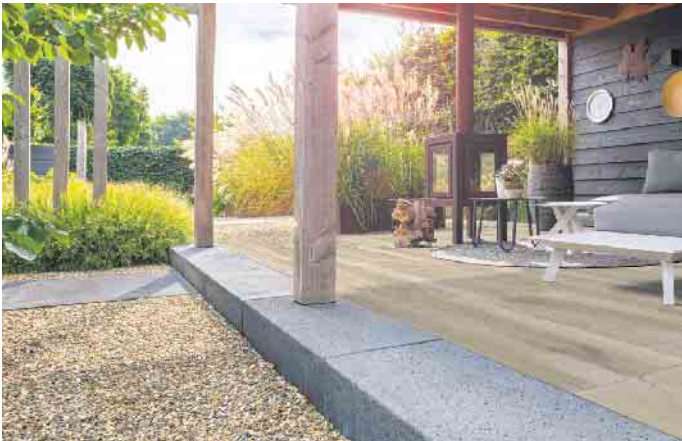
Tolle Kombi: EXEO®-Stufen und PURITY®-Feinsteinzeugplatten - hier im Farbton Nature Brown - in edler Holzoptik.

tigt, sieht jedoch aus wie echtes, jahrtausendaltes Vulkangestein. Die Oberfläche der EXEO®-Ele- mente erinnert an die offenporige Struktur von Basaltlava und er- zeugt Flächen von einzigartiger Natürlichkeit, die den Außenbe- reich enorm aufpeppen. Die Me- gaformate von bis zu 200 x 100 x 10 cm bei Platten und Schwebes- tufen ermöglichen viel kreativen Spielraum - nicht nur beim Ter-