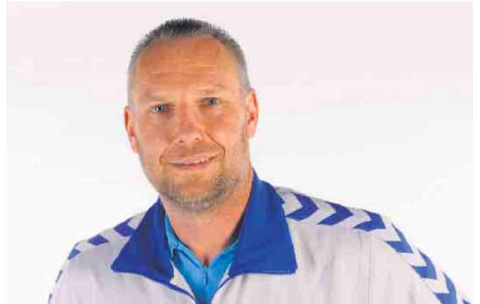
Handball-Weltmeister Christian „Blacky“ Schwarzer trainiert mit den Handball-Talenten am Oberpleiser Sonnenhügel und gibt den Jugendlichen viele wertvolle Tipps.

Die Nachwuchstalente trainieren in ihren jeweiligen Altersklassen 90 Minuten pro Tag. Am Freitag finden die Einheiten im Zeitraum 13:00-18:00 Uhr statt, an den Wochenendtagen jeweils zwischen 10:00 Uhr und 15:30 Uhr. Eltern und Zuschauer sind jederzeit eingeladen, während der öffentlichen Trainingseinheiten in der Halle vorbeizuschauen. Auch Trainerinnen und Trainer, insbesondere aus dem Nachwuchsbereich, sind herzlich willkommen, um sich bei diesem neuen Format der HSG Siebengebirge neue Trainingsimpulse von Christian „Blacky“ Schwarzer, dem ehemaligen Profihandballer