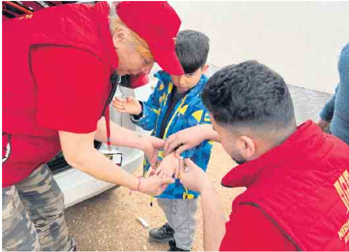
Auch vor Ort wurde Hilfe geleistet, wie hier bei diesem Jungen