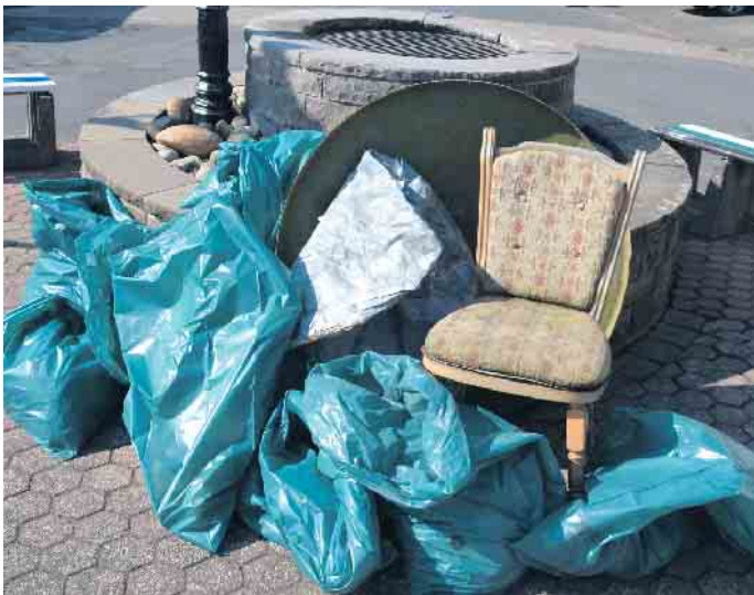
In Rauschendorf türmte sich der Müll zur Abholung durch den Baubetriebshof auf dem Platz vor der Kapelle

Oberpleis stellte auf Anfrage die benötigten Müllsäcke, Arbeitshandschuhe und Greifzangen zur Verfügung und holte nach Abschluss der Aktion das Gesammelte ab.