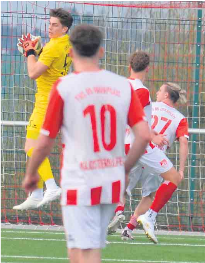
Die Abwehr des Gastgeber vereitelte jeden Deutzer Angriff