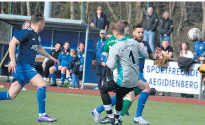
Die Abwehr des Gastebbers stand und ließ kein Gegentor zu