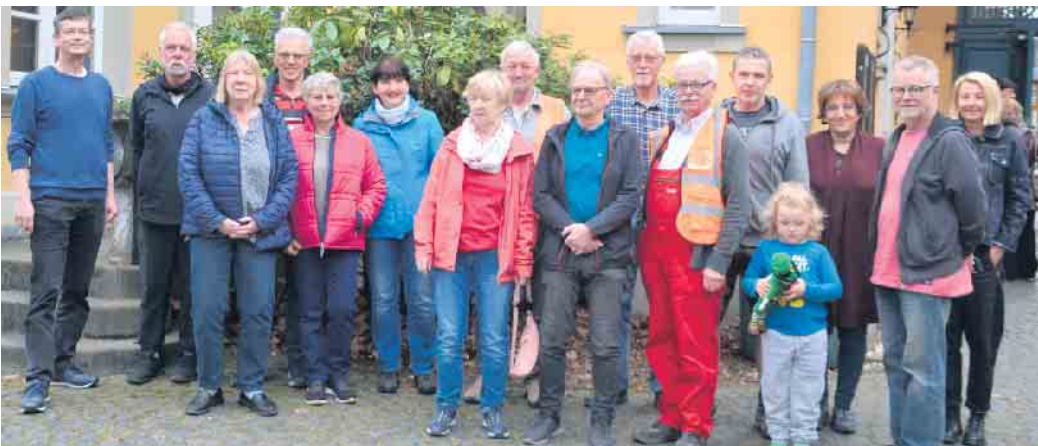
Zu einem gemeinsamen Frühstück traf man sich in Thomasberg und Heisterbacherrott nach getaner Arbeit in Haus Schlesien