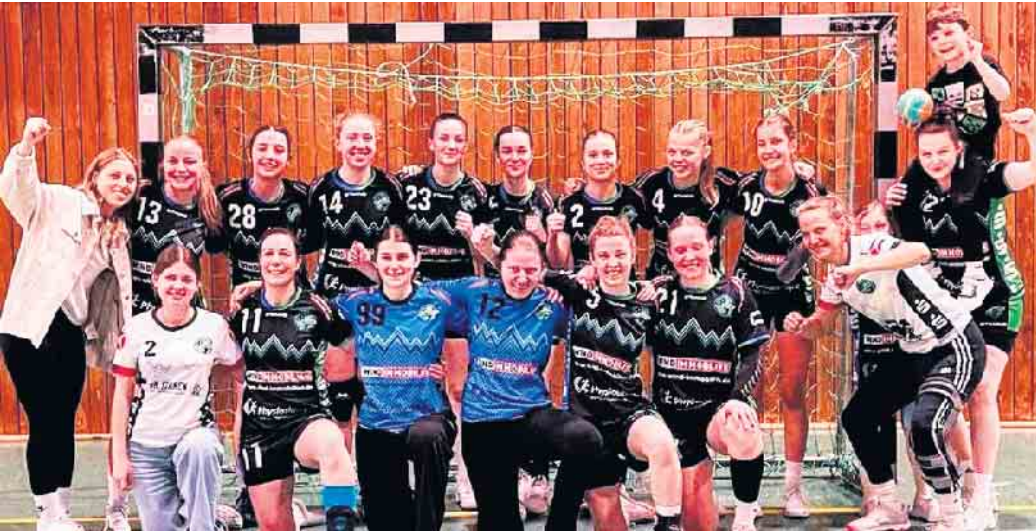
Die HSG-Damen machten die Hinspielfeite wett und gewannen das Rückspiel gegen Niederpleis