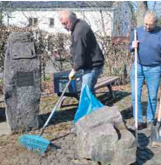
Auch die Fläche rundum den Gedenkstein der ehemaligen Oelinghoner Mühle wurde gereinigt

(bk) Königswinter. Die beliebte traditionelle Reinigungsaktion „Frühjahrsputz“ fand in diesem Jahr in der Zeit vom 15. bis zum