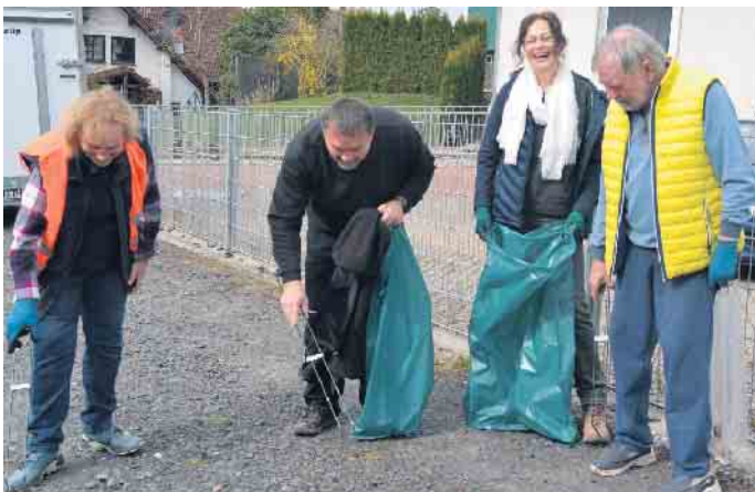
Der Verein „Fröhliches Frohnhardt“ hatte im Ort zu der Sammelaktion aufgerufen

Mitgliederversammlung des Vereins der Freunde und Förderer der Katholischen Grundschule Oberpleis e.V.