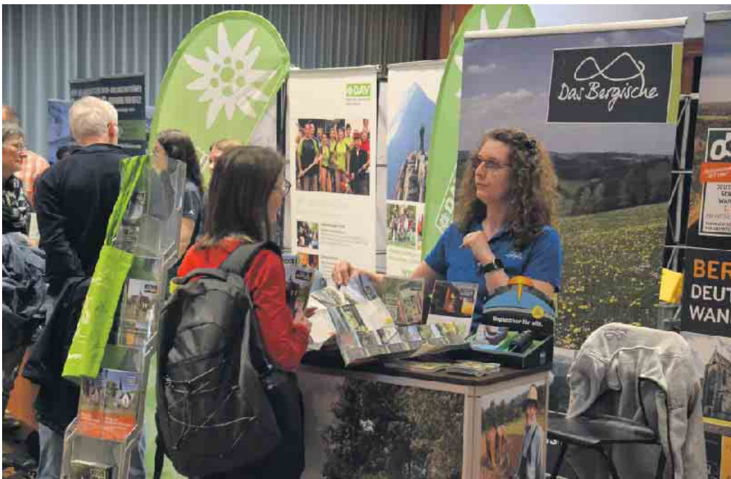
Wanderfreunde konnten sich über zahlreiche naturnahe Angebote im Siebengebirge und der Region informieren

Dabei machten die Aussteller deutlich, dass eine Auszeit in der Natur bei einer schönen Wanderung überaus entspannend und erholend sein kann. Das das Gefühl, mal wieder tief durchzuatmen, die Gedanken abzuschütteln und die Landschaft mit allen Sinnen wahrzunehmen, oftmals wie ein kleiner Urlaub wirken kann. Die Angebote und Information konnten sich die Wander-