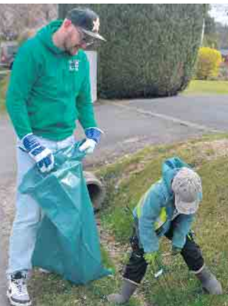
Auch der Nachwuchs packte vielerorts bei den Müllsammel-Aktion kräftig mit an