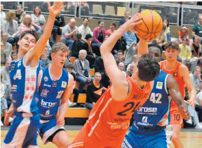
Den Korb stehts im Blick spielten die Dragons ein starkes zweites Viertel