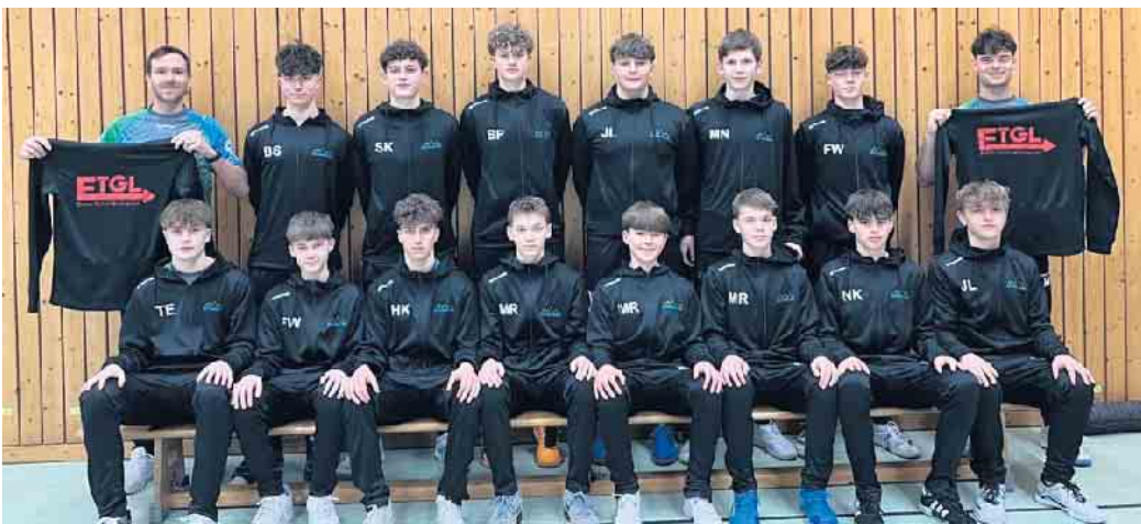
Mit einem reduzierten Kader fuhr die C1-Jugend der HSG ins Bergische, musste jedoch am Ende trotz einer tollen Leistung die Punkte dort lassen

(bk) Oberpleis. Mitte März ging es für die Regionalliga-Mannschaft der männlichen C1 der HSG Siebengebirge zum Auswärtsspiel nach Solingen gegen den Bergischen HC. Der BHC als Tabellenzweiter war klarer Favorit, zumal die deutliche Niederlage des Hinspiels noch präsent war. Zusätzlich war das Team der HSG sehr stark ersatzgeschwächt mit zwei Torhütern und nur acht Feldspielern. Entgegen der Praxis einiger anderer Teams der Liga, die häufig Spiele aufgrund der Abwesenheit einzelner Spielerverlegen ließen, sind die Siebengebirgler bei allen Saisonspielen wie angesetzt angetreten. Die Heimmannschaft verzichtete dank des großen Kaders auf einige Leistungsträger und hatte das Spiel insgeheim vermutlich schon als Sieg abgehakt. Das Spiel startete auch so, wie der BHC es geplant hatte. Siebengebirge hatte in den ersten fünf Minuten Mühe, konstruktiv nach vorne zu spielen. Der BHC startete einen furiosen 4:0 Lauf und man musste eine hohe Niederlage wie im Hinspiel befürchten.