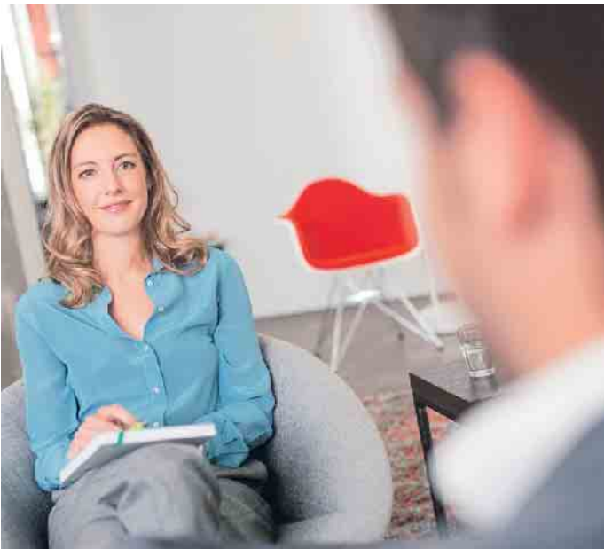
Als Coach anderen helfen, ihr volles Potenzial zu entfalten und persönliche Ziele zu erreichen.

Ein zentrales Merkmal des Weiterbildungsprogramms ist seine Flexibilität. Berufstätige können die Weiterbildung optimal in ihren Alltag integrieren. Digitale Lernhefte, Online-Vorlesungen, Webinare und vereinzelte Seminare ermöglichen es, die Lernzeiten flexibel zu gestalten und an individuelle berufliche und private Verpflichtungen anzupassen. (akz-o)