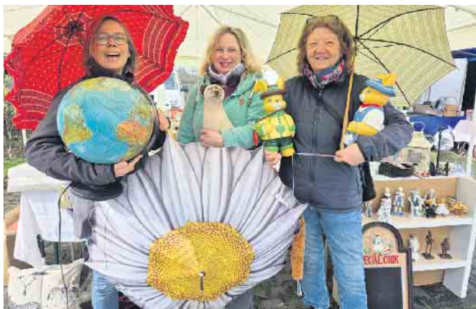
Immer gut gelaunt: Das Flohmkt-Team des Tierschutz Siebengebirge.

www.tierschutz-siebengebirge.de und www.facebook.com/TierschutzSiebengebirge und Instagram.