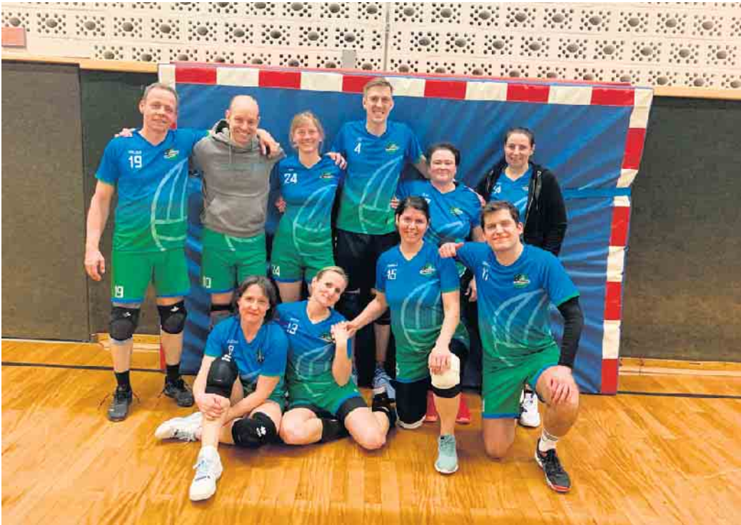
Die HSG Volleyballer nach der Niederlage gegen Rheinbach

„Wir haben zu viele Eigenfehler gemacht und die schwache Annahme hat uns immer wieder in