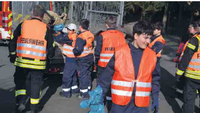
Im Oberhau packte die Jugendfeuerwehr bei dem Frühjahrsputz mit an

23. März statt. Vereine, Schulen, Kindergärten, politische Akteure, Unternehmen und private Initiativen waren wieder dazu aufgerufen, in einem selbst ausgewählten Bereich im Stadtgebiet gemeinsam Müll einzusammeln. Die Ortskerne, die Umgebung von Sportstätten und Schulen, die Landesstraßen zwischen den Ortsteilen, die Wirtschaftswege und Waldränder sowie die Ufer der Gewässer wurden durch die Aktion vor Beginn der Vegetationsperiode vom achtlos verstreuten Müll befreit. Jede Gruppe konnte sich ein Gebiet in der direkten Nachbarschaft oder im Stadtgebiet von Königswinter zum Sammeln des Mülls aussuchen. Gemeinsam mit einer Gruppe von Mitarbeitenden der Ver-