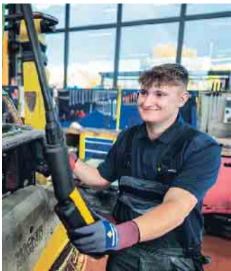
Wichtige Aufgabe - Land- und Baumaschinenmechaniker halten Maschinen am Laufen und sind verantwortlich für deren Wartung und Reparatur.

Bauunternehmen Depenbrock (www.depenbrock.de), erklärt, was Interessenten für den Berufseinstieg brauchen. Technik-Interesse und Tatkraft gefragt Land- und Baumaschinenmechaniker erstellen Fehler- und Stö-