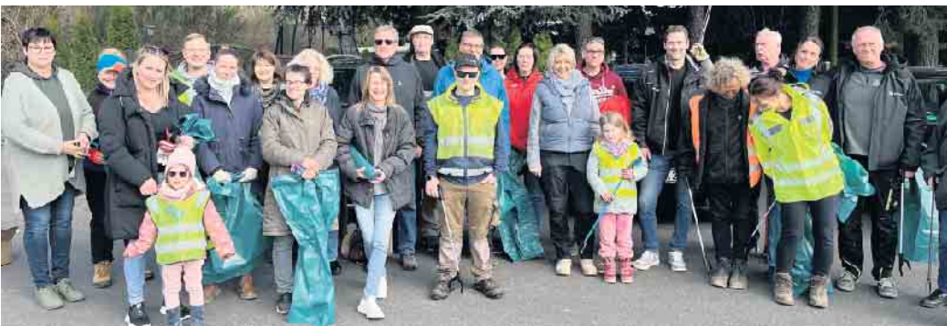
Bevor man sich verteilte, traf der Müllsammel-Trupp in Eudenbach am Sportlerheim

23. März statt. Vereine, Schulen, Kindergärten, politische Akteure, Unternehmen und private Initiativen waren wieder dazu aufgerufen, in einem selbst ausgewählten Bereich im Stadtgebiet gemeinsam Müll einzusammeln. Die Ortskerne, die Umgebung von Sportstätten und Schulen, die Landesstraßen zwischen den Ortsteilen, die Wirtschaftswege und Waldränder sowie die Ufer der Gewässer wurden durch die Aktion vor Beginn der Vegetationsperiode vom achtlos verstreuten Müll befreit. Jede Gruppe konnte sich ein Gebiet in der direkten Nachbarschaft oder im Stadtgebiet von Königswinter zum Sammeln des Mülls aussuchen. Gemeinsam mit einer Gruppe von Mitarbeitenden der Ver-