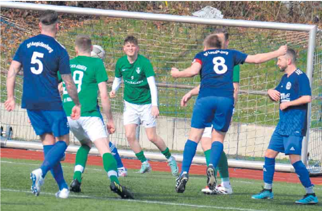
Zweimal schlossen die Sportfreunde ihre Angriffe erfolgreich ab und behielten dadurch den Aufstieg in die Kreisliga A weiterhin im Auge

(bk) Aegidienberg. Die Sportfreunde Aegidienberg haben eindeutig das Ziel, nach dem Abstieg wieder in die Kreisliga A aufzusteigen. Sie spielen im oberen Tabellendrittel mit und wollten sich im Heimspiel gegen den SV Allner-Bödingen II wichtige Punkte sichern. Somit stand der Zweitvertretung des SV Allner-Bödingen eine schwere Partie bevor. Als Tabellendreizehnter mit bereits zehn Niederlagen aus