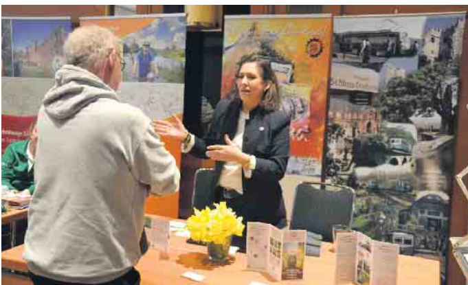
Die Tourismus GmbH Königswinter organisierte die Ausstellung im Maritim Hotel