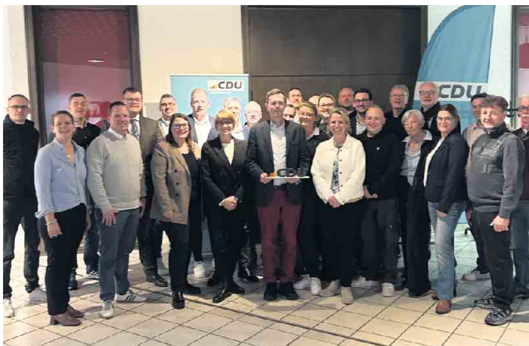
Das Team der CDU Königswinter zur Kommunalwahl am 14. September 2025.

„Wir haben bei der Wahl 2020 eine Lektion erteilt bekommen. Die Lektion, dass es nicht so weiter geht wie bisher. Dass wir einige Dinge ändern müssen und personell eine bessere Mischung brauchen - von