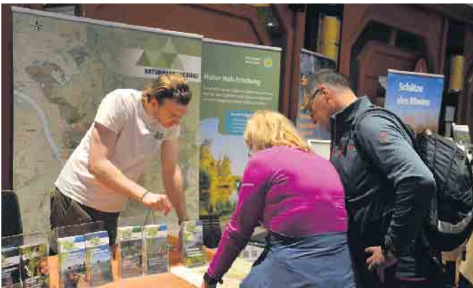
Der Naturpark Siebengebirge stellte sich auf der WanderArt vor

Vorträge zu dem Thema „Wasserburgenroute mit 120 Burgen und Schlösser mit dem Rad entdecken“, „Momente statt Routen - mehr als nur ein Ziel“, Entdecke besondere Momente für Deine Reise- und Freizeitgestaltung“, „Mikroabenteuer auf dem Rheinsteig“, „Rheinsteig im Siebengebirge - beste Gipfel und schönste vulkanische Aufschlüsse“ und „Rheinsteig in Unkel - Stelenweg und Kultur & Geo - Schleife“ begleiteten im Rahmenprogramm die Wandermesse. Zahlreiche Wanderfreunde fanden den Weg ins Maritim-Hotel, auch wenn, so der Organisator, die Besucherzahl gegenüber dem Vorjahr leicht zurück gegangen war.