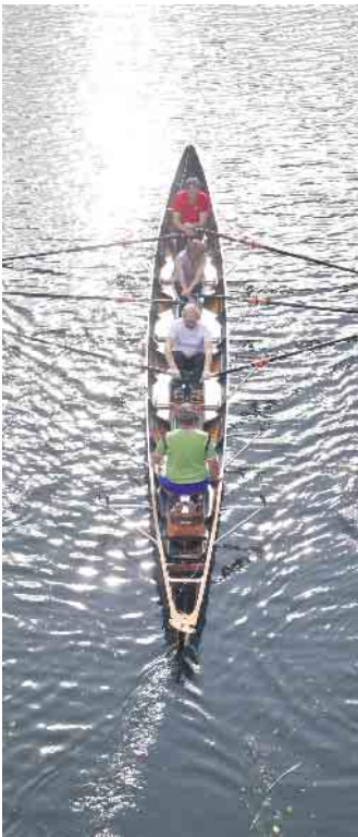
Anfängertraining auf dem toten Rheinarm.

Email- Adresse an: ruderwart@wsvhonnef.de Bitte teilt mit, an welchem Tag ihr beim Schnupperrudern teilnehmen möchtet. Weitere Informationen unter: www.wsvhonnef.de