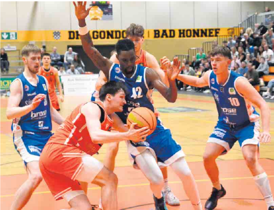
Mit zunehmender Spieldauer schmolz der komfortable Vorsprung des Gastgebers, am Ende reichte jedoch der 7-Punkte-VorsprungEnde

(bk) Bad Honnef. Die Dragons gewinnen das wichtige Spiel gegen BBC Coburg mit 104:97. Es war die erwartet harte Auseinandersetzung zweier Teams auf Augenhöhe. Am Ende entschied die bessere Dreier-Quote das Spiel zugunsten der Rheinländer. Damit verschafft sich Rhöndorf im engen Rennen um die Playoffs ein wenig Luft. Die Begegnung zwischen Rhöndorf und Coburg war über weite Strecken von Serien beider Teams geprägt. Die ersten fünf Minuten bestimmten die Gäste. Rhöndorf ließ beste Chancen aus und wirkte in der Defensive unorganisiert. Dann wachten die Hausherrn auf, erhöhten an beiden Enden des Spielfelds die Intensität und glichen binnen 70 Sekunden zum 14:14 aus. In der Folge netzten die Dragons Dreier um Dreier ein und setzten sich bis zur achten Minute erstmals zweistellig mit 29:17 ab. Im zweiten