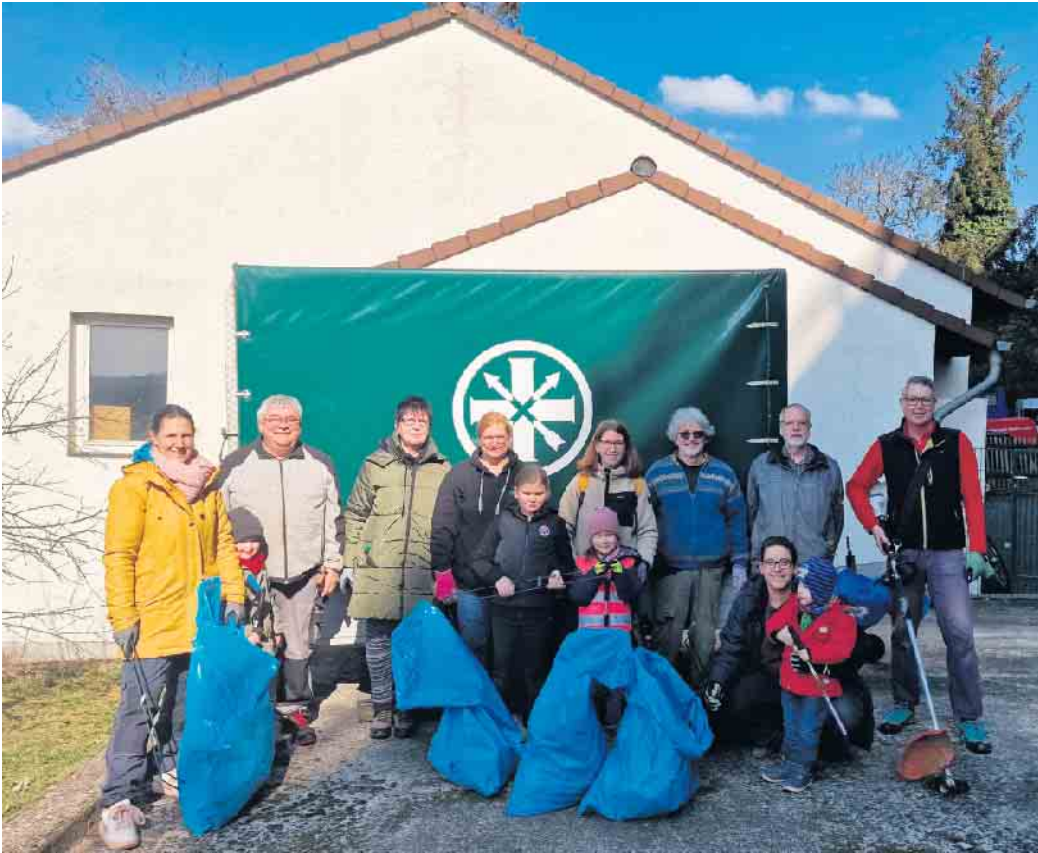
Die Gruppe der Aktiven vor dem Zeughaus der St. Sebastianus Männer Schützenbruderschaft