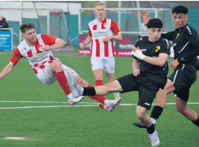
Für die Fans des TuS 05 waren es oftmals bange Minuten bis der Schlusspfiff den Sieg gegen Deutz amtlich machte

den die Kicker aus Oberpleis zu Gast bei GW Brauweiler sein. Brauweiler musste sich im letzten Spiel dem SV Schlebusch geschlagen geben und rutschte auf den 8. Tabellenplatz ab. Sicherlich keine leichte Aufgabe für die Gäste aus Oberpleis. Bleibt abzuwarten, ob ein weiterer Sieg möglich sein wird, dem TuS 05 Oberpleis tät dies sehr gut.