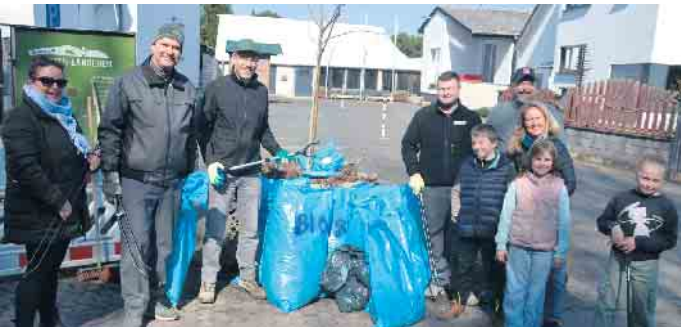
In Oelinghoven endete die Sammelaktion am Dorfgemeinschaftshaus