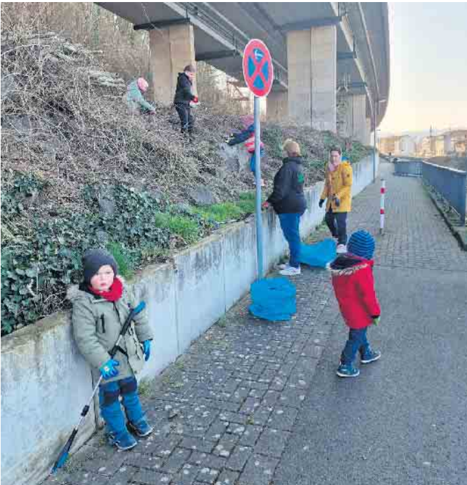
Früh übt sich, wer für die Gemeinschaft einen Beitrag leisten will

zusetzen, denn dies gehört mit zu den Grundwerten, denen sich die Sebastianer verschrieben haben.