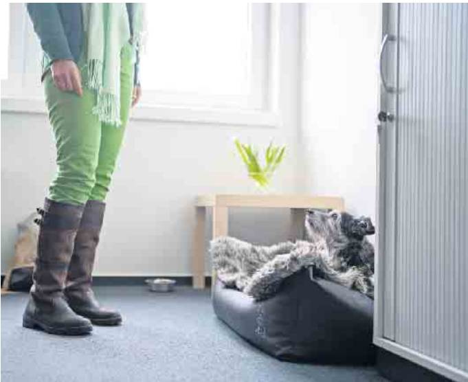
Kollege auf vier Pfoten: Hunde im Büro werden von vielen Unternehmen akzeptiert. Wichtig sind jedoch klare Regeln.

Tipps und nützliche Regeln für den Umgang mit Bürohunden