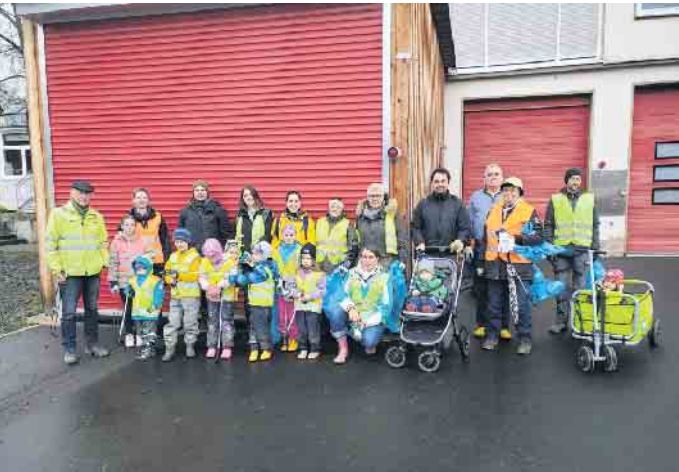
Frühjahrsputz in Uthweiler

Große und kleine fleißige Helfer waren am Samstag, 16. März, in Uthweiler und Umgebung unterwegs, um Unrat an Straßen und Wegen einzusammeln. Die Stadt Königswinter hatte in ihrer Aktion Frühjahrsputz wieder dazu aufgerufen, gemeinsam für ein „sauberhaftes“ Königswinter zu sorgen. Der Kindergarten Zwergenland kam gemeinsam mit dem Bürgerverein Uthweiler diesem Aufruf gerne nach. Am Nachmittag trafen sich etliche Freiwillige vor dem alten Feuerwehrhaus, um in mehreren Gruppen in den Ortsteilen Uthweiler, Freckwinkel, Nie-