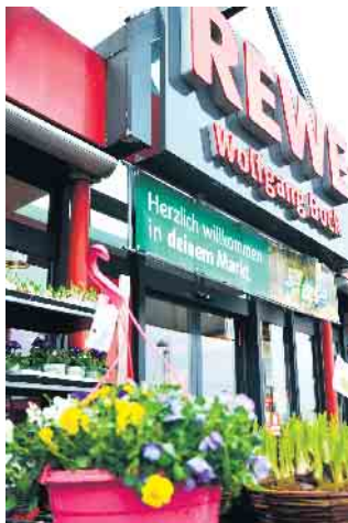
Ein schöne Osterzeit wünscht Ihnen das Team des REWE-Marktes Wolfgang Bock

Das Team des REWE Marktes Wolfgang Bock in Thomasberg wünscht auch in diesem Jahr eine schöne Osterzeit