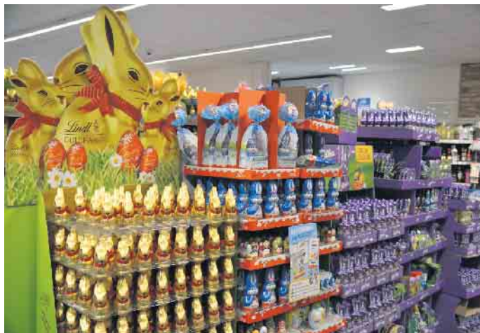
Noch stehen die Osterhasen zusammen, an Ostersonntag werden sie sich im Markt verteilen

(bk) Thomasberg. Der Osterhase trotz stets Wind und Wetter. Gut behütet gehören sie nun wieder seit Wochen zum Sortiment des REWE Marktes von Friederike und Wolfgang Bock in Thomasberg - die leckeren Schokoladenhasen. Noch stehen sie gut sortiert in den Verkaufsständen. Doch bald werden sie sich im Markt verteilen und sich dort an vielen Stellen im geräumigen Marktinne- rum tummeln. 100 dieser leckeren Häschen warten darauf, entdeckt zu werden. „Es ist auch in diesem Jahr wieder eine Überraschung der besonderen Art“, so Wolfgang Bock, „Zahlreiche kleine, goldene und süße Osterhasen haben sich zwischen unserem vielfältigen Angebot in den Regalen versteckt und warten nur darauf von Ihnen gefunden zu