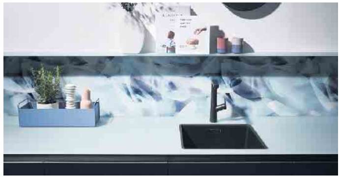
Mit Glas lassen sich sehr individuelle Lifestyles realisieren - beispielsweise diese Komposition in zartem Gletscherblau, bei der das Motiv der Glas-Rückwand ideal mit dem Farbton der Glas-Arbeitsplatte harmonisiert.