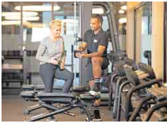
Wer trainiert, möchte dabei gut betreut sein: Fachkräften bieten sich in der Fitness- und Gesundheitsbranche sehr gute berufliche Perspektiven.

Gesundheit ist ein zentraler Wert in der Gesellschaft; während der Pandemie hat sich der hohe Stellenwert von Fitness- und Gesundheitstraining deutlich gezeigt. Nach den Beschränkungen der vergangenen Jahre kommen immer mehr bestehende und neue Mitglieder in die Anlagen, um von den positiven Effekten eines Trainings langfristig zu profitieren. Das illustrieren die kürzlich erhobenen „Eckdaten der deutschen Fitnesswirtschaft 2023“. Darüber hinaus haben Fachkräfte in der Zukunftsbranche attraktive berufliche Möglichkeiten. Wer trainiert, möchte dabei gut betreut sein: Fachkräften bieten sich in der Fitness- und Gesundheitsbranche sehr gute berufliche Perspektiven.