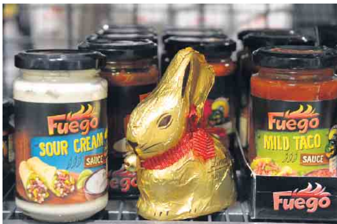
Aus den zahlreichen Regalen schauen die Osterhasen heraus - die Suche lohnt sich