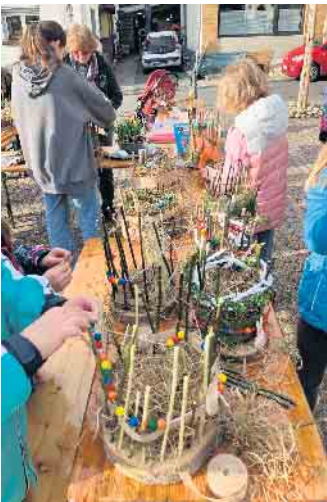
Die Aktion des Bürgervereins war eine schöne Vorbereitung auf die Osterzeit.