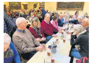
Im Brauhaus.

wies einmal mehr, dass schlechtes Wetter und Widrigkeiten keine Hindernisse darstellen wenn es darum geht, gemeinsam neue Orte zu erkunden und gesellige Momente zu erleben.