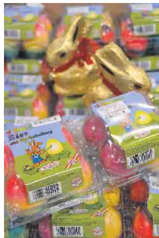
Zwischen den Ostereiern fühlen sich die Schokohasen besonders wohl

laden Sie dazu recht herzlich in unseren Markt ein.“ Neben diesem besonderen Osterhasen-Erlebnis lädt der REWE-Markt dazu ein, auch weitere Services zu nutzen. So findet man in der Obst- und Gemüseabteilung täglich frisch angeliefertes Obst aus der Region, sowie der näheren Umgebung. In der Bioabteilung verschiedenste Artikel, die sonst nur in Biofachgeschäften zu finden sind. An der Servicetheke eine große Auswahl an verschiedensten Fleisch-, Käse-, Wurstsorten, serviert durch hochqualifizierte Mitarbeiter. Die Kühltheke hält eine riesige Auswahl an verschiedenen Fleisch-, Wurst-, Käse-, und Buttersorten, sowie ein breites Joghurtsortiment, darunter sehr viele Landliebe Variationen und auch Quark- und Milchsor- ten vor. In der Weinabtei-