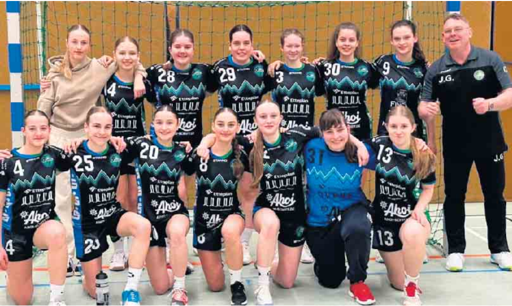
Die weibliche B2 stellte ihr Leistungsvermögen gegen den Kaller SC eindrucksvoll unter Beweis

Weibliche B2 der HSG gewinnt gegen Kaller SC mit 10:1