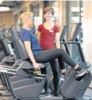
In der Zeit der Pandemie ist die Bedeutung von Fitness- und Gesundheitsanlagen im Bewusstsein von Gesellschaft und Politik gewachsen.