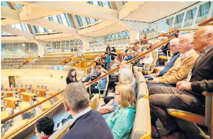
Im Plenarsaal.

Oberpleis. (as) Die Wetter-App hatte Regen vorhergesagt, auch für Düsseldorf. Leider behielt sie Recht. Trotzdem trafen sich 38 Montagstreffler, Partnerinnen und Freunde rechtzeitig in Oberpleis. Der Bus startete pünktlich um 8 Uhr, zunächst zum Zwischenstopp nach Hennef. Dort warteten noch 12 Mitglieder der befreundeten ZWAR-Gruppe, die sich der ersten Tagesfahrt des Montagstreff Oberpleis in diesem Jahr angeschlossen hatten. Nicht nur das regnerische Wetter, auch der Streik im ÖPNV sorgte für volle Straßen. In Düsseldorf angekommen, wurde die Gruppe im Landtag herzlich empfangen. Bei einem klei-