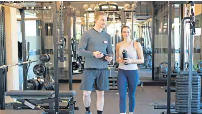
Fitness- und Gesundheitsanlagen etablieren sich zunehmend als elementare Bestandteile der Gesundheitsversorgung.