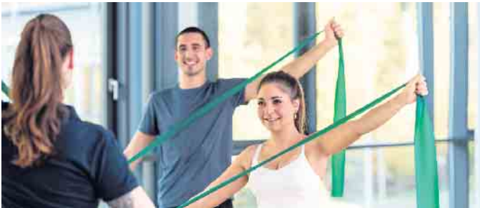
Ausbildungen und Studiengänge im Fitness- und Gesundheitsbereich eröffnen zahlreiche berufliche Möglichkeiten.