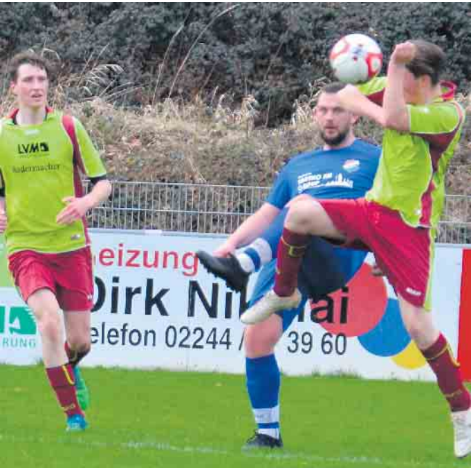
Der Start in die Partie lief für die TuS-Reserve noch nach Plan, mit zunehmender Spieldauer baute das Team ab

Das Team des TuS Eudenbach in der Kreisliga C geht gegen den TSV Germania Windeck unter