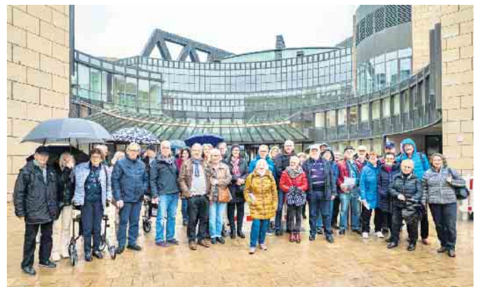
Vor dem Landtag.