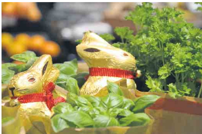
An vielen Stellen des Marktes werden die leckeren Schokohasen zu finden sein