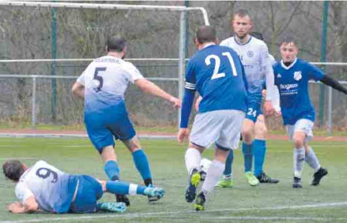
Die SFA-Reserve tat sich schwer gegen die Gäste, den TV Rott

Das Auftaktspiel des Jahres in der Meisterschaft gegen den TV Rott verlieren die Herren II der SF Aegidienberg mit 0:2, gegen SV Allner-Bödingen III gab es ein 2:6-Klatsche und das Spiel gegen den FSV Neunkirchen-Seelscheid endet torlos