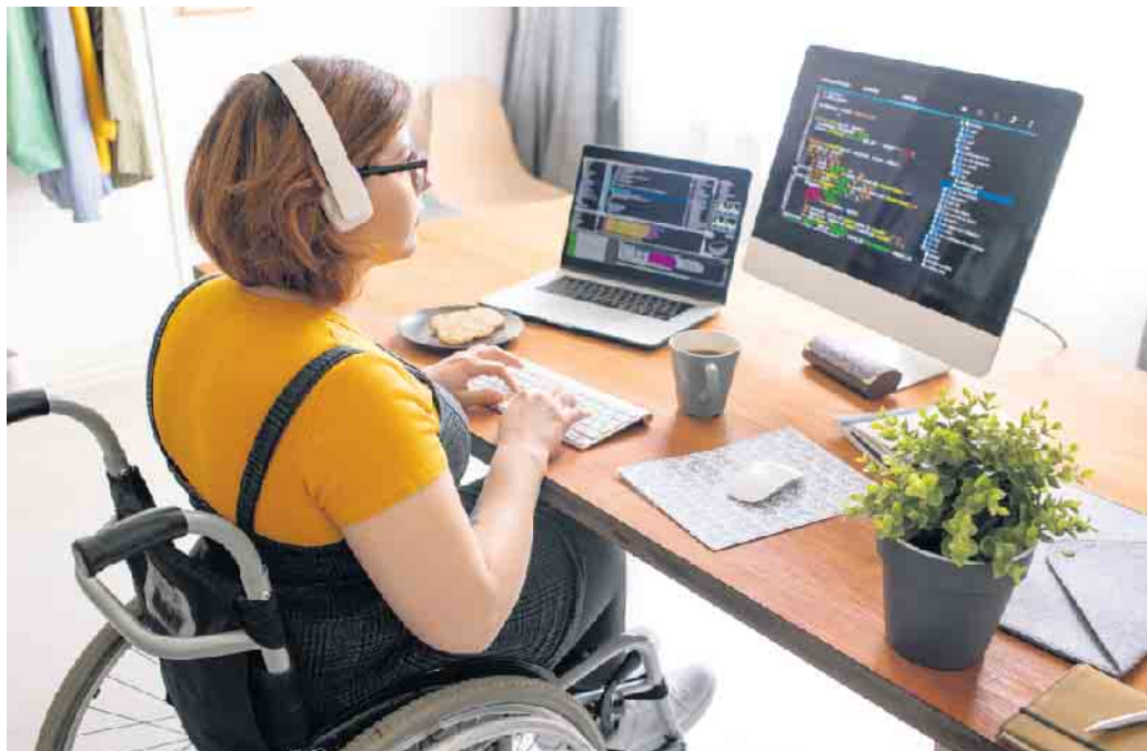
Menschen mit Behinderung können im Job genauso glücklich werden wie Nicht-Behinderte auch.

Menschen mit Behinderung als gern gesehene Job-Bewerber