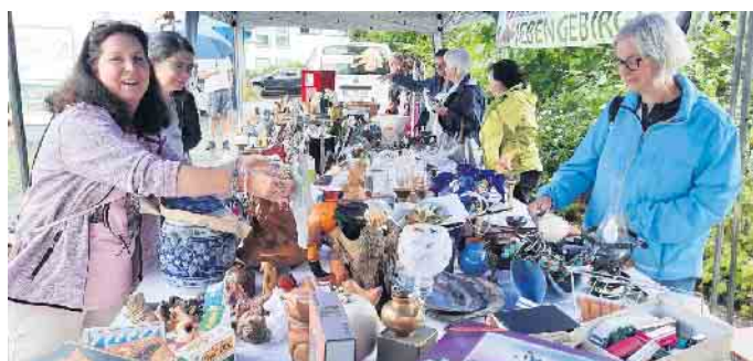
Auf den Tierschutz Flohmärkten ist immer was los

ternetseite lohnt sich immer, denn dort erfahren Tierschutz-interessierte Menschen, was im Verein aktuell passiert, welche Tiere ein Zuhause suchen, welche wichti-