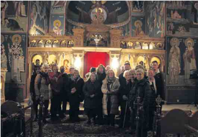
Kultur und Gesang auf dem Chorausflug

Anschließend ging es nach Oberkassel zum Essen. In geselliger Runde und mit Trinkliedern ging der Ausflug und ein schöner Tag mit vielen Eindrücken zu Ende.