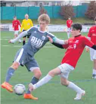
Kein Ball wurde verloren gegeben und aus allen Lagen wurde um die Ballhoheit gekämpft