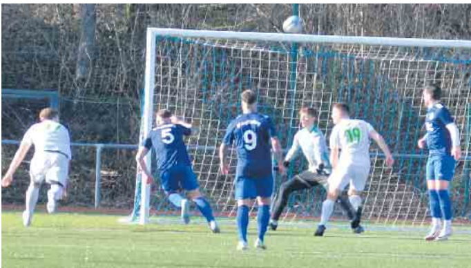
Ständig lauerte Gefahr im Strafraum des Sportfreunde