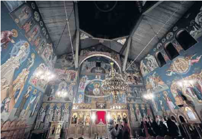
Die griechisch-orthodoxe Kirche in Bonn Beuel

Überwältigend für die Besucher waren die vielen Ikonen- und Wandmalereien. In einer Kirchenführung wurden die Bedeutungen dieser erklärt und viel zum Aufbau einer griechisch-orthodoxen Kirche, z.B. dass die Kuppeln nicht nur architektonische Elemente sind, sondern auch spirituelle Symbole darstellen, die die Gläubigen in die himmlische Sphäre erheben. Erklärt wurden auch die Rituale, Gebräuche, die Gesänge und das Gemeindeleben. Danach erlebte der Chor einen Vesper-Gottesdienst mit griechisch-orthodoxer Chorbegleitung unter der Leitung eines Kantors. Gesungen wurde in altgriechischer Sprache, wobei die Notation dem Chor völlig neu war. Es wurden