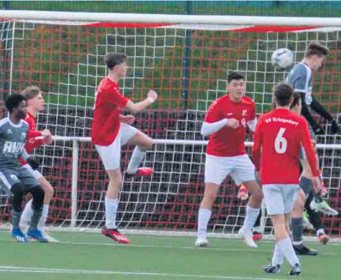
Der TuS 05 setzte die Kriegsdorfer Abwehr mächtig unter Druck

A-Junioren des TuS 05 Oberpleis trennen sich im Heimspiel gegen den SV Kriegsdorf mit einem 1:1, auswärts gegen Hangelar gewinnt die U19 mit 4:1