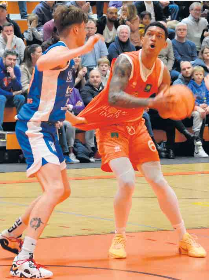
Den Korb im Blick - die Dragons machten das Spiel spannend, konnten am Ende jedoch die Punkte einfahren

Dragons Rhöndorf siegen in einem packenden Spiel gegen die BBC Coburg mit 96:92