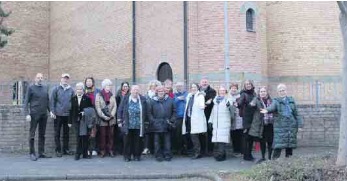
Der Ittenbach / Operpleiser Kirchenchor auf Chorausflug.