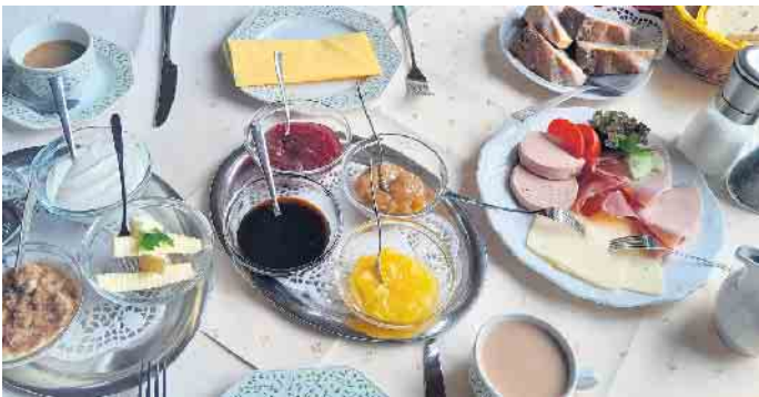
Gemeinsam essen, trinken und reden an der Bergischen Kaffeetafel.